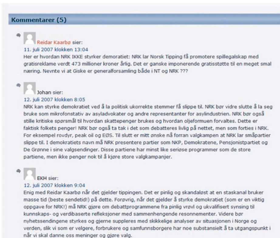
Figur 2. Eksempel på kommentarer til artikkel som presenterer en av NRK-plakatens deler (Skjerm bilde 13.12.09).

Muligheten for å kommentere selve forslaget ble supplert med i alt 14 redaksjonelle artikler relatert til plakaten. Ni av disse var debattartikler skrevet av inviterte bidragsyttere, som medieforskere og samfunnsdebattanter. Tre var aktuelle nyhetsartikler og reportasjer skrevet av redaksjonen, og to artikler som omhandlet den løpende debatten. Det kom inn i alt 62 leserkommentarer til plakaten og artiklene innen høringsfristen. 3 35 kommentarer var signert med fullt navn, 27 med psevdonym, fornavn eller lignende. Enkelte av delartiklene tiltrakk seg særlig mange kommentarer. Spesielt gjaldt det plakaten del 2, som redaksjonen hadde gitt overskriften «Bør NRK-lisensen videreføres?». Innen høringsfristen kom det 29 kommentarer her. Plakatens del 5 ble vinklet på spørsmålet om reklame på NRK, og her kom det 11 kommentarer. Noen av de øvrige plakatdelene og artiklene tiltrakk seg derimot få eller ingen kommentarer.