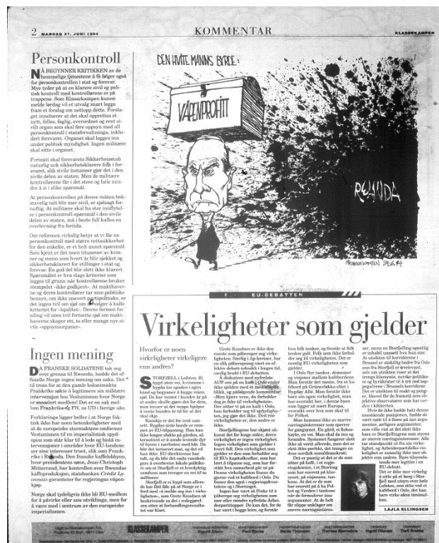
Illustrasjon 5.2.

Dette er sterke ord. Vestunionen beskrives som en imperialistisk spydspiss , et redskap for å sikre EU-landenes interesser. Redaksjonen hevdet ikke bare at norsk medlemskap i EU ikke var i nasjonens beste interesse, men at et eventuelt medlemskap ville bli inngått på helt feil premisser – egengevinst fremfor en mer rettferdig global utvikling. På samme side som artikkelen sto følgende illustrasjon av ”den hvite manns” rolle i Rwanda: