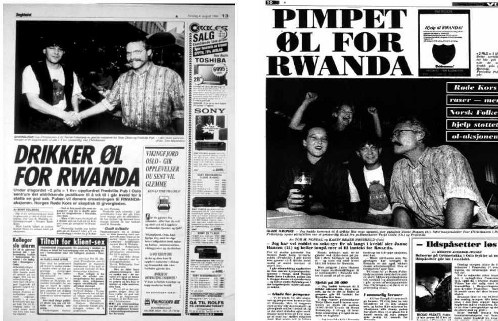
Illustrasjon 4.3.

flyktningene, i likhet med de innsatte ved Oslo kretsfengsel. 397 Også deler av utelivsbransjen støttet opp under nødhjelpsarbeidet for flyktningene, og VG og Dagbladet skrev at puben ”Fredville” satte i gang aksjonen ”2 pils=1 liv”. 398 I følge VG både gikk, løp og giftet nordmenn seg for Rwanda. 399