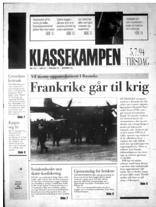
Illustrasjon 5.1.

Johansens artikkel om fransk krigføring i Rwanda stod sentralt på avisens forside 5. juli: