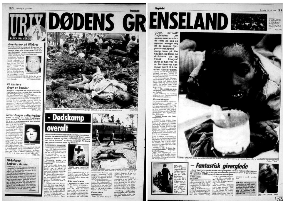
Illustrasjon 4.1.

Fotomaterialet fra flyktningleirene var preget av små barn i nød: