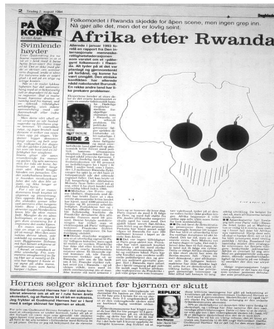
Illustrasjon 3.1. Kilde: Dagbladet 2. august 1994:2.