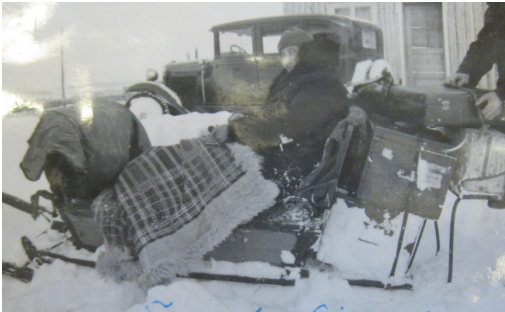
Bilde 3: En reisesøster måtte alltid ta seg rundt i distriktene.

Samarbeidspartnerne i lokalsamfunnene må også ha hatt en sosial funksjon. De var personer reisesøsteren kunne snakke med og omgås. Siden reisesøstre var på reise i distriktene storparten av året, var det trolig vanskelig å ha tette familiære bånd. 97 Denne antakelsen blir forsterket av at reisesøstre svært sjeldent nevnte egen familie i kildene og at flere brukte feriene til arbeid. Riktignok giftet en av reisesøstre seg på slutten av 30-tallet, men det var unntaket heller enn regelen, og denne reisesøsteren holdt seg stort sett i sitt nærområde etter giftemålet. Generelt sett må det har vært vanskelig å kombinere familielivet med et ”kuffertliv”.