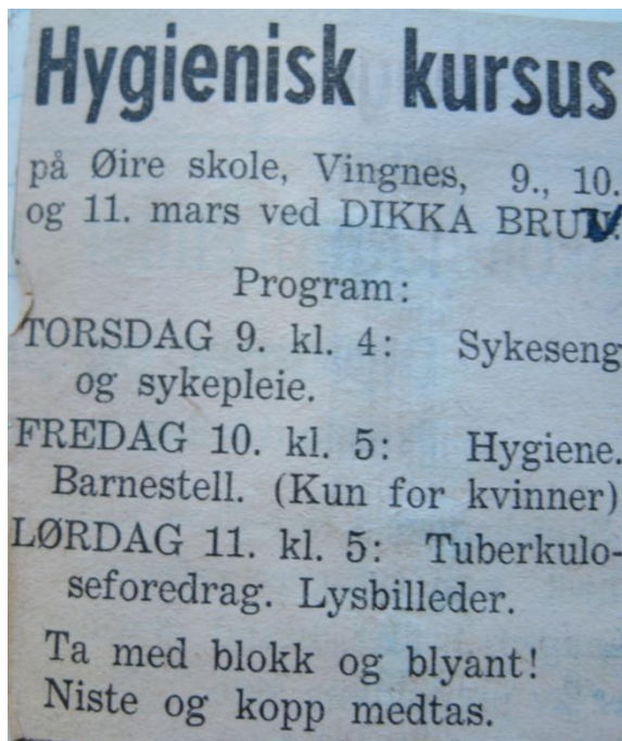
Bilde 2: Annonser i lokalavisene var et viktig markedsføringstiltak.

Masseopplysningen var foredrag, kurs og demonstrasjoner. I denne delen av virksomheten skulle reisesøsteren forholde seg til en gruppe mennesker samtidig og formidle