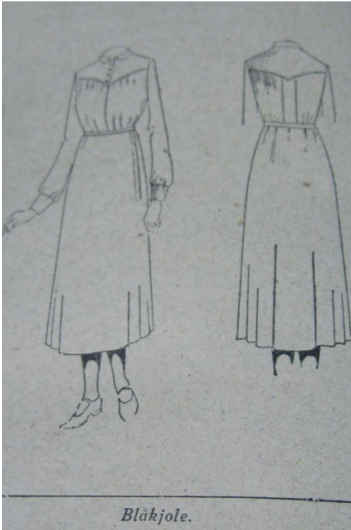
Bilde 5: Nasjonalforeningens reglementerte drakt.