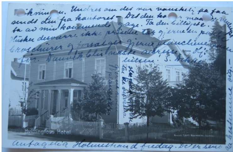
Bilde 8: Noen ganger hadde reisesøstrene mer på hjertet enn det baksiden av et vanlig postkort kunne romme.

Disse sidene ved forholdet var trolig mer enn bare en strategi, i likhet med reisesøstrenes engasjement og innlevelse i lokalsamfunnene. Flere av reisesøstrene arbeidet med Øverland i mange år, enkelte av dem også i tiår. Det er sannsynlig at det gode forholdet baserte seg på personlige relasjoner, ikke bare strategier for