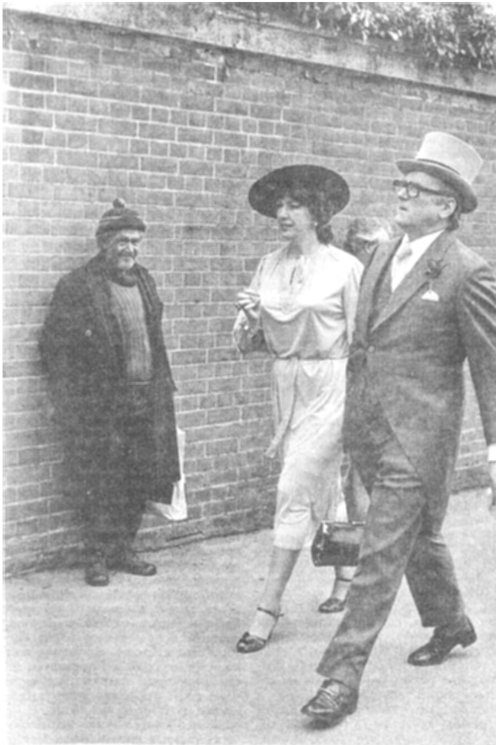
Богатые и бедные: скачки в Эскоте. Великобритания, 1981. Джон Старрок/Рафо