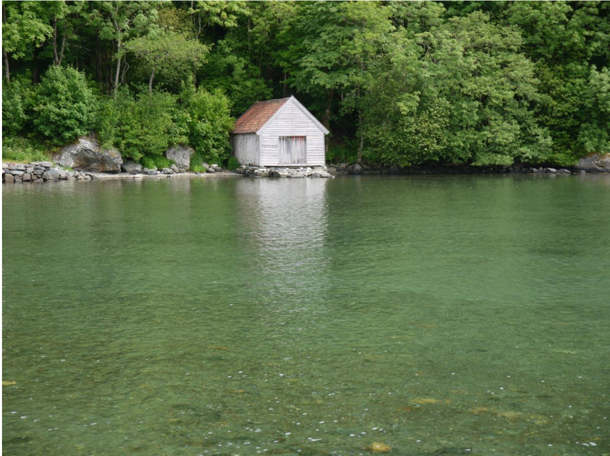
Figur 20: Mildenaustet fra ca. 1820.

Fotlandsvåгнаustet er et laftebygg med store dimensjoner og store skiferheller på taket. Det er ukjent når og av hvem dette naustet er satt opp av, men en del av den gamle bordkledningen er økset, noe som kan tyde på at bygget er svært gammelt. Dimensjonene i bygget og lokale undersøkelser der naustet lå, peker mot slutten av 1600-tallet. Bygget ble et offer for utbygging i vågen det lå på Osterøy på 1980-tallet. Hordamuseet så straks mulighetene for å kunne utvide bildet av hvilke sjøhus og naust en kunne finne langs strender og vikene i Hordaland. Naustet ble gitt i gave til museet og satt opp i 1984.