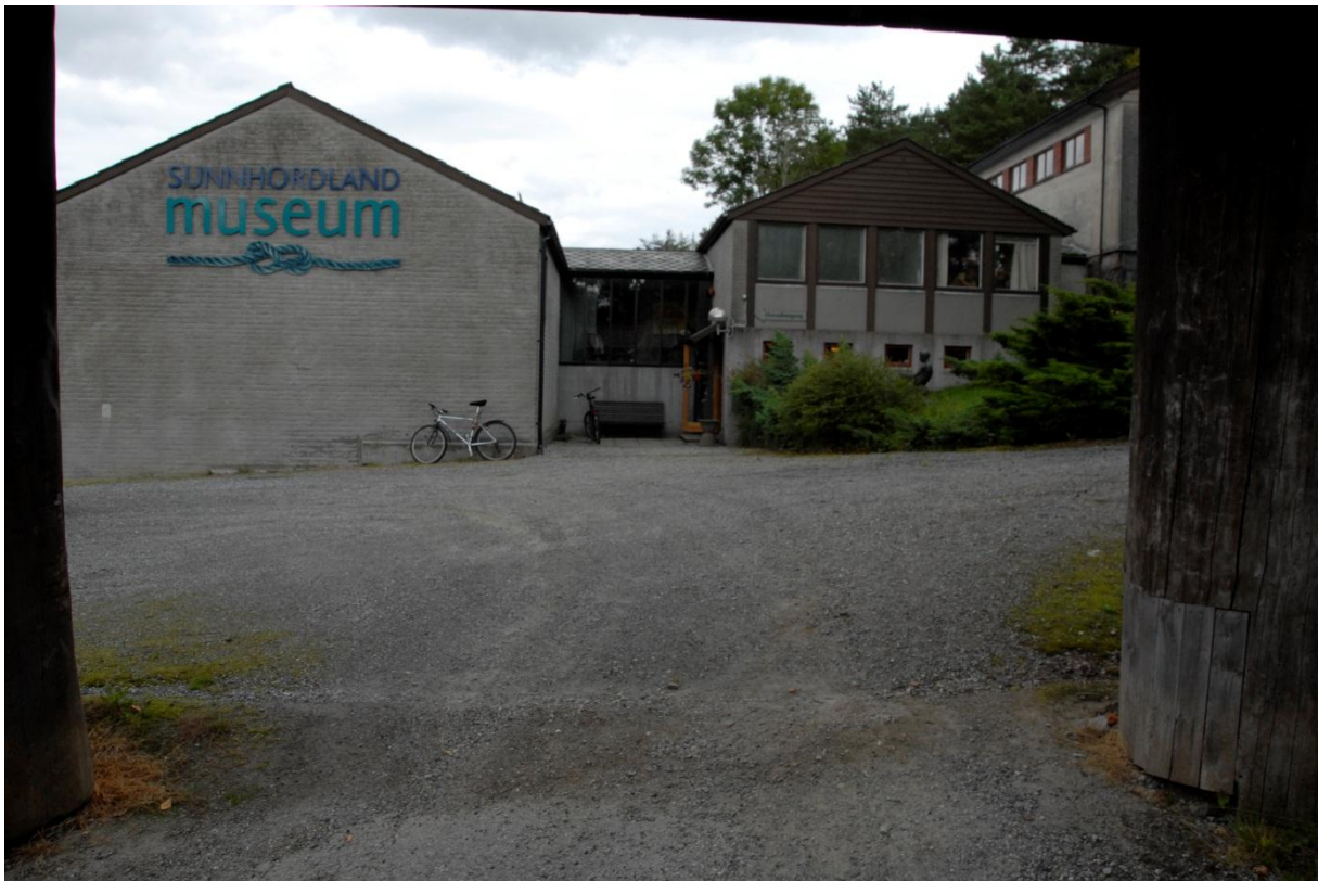
Figur 1: Hovedmuseet ved Sunnhordlandstunet. Museet har blitt utvidet flere ganger siden det første bygget ble reist i 1938, siste gang i 1989. Det er også planer om nye utvidelser.