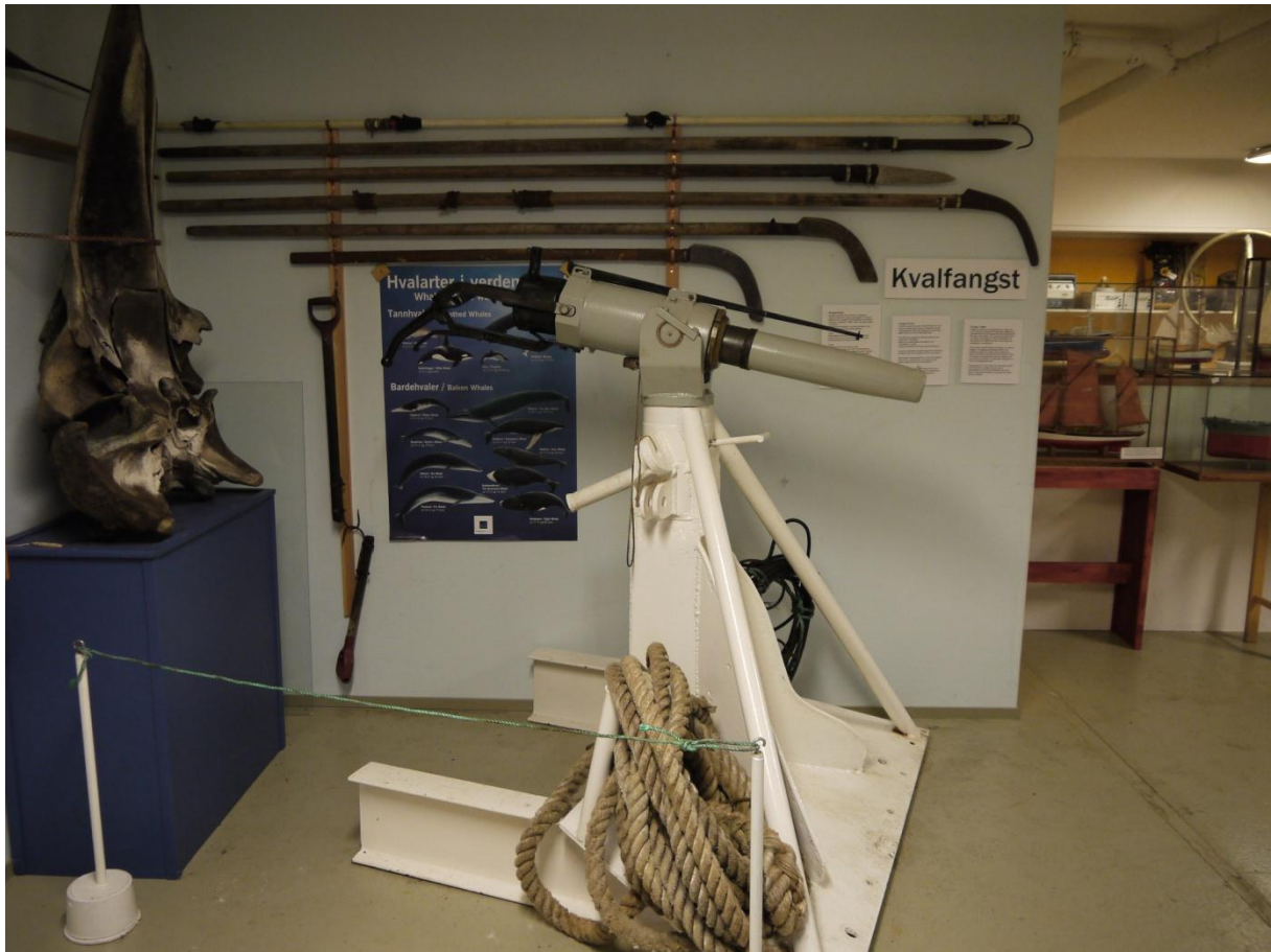
Figur 5: Delutstillingen om hvalfangst. Her er det rikelig med redskaper fra denne fangsten. Informasjon er på veggen.

ble dradd opp på stranden og drept med kniv og øks, eller de ble skutt med jernpiler og armbrøst. På 1800-tallet overtok riflen som likvideringsmetode.