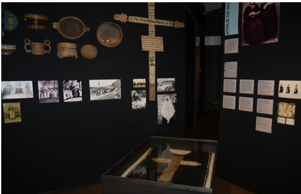
Figur 16: To vegger som inneholder mer kulturelle og "mykere tema". Hverdagslivet har fått rikelig med plass i utstillingene.

Viktige merkedager i livet har fått en egen vegg. Det samme har kirke og skole. Gudstro og kirken var en naturlig del av fiskerbondens hverdag. De måtte også betale tiende til kirken av alt de produserte, og om søndagen møttes folket til gudstjeneste og sosialt samvær. Skoleloven av 1739 var en fortsettelse av reformasjonen, og den første tiden fungerte skolegangen som en forbededelse til konfirmasjonen, senere kom flere fag med.