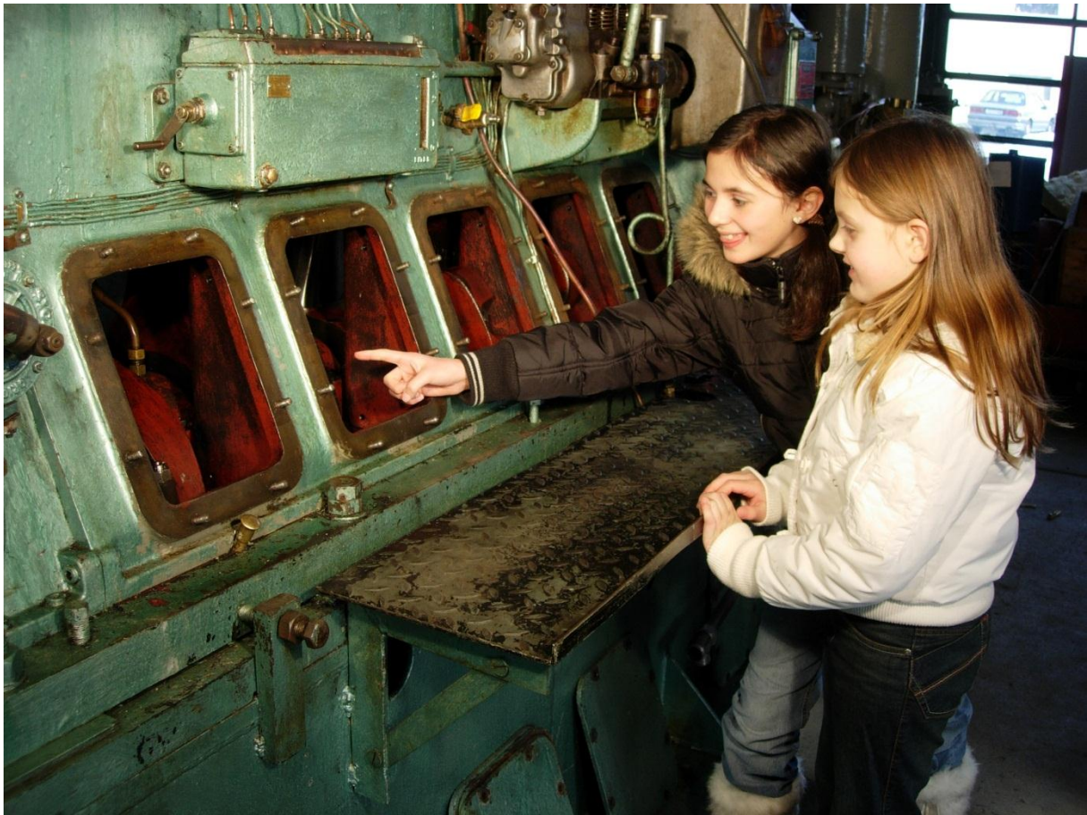
Figur 11: Fra undervisningsopplegget: "Fjordabåten Kjem". Dette opplegget inkluderer blant annet stasjonsarbeid der oppgaver knyttet til motorsamlingen er inkludert.

Et tredje undervisningsopplegg: "Små kår, store draumar" går ut på rollespill knyttet til kyst- og fiskerihistorien. Dette opplegget er også beregnet på 5.-7. klasse. Kort beskrevet er det ulike roller som elevene skal sette seg inn i. Mange av temaene tar utgangspunkt i sildefisket i andre halvdel av 1800-tallet, og spesielt hva som skjedde da silda forsvant. En skal eksempelvis sette seg inn i hvordan det var å være handelsmann på den tiden. Handelsmannen har levd av investeringer knyttet til sildefisket. Nå er fisket borte, men han har oppspart kapital i banken. Hva kan disse nå investeres i? De andre på gruppa skal da lansere ulike løsninger som kunne være aktuelle, eller de er personer som oppsøker handelsmannen for å få hjelp siden de selv er blitt arbeidsledige.