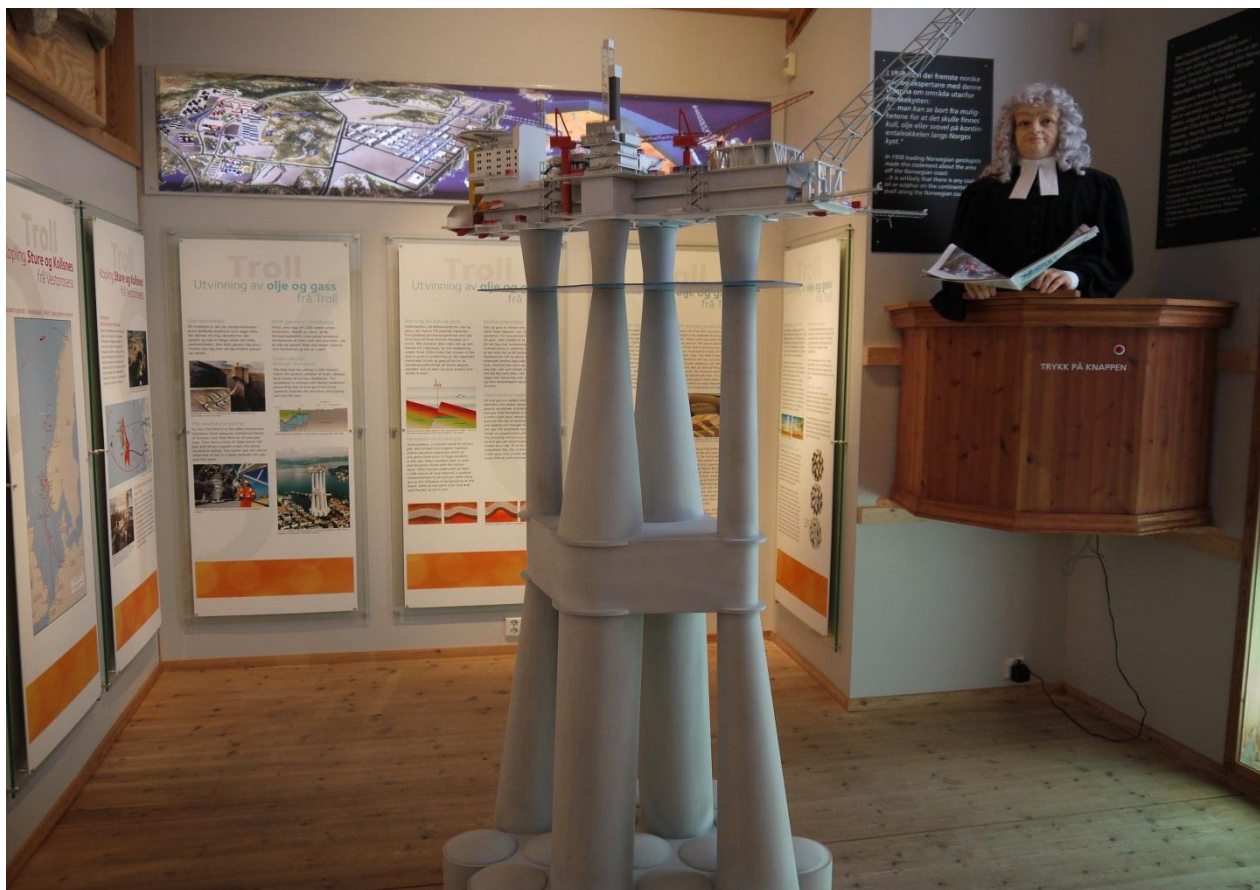
Figur 26: En modell av Troll-plattformen. En viktig del av Øygardens nyere historie.

transportnettet mellom olje- og gassfeltene til Kollsnes-Sture-Mongstad, og videre til mottagere på Kontinentet. En liten kuriositet i utstillingen er en tekst og ”lydavspilling” av biskop Erik Pontoppidan, som i sin tid visstnok kom med forutsigelser om at Norge hadde store mengder petroleum like utenfor kysten vår.