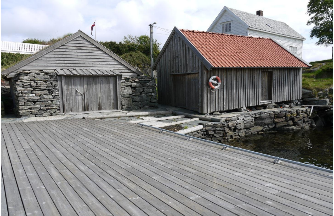
Figur 27: Naustutstillingen ligger i nauset til høyre. De andre byggene tilhører også museet.

I 2009 åpnet en ny utstilling i et naust ved vågen. Dette nauset var tidligere delvis brukt som utstillingslokale og delvis som båtopplag om vinteren. Museet ønsket å utnytte bedre den store samlingen av redskaper som tidligere hadde vært brukt i småfiske i nærrområde. Den er uformet av Geir Sebjørnsen i Museum Vest, som har hentet inspirasjon ifra Nasjonalmuseet i København, særlig en utstilling som åpnet der året før.