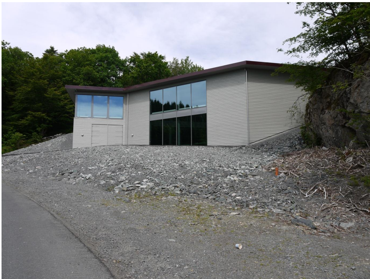
Figur 18: Den nye båthallen sett fra utsiden. Bygget er det første en ser når en kjører inn mot museumsområdet.

Hordamuseets store samling av båter, en innsamling som startet allerede ved etableringen i 1945. 88