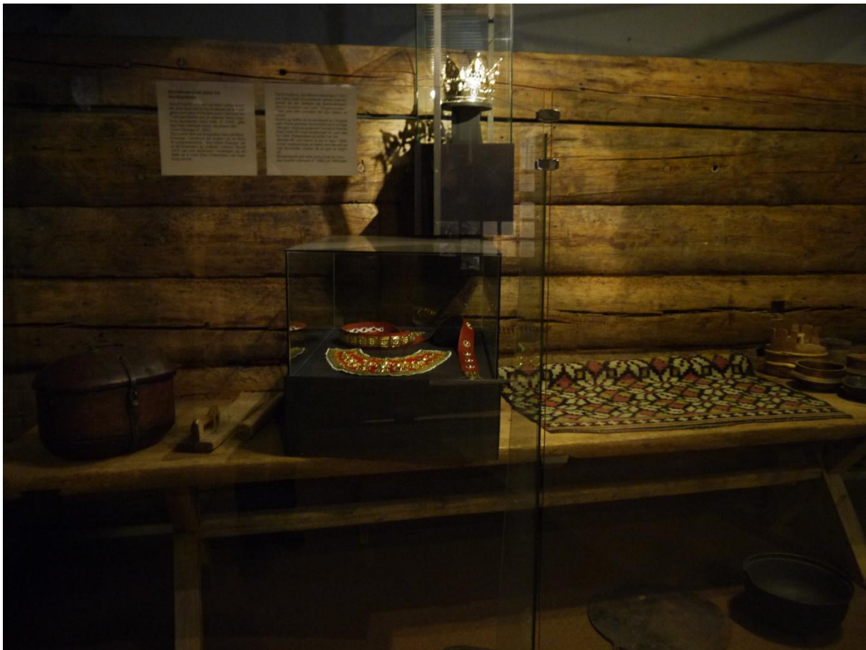
Figur 15: Noen gjenstander fra utstillingen om "Det løynde sølvet".

Neste del av fiskerbondeutstillingen tar for seg tema som husdyr og matstell, hjem og familie. Dette var oppgaver som stort sett tilhørte kvinnene. Som i store deler av utstillingen for øvrig er det mange foto og bilder samt rikelig med tekst og en rekke med gjenstander. Et typisk trekk ved folkemuseene er formidlingen av folkekunst. Ved Hordamuseet fokuseres det særlig på sølvarbeid. Dette temaet har også fått mye plass. Strilefolket ble sett på som et nøysomt folk. Embetsmenn tolket deres fattigslige klesstil, deres elendige matstell og små hus som tegn på trange kår. Arveoppgjør fra midten av 1700-tallet viser imidlertid at strilene ofte satt på store mengder sølv, og mer enn mange andre regioner i landet.