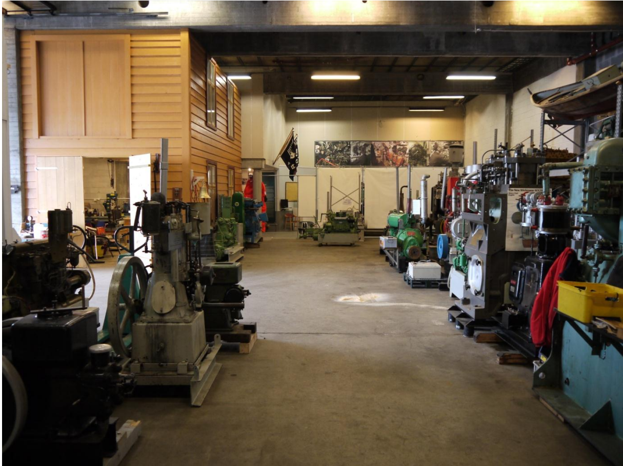
Figur 9: Fra den store motorhallen ved det maritime museet. Her er det mange ulike motorer, de fleste produsert og brukt i distriktet. Veterangjengen ved museet står for klargjøring og vedlikehold.