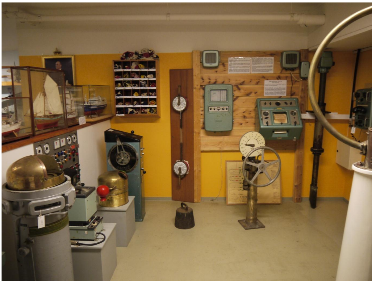
Figur 6: Sunnhordland Museum har gitt plass til mange av de teknologiske nyvinningene fra mellomkrigstiden og tiden etter 2.verdenskrig. Båtmodeller er plassert til venstre.

På 1970-tallet fikk shippingkrisen store konsekvenser for Stord, særlig fikk hjørnesteinsbedriften Aker Stord problemer når oppdrag ble kansellert. Men i det mye av skipsbyggingen fikk problemer og forsvant, ble oljealderen redningen for flere av de største bedriftene. Overgangen fra skipsfart til offshore-virksomhet var vanskelig og konkurransen hard, men i de neste tiårene skulle bedrifter som Aker Stord, Aker Elektro og Leirvik Sveis forsyne oljenæringen med en rekke plattformmoduler og supplyskip. Tusenvis av gjestearbeidere har dessuten gitt regionen et internasjonalt preg på arbeidsplasser og uteliv.