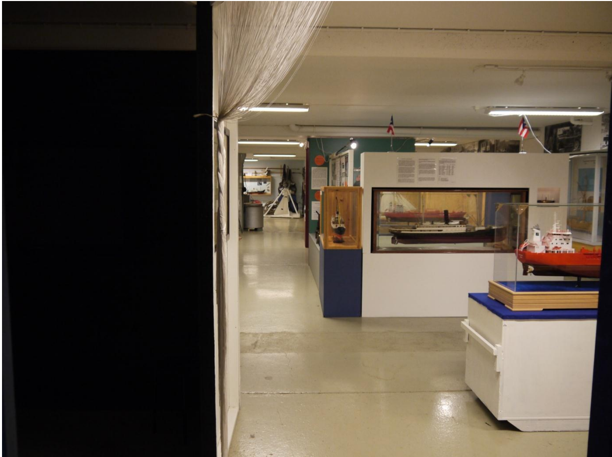
Figur 4: Et oversiktsbilde fra "Leirvik Havn utstillingen" sett fra inngangen til utstillingen.

Utstillingen starter med en stort foto av en HSD-båt. Aktiviteter i havneområdet og en rutetabell fra 1939 får frem at Leirvik lenge har vært en viktig havn i regionen, og sentral i kommunikasjonen med resten av Sunnhordland. Deretter kommer to båtmodeller, som virker å være litt tilfeldig plassert. Senere følger flere slike modeller uten noe større indre sammenheng.