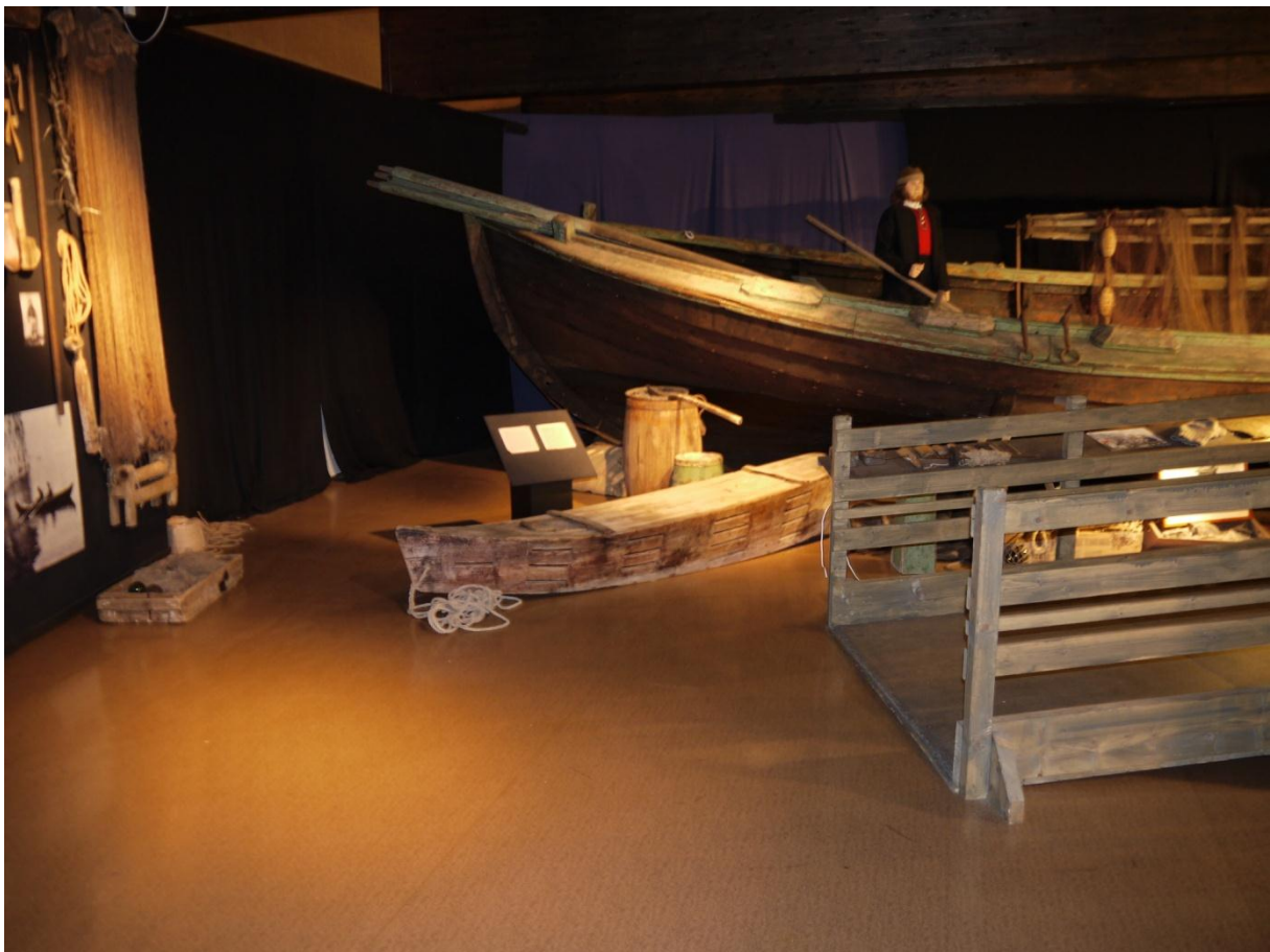
Figur 14: Hjalmarbåten med tilhørende sentrale fiskeredskaper på gulvet foran og i båten.

Etter de ulike håndverkene retter utstillingen seg mot fisket. Denne delen har fått rikelig med plass. Hjalmarbåten kommer først. Dette er en seksæring som ble brukt i notfisket etter sild, hjemmehørende i Austevoll. Den ble bygd i et båtverksted i Os som en spisstevnet båt, før den ble gjort om til en gavlbåt i 1915. Flere foto viser båten i bruk i ulike fiskeri. Viktige redskaper som ble brukt i fisket er også en del av utstillingen: garn, teiner, øser, vannkikkert og fiskekister. De siste var svært etterspurte, og håndverkere som hadde rykte på seg for å lage gode fiskekister, fikk gjerne oppdrag utover hjembygden.