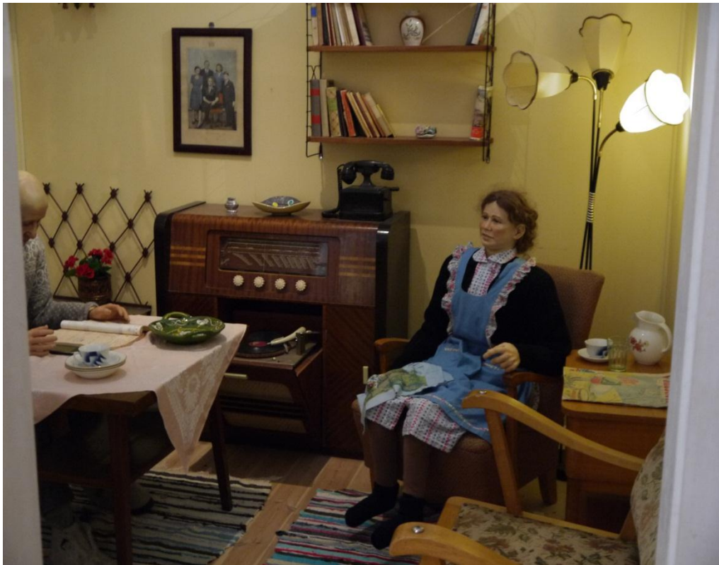
Figur 25: De rike sildeårene på 1950-tallet gav ekstra inntekter. En mer romslig økonomi og elektrisitet gav nye innredningsmuligheter i hjemmet.

Industrialisering og det rike sildefiskeriet etter krigen gav altså økende velstand til Øygarden. Avslutningsvis blir det vist et kjøkken som skal være representativ for denne perioden, sammen med den nevnte stuen.