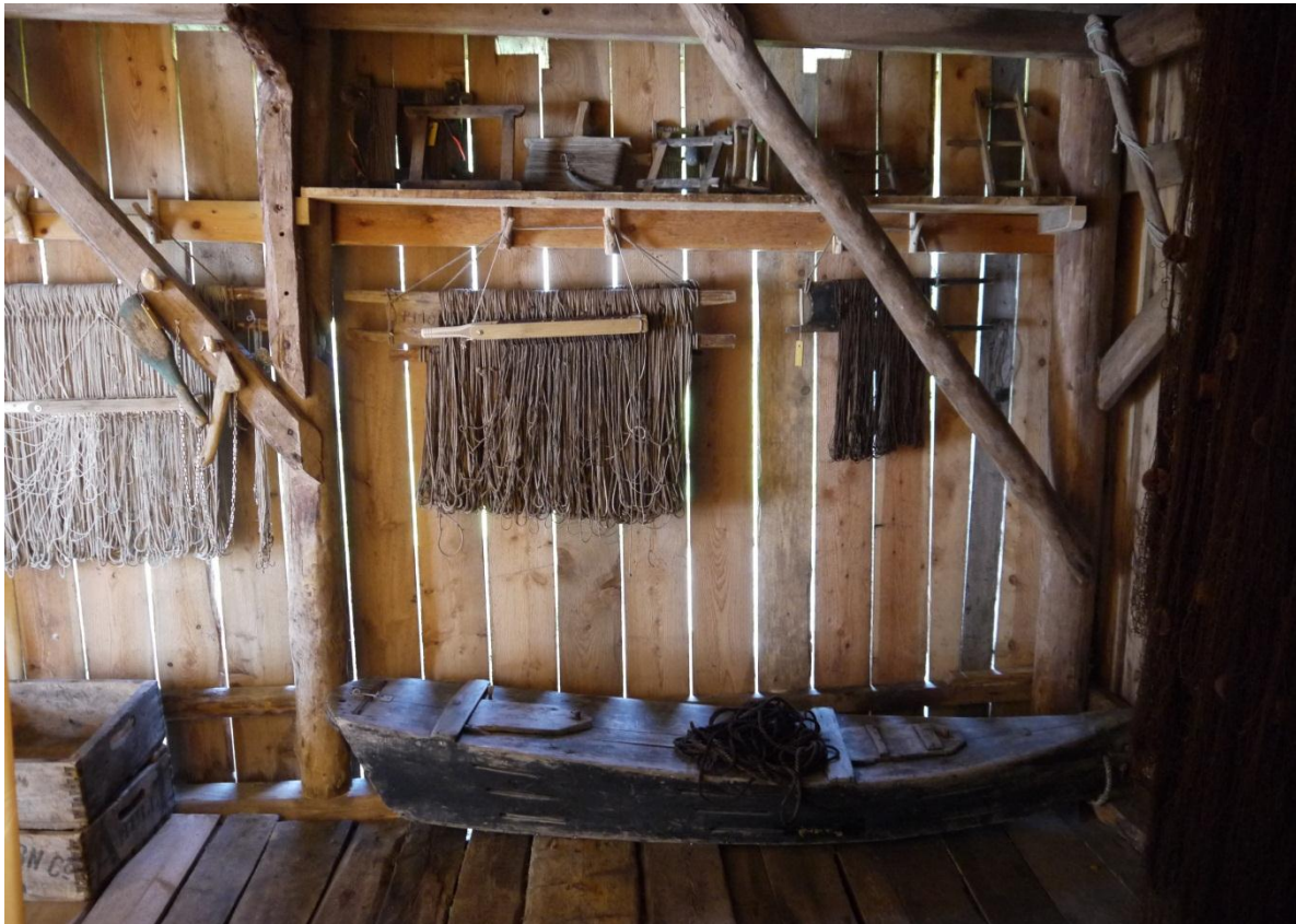
Figur 29: Viser noen av gjenstandene i naustutstillingen, blant annet garn, fiskeredskaper og en fiskekiste. Det er ingen forklarende tekst ved siden av disse.

Opprinnelig ønsket museumspedagogen å gjøre utstillingen enda mer autentisk. 112 Han viser til en utstilling på Gamle Bergen, hvor en kommer inn i en skomakerverksted på en vanlig dag. I dette verkstedet finner man også objekter eller ting som har lite med selve skomakeryrket å gjøre, for eksempel personlige eiendeler som tilhører skomakeren. I utstillinger hvor blant annet barn er en viktig brukergruppe, vil en selvfølgelig måtte ta hensyn til hvilke objekter en stiller ut. Uansett er hensikten å vise frem en mer ekte situasjon og hverdag.