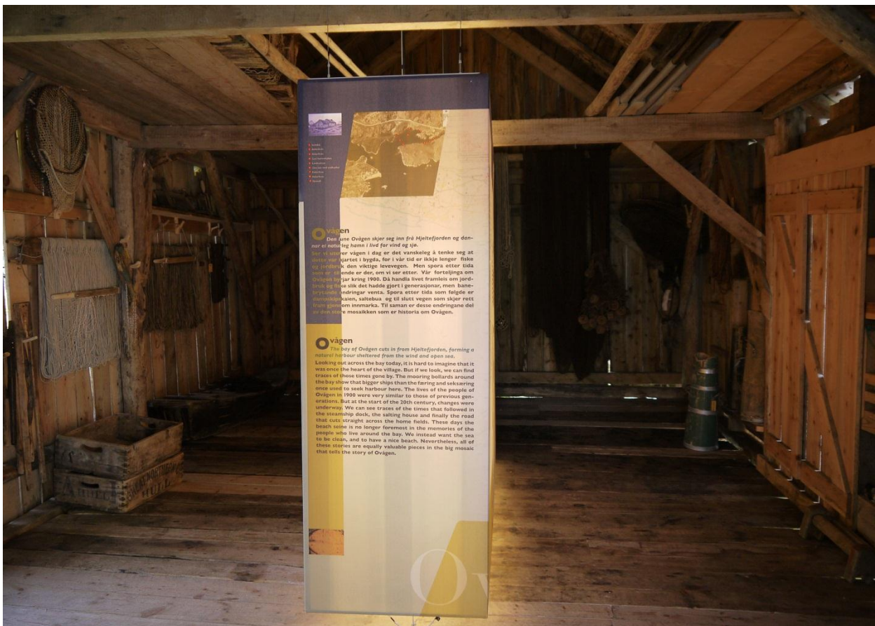
Figur 28: Naustutstillingen, som kombinerer de ulike utstillingsformene.

Det er gjenstandene som er det sentrale i denne utstillingen, og tanken er at de i stor grad skal forklare seg selv. Det som finnes av tekst, er plassert i en lysskjerm midt i rommet. Det gjør at det kommer klart frem at tekst og grafikk er tilført, og ikke noe en venter å finne i et naust. Dermed oppnår man en nødvendig kontrast mellom dette utstillingselementet og selve gjenstandene og naustet, ifølge museumspedagogen. 111