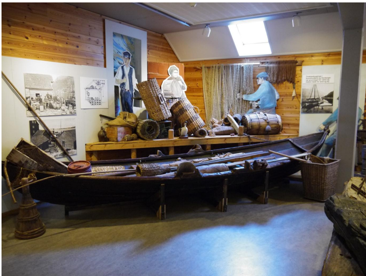
Figur 2 Fra sjøbruksavdelingen i Sunnhordlandstunet. En oselvar med tilhørende fiskeredskaper.

Det var mange næringer knyttet til fisket, og flere av dem er representert i denne sjøbruksavdelingen. Blant disse finner vi skipsbygging og vedlikehold av båter. En tegning og et bilde viser en kjølhalt ”hønerævsjøte” i Mosterhamn som gjøres klar til vedlikehold. En tekstkilde forteller at skipsbygging var grunnlaget for rikdom og vekst i distriktet.