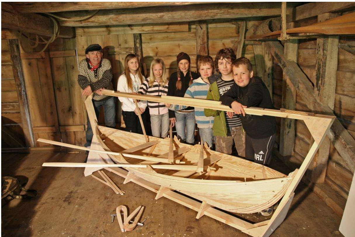
Figur 10: Fra Møllebuo, Leirvik. Her ser vi modellen av færingen som blir brukt i undervisningsopplegget.

Opplegget starter med en intro om lokalhistorie i nærområdet og hvor viktig båtbyggerne var for distriktet, samt om årsaken til at de etablerte seg på de enkelte stedene. Viktig var selvfølgelig gode havneforhold, men også nærheten til en elv og god tilgang på trematerialer. Siden dette er et omreisende undervisningsopplegg, vil det denne delen av opplegget variere fra sted til sted. De fleste bygdene i Sunnhordland har tradisjoner innenfor denne næringen, derfor er viktig for de ansatte å lese seg opp på forhånd om de ulike stedene for å kunne bruke eksempler og navn som elevene kjenner fra før.