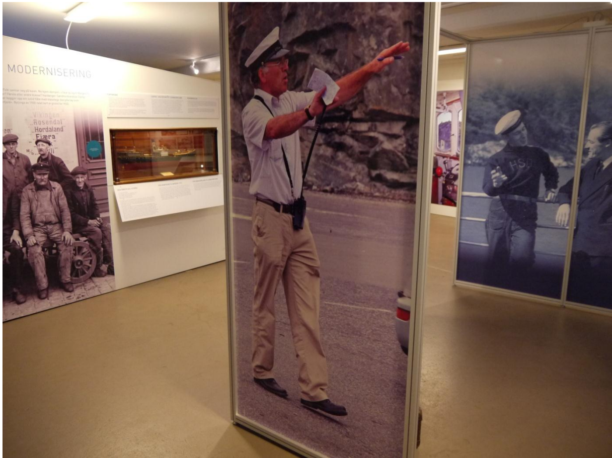
Figur 8: Fra HSD-utstillingen. Ferjedrivingen foran. Veggen bak forteller litt om ekspansjonen og moderniseringen før 1945.