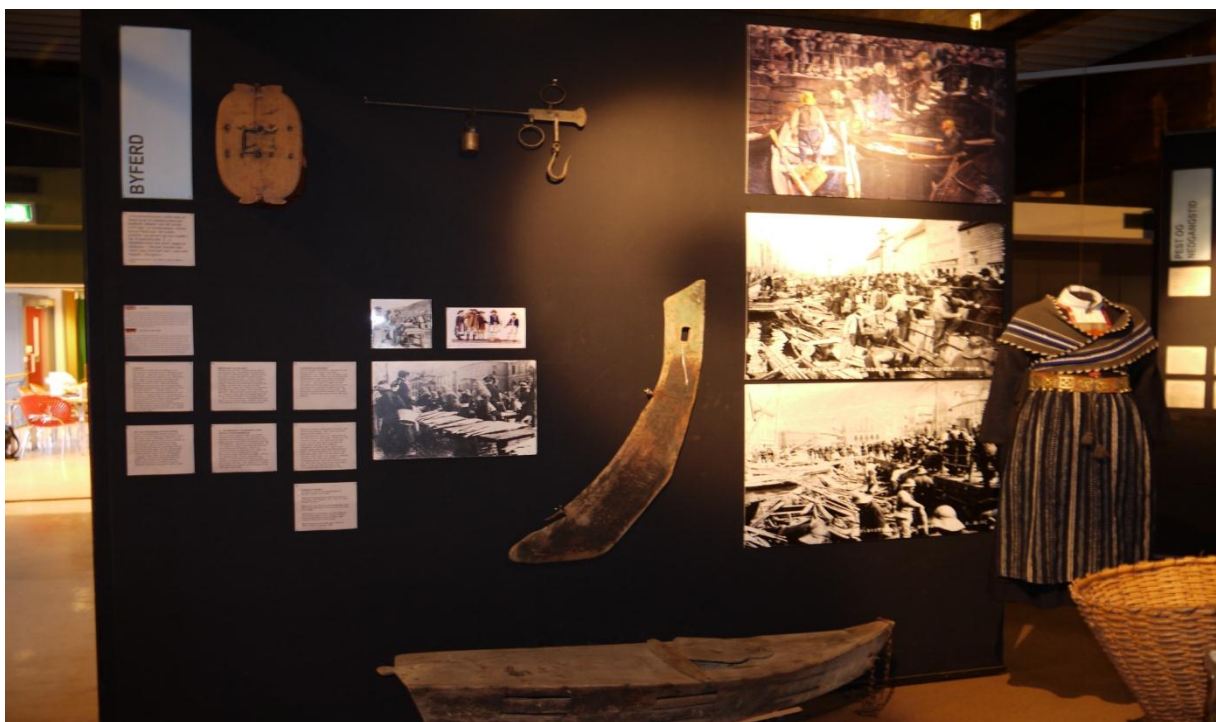
Figur 17: Fra utstillingen om byferden til Bergen med viktige redskaper og klær som ble med på disse turene. Blant annet kipa og fiskekista. Som i resten av utstillingen inneholder veggen er blanding av tekst, foto og redskaper.

Det var viktig for strilene å ta seg godt ut når de var i byen, og de kom ofte i sine flotteste klær. Hvor ofte de dro til Bergen, var avhengig av hvor nær byen de bodde. Som oftest var framkomstmiddelet båten, helst en god og lettrodd seksæring. Byferden foregikk året rundt, uavhengig av vær og vind. Utstillingen har mange illustrerende foto fra Torget i Bergen, samt klesdrakter og viktige redskaper som ble brukt i denne handelen, for eksempel kipa, melkespann, fiskekiste og korg.