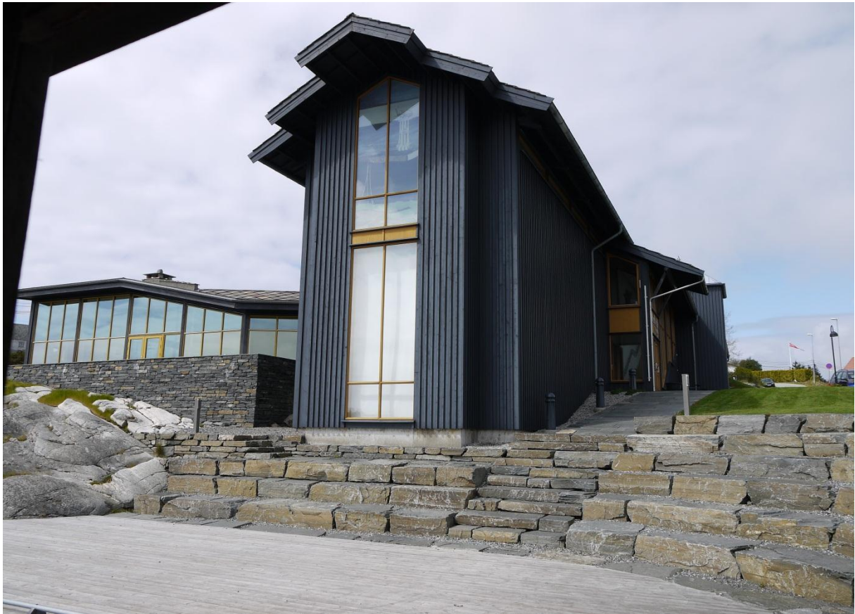
Figur 23: Fasaden til Kystmuseet. Hovedutstillingen er satt opp i 2. etg. Kafeteria og møterom i sidebygget til venstre.

I 2010 hadde Kystmuseet i Øygarden et besøksantall på 8250. 106 Av disse utgjorde utenlandske turister ca. 30 %, norske bussturister ca. 15 % og andre turister ca. 10 %. Resten av de besøkende, det vil si nesten halvparten (45%) var skoleelever og gjester ved arrangementer ved museet. Museet har ikke noen bestemt målgruppe de retter utstillingene eller formidlingen mot. De har likevel et ønske om å få flere skolebesøk fra nærområdet, dvs. Sotra og Øygarden. Ut i fra et ”kommersielt ståsted” er også utenlandske turister attraktive. De utenlandske turistene legger nemlig igjen en god del penger. Et opplegg beregnet på