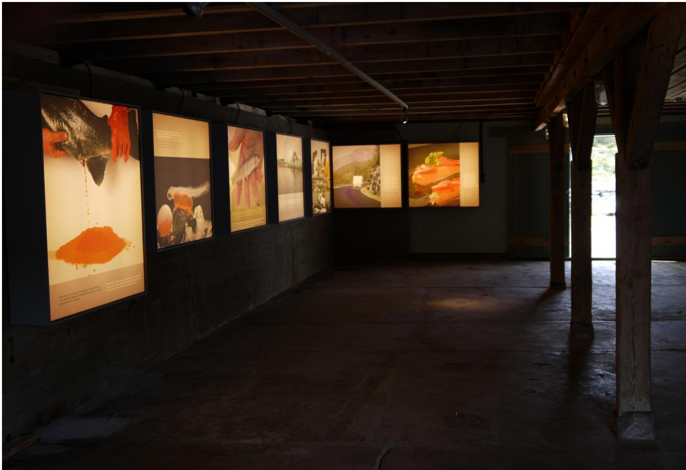
Figur 30: Havbruksutstillingen, som sammen med Øygarden visningscenter viser en annen viktig del av Øygardens nyere historie.