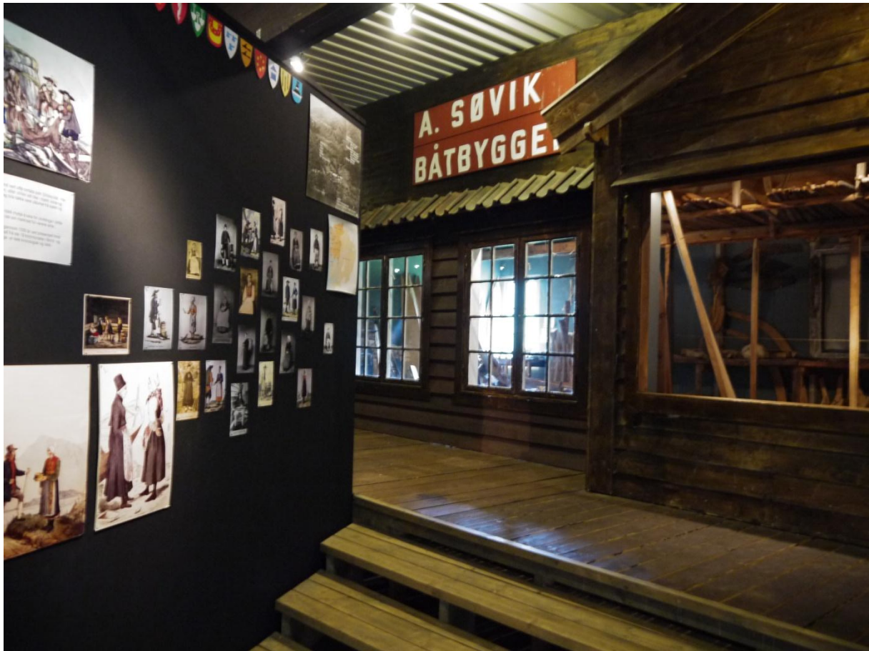
Figur 13: Fra fiskerbondeutstillingen. Veggen til venstre inneholder en slags intro til utstillingen.

Utstillingen er også opptatt av strilene som dyktige håndverkere. Etter en kort introduksjonen blir det vist hvordan et båtverksted fungerte. Gjenstander og utstyr ble i sin tid gitt av familien til en som hadde drevet et verksted i Lysefjorden. Samlingen inneholder blant annet utstyr til tetting, klinking, naglesnitt, måling, samt en kassebok med regnskap og bestillinger.