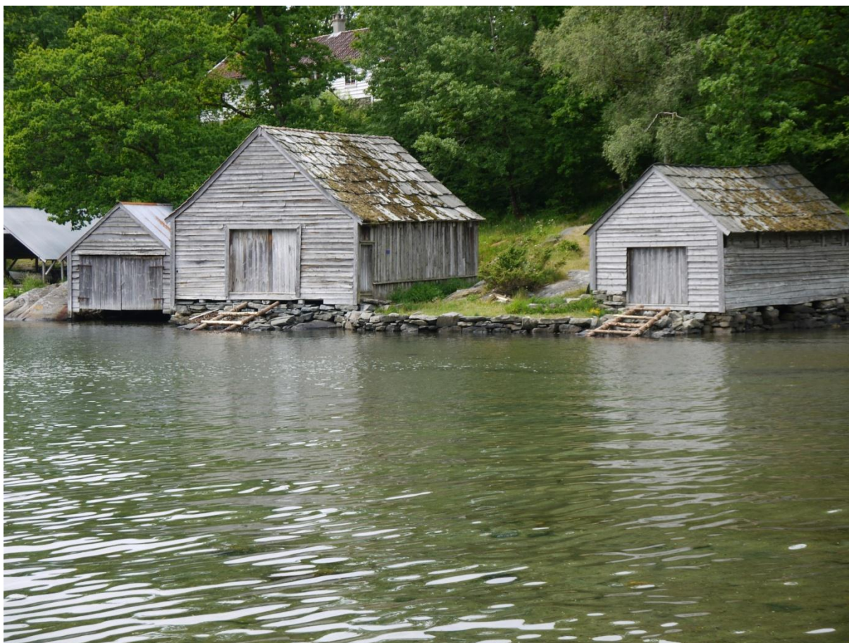
Figur 21: Naustrekka til museet. I midten er det store Hatviknaustet, med Fotlandsvågnaustet til høyre og et nybygg til venstre.