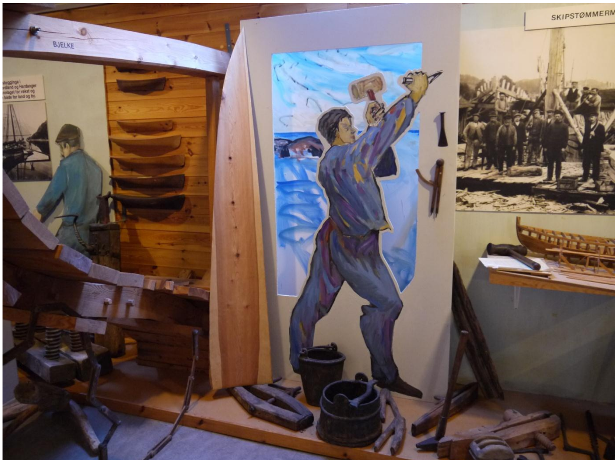
Figur 3: Sjøbruksavdelingen med fremstillinger av ulike næringer som kom med sildefisaket på 1800-tallet. Her ser vi litt fra treskipsbygging og skipstømring.