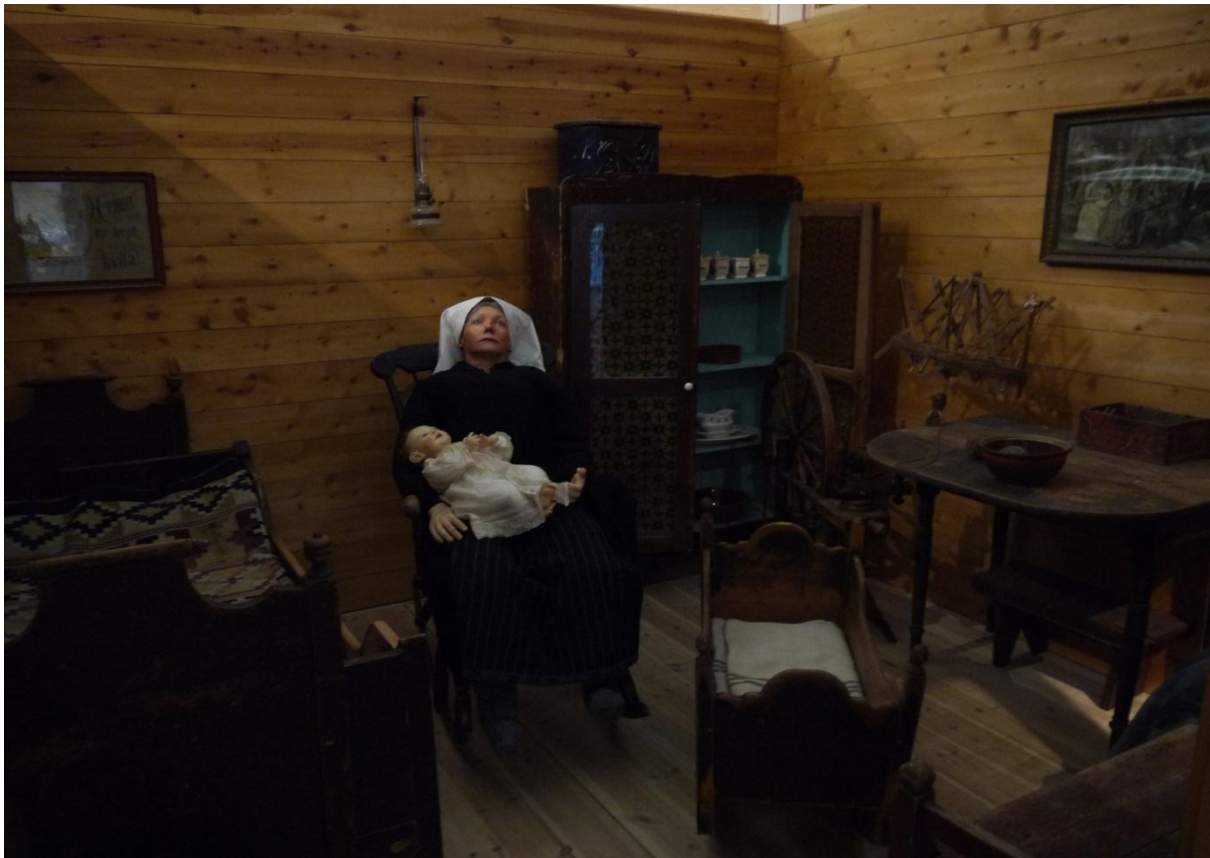
Figur 24: Viser en vanlig stue i et fiskerbondemiljø, hvor hverdagen var preget av hardt arbeid og lite materielt overskudd.

slit og en travel hverdag med lite materielt overskudd. Den neste stuen viser bedre materielle forhold under de rike sildeårene på 1950-tallet, med dertil høyere materiell standard.