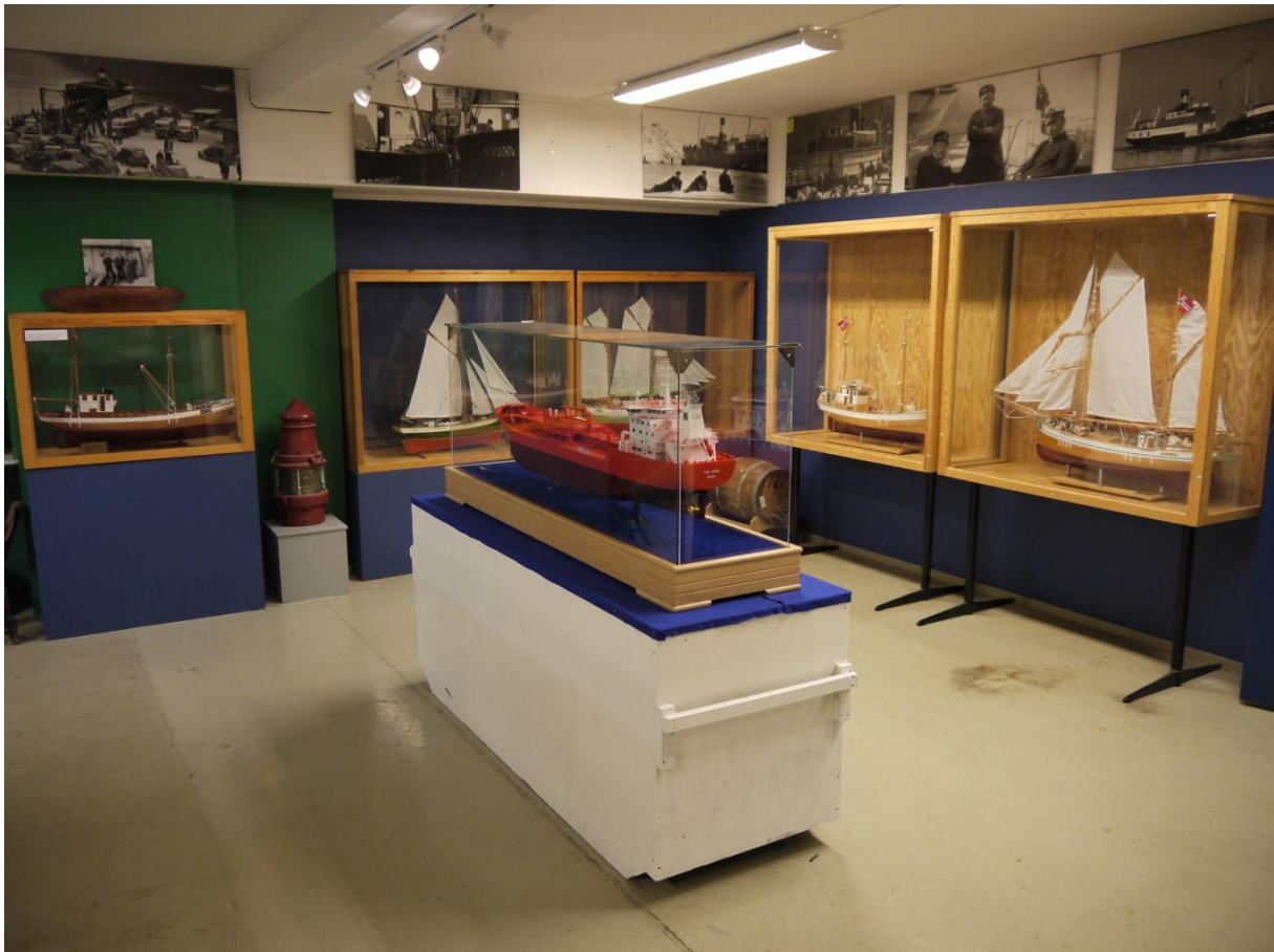
Figur 7: Noen av de mange båtmodellene i utstillingen. På veggen oppe er det stemningsbilder fra kai- og båt miljø.

Det er også gitt litt plass til to delutstillinger som tar for seg verdenskrigene og hvordan disse påvirket lokalsamfunnet. Utstillingen avsluttes med nye båt-/skipsmodeller, som i likhet med resten av modellene har tilknytting til regionen. Enkelte av dem er bygd av lokale verft, andre båter har vært i lokale rederes eie, mens andre modeller er gitt i gave av enkeltpersoner i lokalbefolkningen. Øverst på veggen er det en del eldre bilder av båter, kommunikasjons- og havneliv.