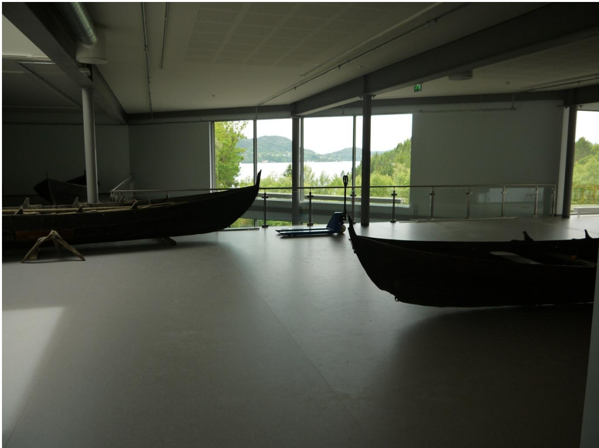
Figur 19: Noen av båtene som er med i utstillingen. Selve bygget er tilpasset slik at båtene ikke tar skade av plasseringen med tanke på fuktighet og temperatur. Bygget gir også en luftig følelse for de besøkende med store vinduer og Fanafjorden i bakgrunnen.

Utstillingen vil også være en fortsettelse i museets langvarige fokus på læring gjennom praktiske aktiviteter, der elevene vil få ta del i gjøremål som gjør dem kjent med livet i eldre tider. Museet har store forventninger til muligheten for å øke elevenes og andre besøkendes kunnskap om Hordalands rike båtkultur.