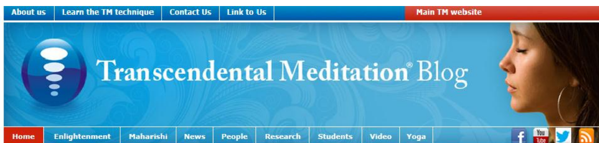
Bilde 2. Oversikt over bloggens kategorier. 94

Som bildet viser er det på TMs blogg flere ulike kategorier den besøkende kan velge mellom. At det er viet egne kategorier til «Enlightenment», «Maharishi» og «Yoga» viser at de klassiske religiøse aspektene ved bevegelsen anerkjennes fortsatt, selv om tyngdepunktet ligger på moderne vitenskap.