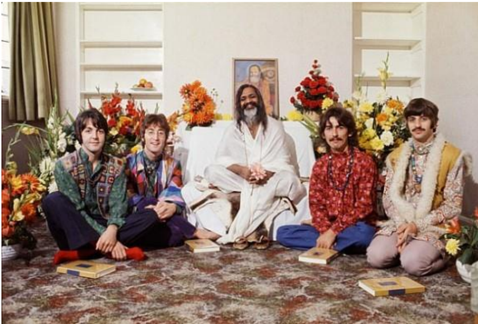
Bilde 1: Maharishi Mahesh Yogi og The Beatles, September 1967. 83

møttes for første gang da Maharishi var på turne i England i 1967. Senere dro The Beatles til Rishikesh i India for å studere sammen med ham. 82