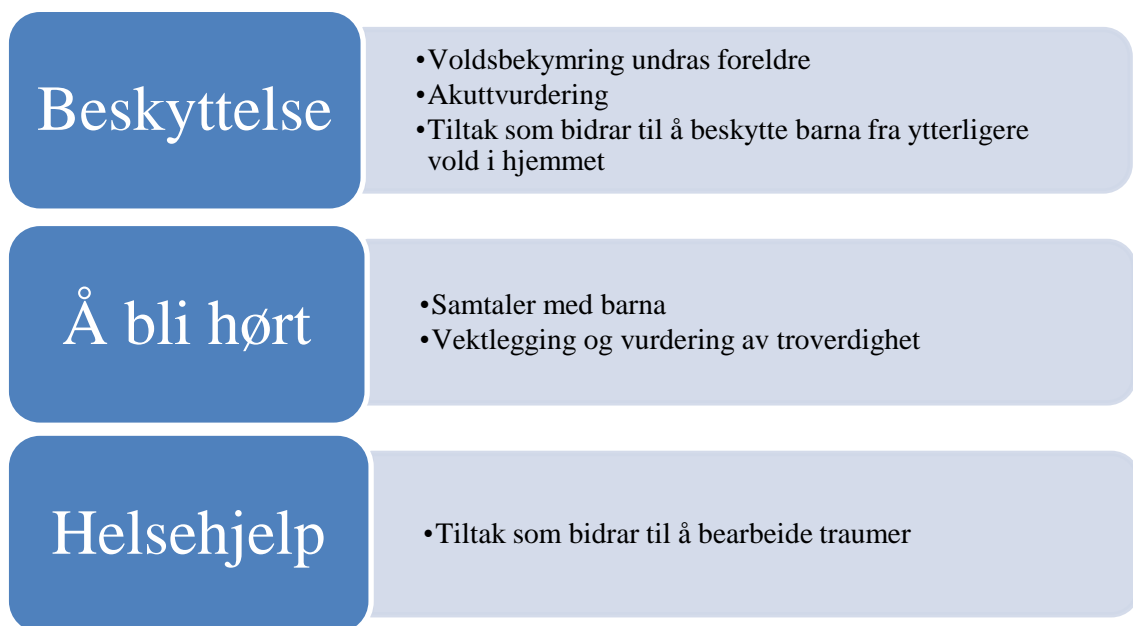
Figur 5.1 «Modell for hvordan barnevernsarbeiderne ivaretar barnas rett til beskyttelse, å bli hørt og helsehjelp»

Med denne studien ønsker jeg å få svar på hvordan barns rett til beskyttelse og å bli hørt, samt hvordan deres rett til helsehjelp knyttet til traume blir ivaretatt av barnevernet, når de utsettes for direkte vold hjemme. Med utgangspunkt i disse tre rettighetene fant jeg noen sentrale undertema, som var felles hos barnevernsarbeiderne. Disse undertemaene knyttet til hvordan barnevernsarbeidernes arbeid kan illustreres som det fremkommer på figur 5.1.