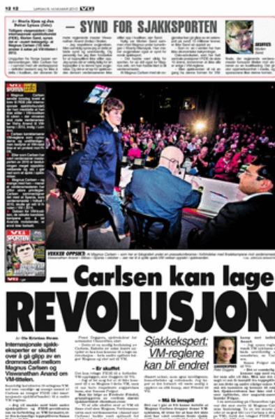
FAKSIMILE 16: VG Sport, 6. november (Strøm 2010e).

Dagen etter tok VG temperaturen på hvilke reaksjoner «sjakkverdenen» hadde etter å