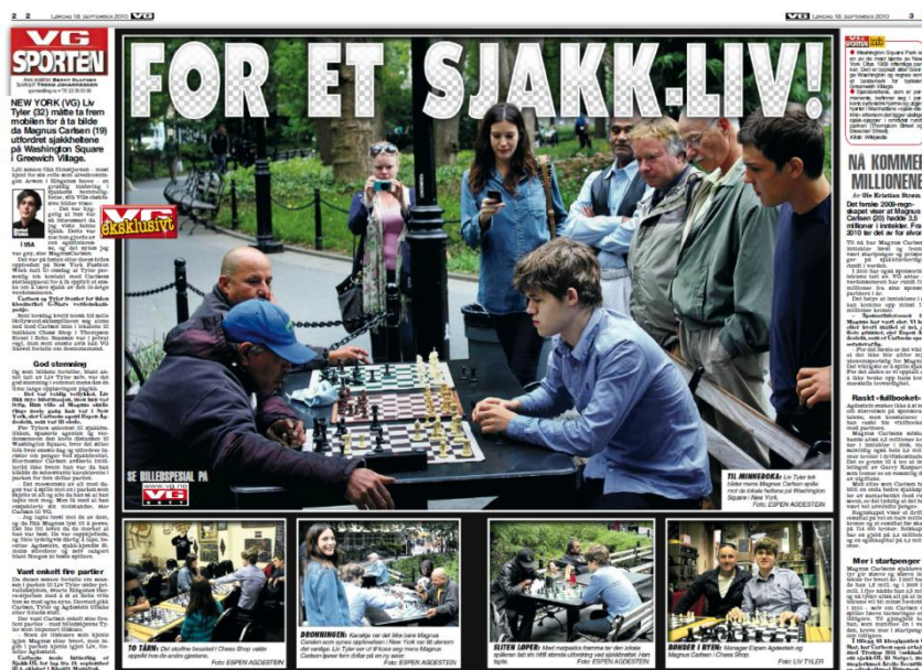
FAKSIMILE 9: VG Sport, 18. september (Brenne 2010).

I denne artikkelen finner man fem bilder, et stort og fire små, som alle er rammet inn med samme ramme som VG definerer som en «eksklusiv bildespesial». Overskriften som er felt inn i hovedbildet «FOR ET SJAKK-LIV!» konnoterer betydningen av et spennende og sammensatt sjakkliv - flerfoldig. Bildene er ordnet i en bestemt rekkefølge. Det ville være naturlig å sammenligne