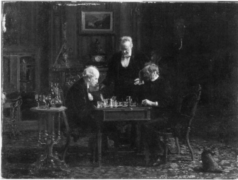
Fig. 1. Thomas Eakins, The Chess Players , New York, 1876. Oil on wood; H. 11 \frac{3}{4} ", W. 16 \frac{3}{4} ". (The Metropolitan Museum of Art, gift of the artist, 1881.)