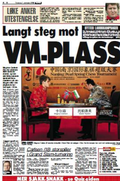
FAKSIMILE 1: (Strøm 2009d)

Valget av perspektiv har betydning for representasjonen av sjakkspilleren og konstruksjonen av en bestemt virkelighetsforståelse som styrker forståelsen av sjakk som en fysisk sportsgren. Dette lar seg best anskueliggjøre om man foretar en permutasjonstest. Om man forestiller seg at bildet hadde vært tatt i fugleperspektiv ville leseren blitt tilbudt å evaluere brikkenes posisjon og ikke sjakkspillernes kropper og kroppsspråk. I de daglige