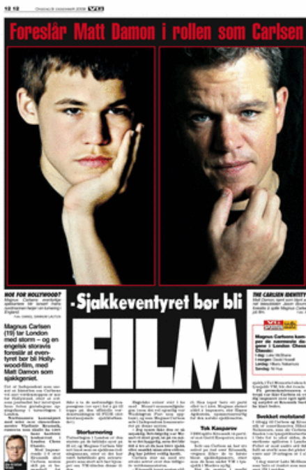
FAKSIMILE 14: VG Sport, 9. desember (Strøm 2009).

I ingressen blir får man opplyst at Carlsen tar London med storm og at dette