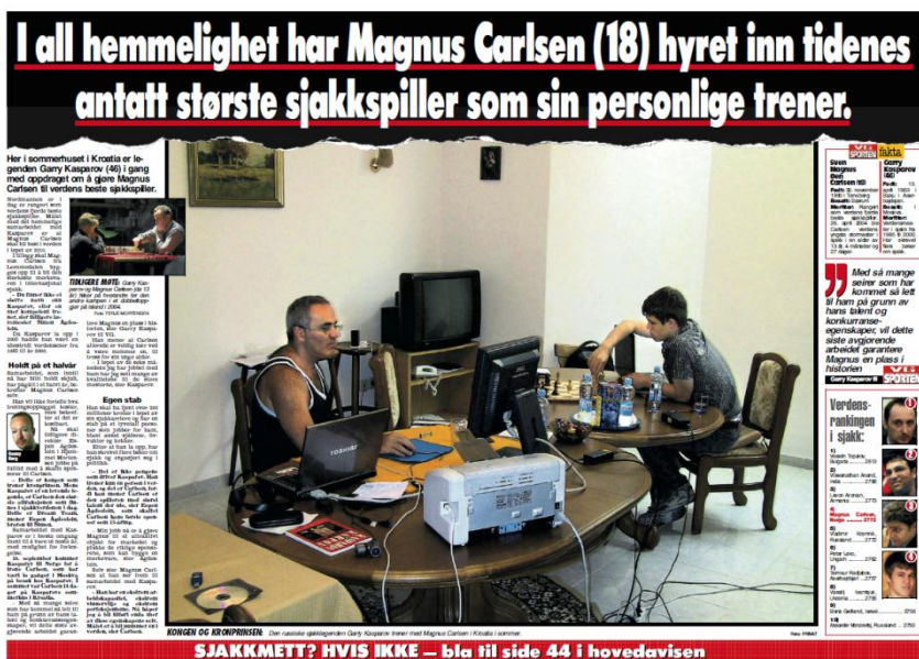
FAKSIMILE 4: VG Sport, 7. september (Berg 2009a)

I bildeteksten står det: «KONGEN OG KRONPRINSEN: Den russiske sjakklegenden Garry Kasparov trener med Magnus Carlsen i Kroatia i sommer». Ved bruk av ordet «trener» forankres en allmenn betydning av at handlingen som utspiller seg i bildet representerer en bestemt treningssesjon. Slik vil leseren kunne identifisere ulike elementer i bildet som representative bevis for hva som konstituerer en vanlig sjakktraining: vannflasker, datamaskiner, sjakkbrett og muligheten til å skrive ut datamateriale. I en slik treningssituasjon blir det gjort bruk av teknologiske og analoge hjelpemidler. Særlig bruken av datamaskiner konnoterer betydningen av en analytisk profesjonalisme ettersom som datamaskiner ofte blir gitt en mytisk betydning i dagens samfunn som bevis for modernitet, progresjon, intellekt og slik at sjakk forankres som en utpreget moderne sportsgren. Dette samsvarer noenlunde med VGs bruk av ordet trening og betydningen av sjakksporten som moderne i den grad man «trener» sjakk og ikke lenger spiller sjakk.