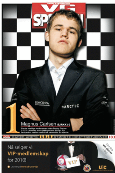
FAKSIMILE 13: VG Sport, 24. desember (VG 2009)

Da Carlsen ble kåret til «Årets norske idrettsutøver» av VG (2009) den 24. desember avløste bildeteksten betydningen av Carlsen som en arvtager: «Magnus Carlsen SJAKK (-) Første vestlige verdensener siden Bobby Fischer i 1975. Lanseres som sjakksporsens Mozart. En beskjeden, nesten eksentrisk væremåte. En stjerne». Tar man likhetene mellom forsiden først knytter de seg til ettallet og klesstilen, noe som i dette tilfellet uttrykker sjakkspillerens