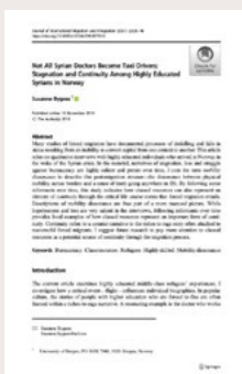
Bygnes, S (2021) Not all Syrian doctors become taxi drivers: Stagnation and continuity among highly educated Syrians in Norway.

I avhandlingen som har fulgt syrere som var politisk engasjert i opprøret mot styremaktene i Syria etter at de kom til Europa fant Amany Selim at i Oslo var aktivistene ved første øyekast mindre politisk engasjert i å påvirke utviklingene i Syria enn aktivistene i Berlin. Ved nærmere ettersyn ble det klart at mange fortsatt var politisk engasjert. Siden aktivismiljøet i Oslo er mer begrenset enn i Berlin og det bor relativt få syrere i Oslo ble engasjementet i stedet rettet inn mot inkluderingsarbeid av syriske nykommere i det norske samfunnet, eller aktivismen ble omdirigert til å handle om andre deler av deres identitet, som skeiv aktivisme eller kurdisk aktivisme.