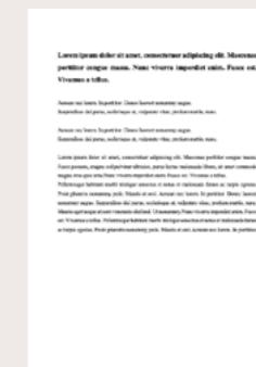
Bygnes, S og Strømsø, M (publisert i 2022) A promise of inclusion: on the social imaginary of organized encounters between locals and refugees. Publisert i Journal of Intercultural Studies .