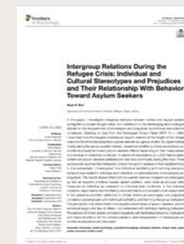
Bye, H. H. (2020) Intergroup Relations During the Refugee Crisis: Individual and Cultural Stereotypes and Prejudices and Their Relationship With Behavior Toward Asylum Seekers. Publisert i Frontiers in Psychology .