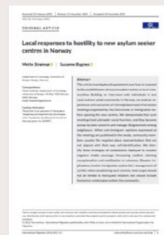
Strømsø, M og Bygnes, S (2021) Local responses to hostility to new asylum seeker centres in Norway. Publisert i International Migration .