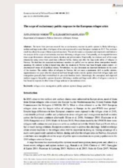
Ivarsflaten, E. og Nordø, Å. D. (2021) The scope of exclusionary public response to the European refugee crisis. Publisert i European Journal of Political Research .