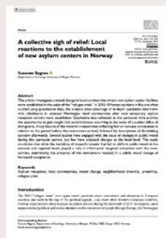
Bygnes, S (2020) A collective sigh of relief: Local reactions to the establishment of new asylum centers in Norway. Publisert i Acta Sociologica .

Vår studie viste også at måten asylmottak ble driftet på hadde en påvirkning på muligheten for å bygge relasjoner mellom beboere på asylmottak og lokalmiljøet rundt. Større og mer rigid drevne asylmottak begrenset muligheten for hverdagslige møter på like fot og gjorde at beboerne opplevde mindre selvbestemmelse og kontroll over sitt eget liv. Muligheten for samhandling kunne bli begrenset av noe så enkelt som at en ringeklokke var montert for høyt oppe til at barna i nabolaget rakk opp og derfor ikke kunne invitere barna på mottaket til fotball. Både fysiske og institusjonelle rammebetingelser og måten lokalmiljøet fikk mulighet til å involvere seg på bidro altså til variasjon i opplevelsen til både asylsøkerne og nabolagene.