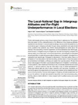
Bye, H. H., Bygnes, S. og Ivarsflaten, E. (2021) The Local-National Gap in Intergroup Attitudes and Far-Right Underperformance in Local Elections. Publisert i Frontiers in Political Science .