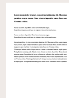
van Liempt, I og Bygnes, S (under fagfelle-vurdering) Mobility dynamics within the settlement phase of Syrian asylum-seekers in Norway and the Netherlands.

Publisert i Journal of Immigrant & Refugee Studies .