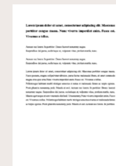
Bygnes, S (under fagfelle-vurdering) Experiencing and resisting interwoven social boundaries: the case of highly educated recent refugees in Norway.