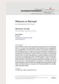
Bygnes, S (2017) Welcome to Norway. Da flyktningkrisa kom til Norge. Publisert i Tidsskrift for Velferdsforskning .