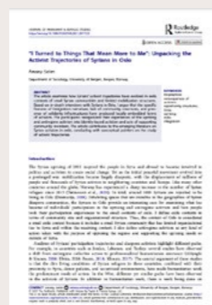
Selim, A (2021) "I Turned to Things That Mean More to Me": Unpacking the Activism Trajectories of Syrians in Oslo.

Publisert i International Journal of Immigration and Integration .