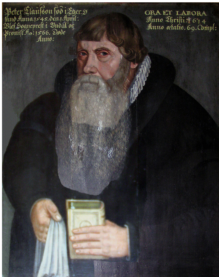
Illustrasjon 3. Peter Reimers maleri av Peder Clausson Friis (1545–1614) fra Valle kirke. Clausson Friis gav i 1613 ut det historisk-topografiske verket, Norriges Beskrivelse .

for de Fine, er på den eine sida ei oppfatning av at skriftleg historieskriving – og då særleg den eldste og i dette tilfellet representert av Snorre – er autoritativ og sann. Topografiske monument blir i langt dei fleste høva nytta for å stadfeste det skriftleg historieskriving har formidla. Historikarar som Torfæus og Schøning opererte i tillegg med eit i større eller mindre grad klart definert hierarki over tidlegare historieskriving. Alder er her eit sentralt kriterium, men for Torfæus spela òg tidlegare resepsjon ei viktig rolle. De Fine vurderer ikkje tidlegare historikarar eksplisitt, men dei mange referansane til Snorre gjer at me trygt kan plassere han øvst i hierarkiet – som tilfellet òg er med Torfæus. Med eit slikt utgangspunkt er det enkelt å avvise eit langt yngre historieverk, som Norrigia illustrata av Jens Lauritsen Wolf frå 1651. Snorre med sin autoritet blir stadfesta av de Fines eigne observasjonar – med den konsekvensen at Wolfs tankar om alderen til Stavanger er fullstendig avviste.