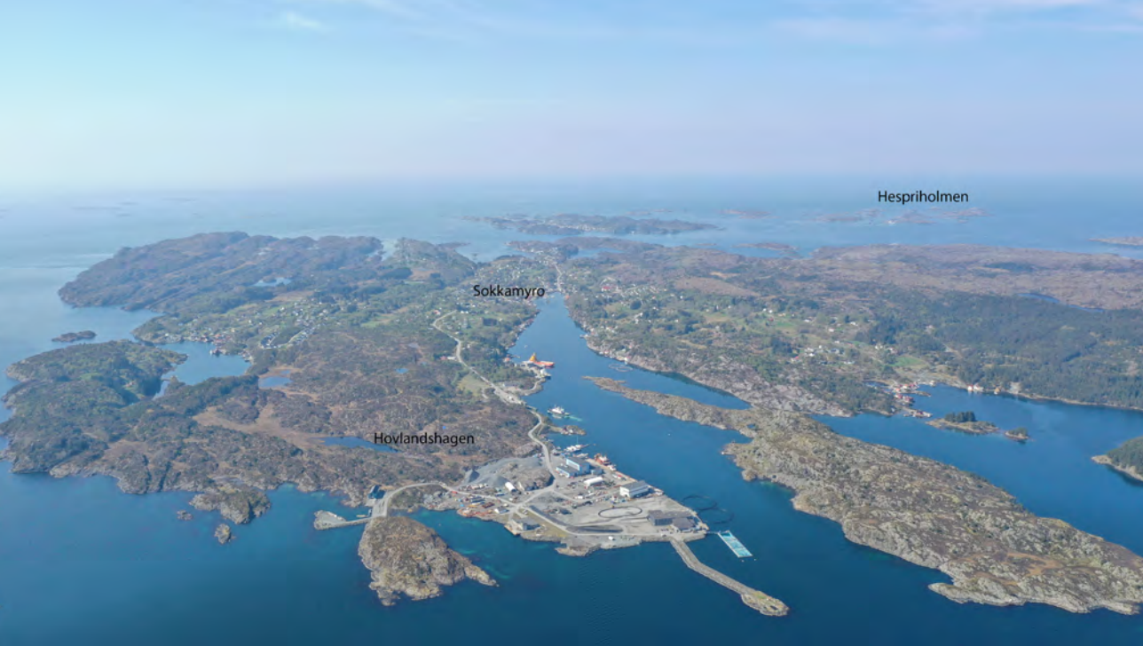
Fig. 1 | Oversiktsfoto over Sør-Bømlo og Langevåg med funnstadane i Hovlandshagen og Sokkamyrø markert. Grønsteinen er henta ut av berget på Hespriholmen lengst vest mot storhavet.

kor høgt strandlinjene hadde gått på Bømlo i eldre steinalder 6 . Medan han arbeidde på Uratangen I fann han ein ny buplass om lag 50 meter mot nord, og litt lågare i terrenget. Denne fekk namnet Bergensleitet, og vart også undersøkt av Shetelig. Både Uratangen I og Bergensleitet hadde mengder med avslag, samt økser og emne av grønstein. I tillegg var her mellom anna skiveøkser av flint.