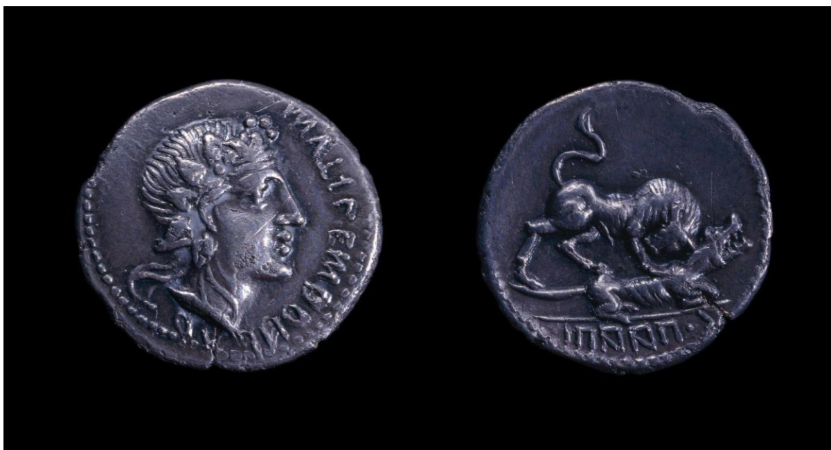
Figur 2: En denar i sølv fra den Italiensk siden av krigen. På venstre viser den Bacchus, romersk gud. Skriften tyder på en hylles på oskisk til hva som mest sannsynlig var Gaius Papius Mutilus, en av de to første konsulene på den italienske siden. På høyre viser den den romerske ulven som blir spiddet av den italienske oxen.