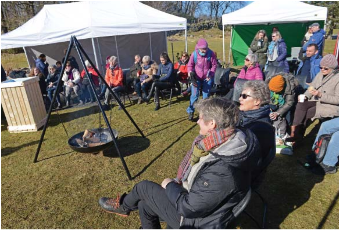
Kompostdagen i Botanisk hage med bålpanne og vårsol (16. mars 2018).