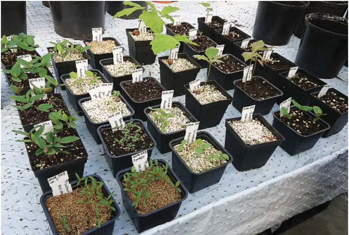
Det spirer over all forventning: villinnsamlet frø av busker og trær fra østlige USA mottatt fra Arboretum Mustila og utvekslet gjennom Nordisk arboretutvalg.