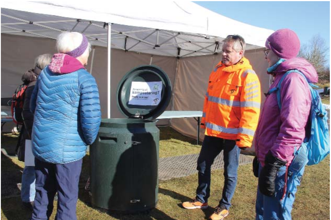
Kompostdagen i Botanisk hage (foto: Terhi Pousi, 16. mars 2018).

Vi organiserte en rekke publikumsarrangementer som var åpne for alle. Egen programbrosjyre ble trykket opp. Det gjelder: