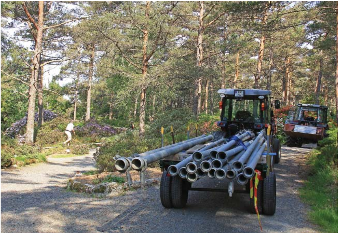
Sommeren ble en av de tørreste i manns minne, og det måtte legges ut kraftig "skyts" for å redde samlingene. Her fra Artssamlingen av Rhododendron (foto: Terhi Pousi, 30. mai 2018).

rhododendron. Anlegget ble koblet opp to ganger, første gang 30. mai og andre gang 17. juli. For å komme til med traktorpumpen fikk vi god nytte av den nylagde vegen fra Oldertøset ned til Mørkevassmyra. I tillegg ble det vannet i Nydalen med vandunker, og vi fikk bruke kommunalt vann fra en velvillig nabo.