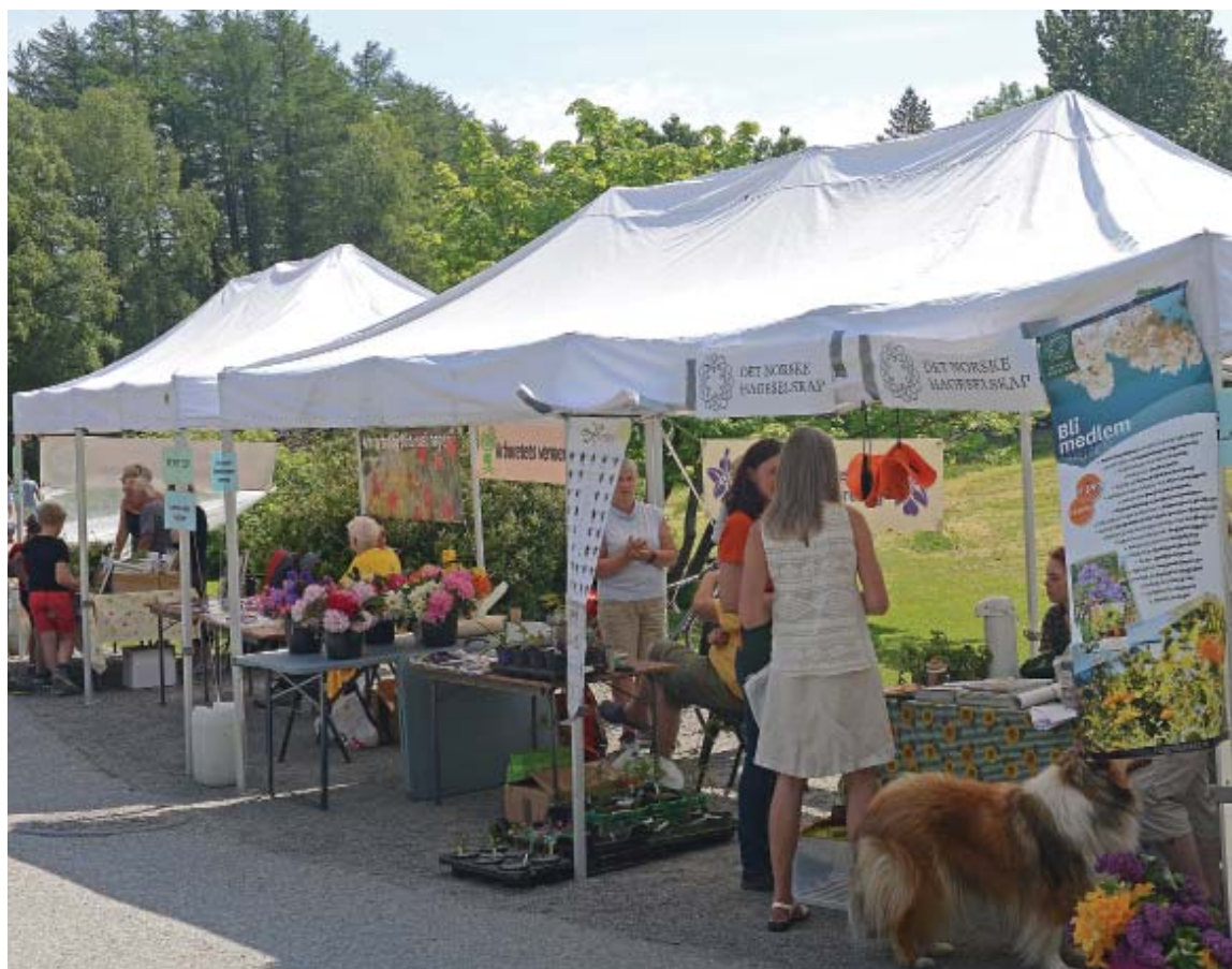
Fra Arboretets dag.