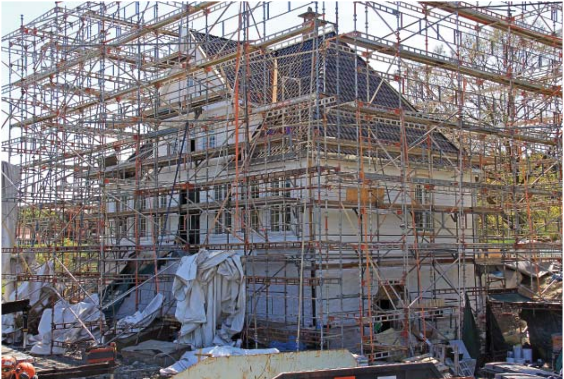
Lystgårdshuset fra Lønningen er reist i Botanisk hage på Milde og er pakket ut. Taktekkere og malere er i sving med å gi huset den finish det krever (foto: Terhi Pousi, 19. mai 2018).

plass. Hoveddelene til huset ble resaurert og satt i stand på verksted, og senere montert på byggeplassen. Huset var kledd inn i en stor presenning med stillaser som gjorde det mulig å arbeide under tørre forhold. Utpå våren 2018 ble presenningen fjernet slik at vi lettere kunne følge med på slutføringen av det utvendige arbeidet.