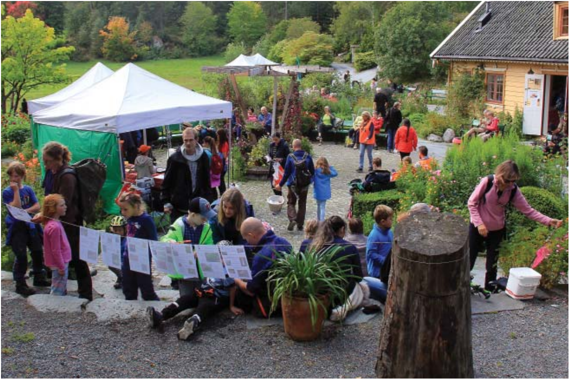
Bergen sopp- og nyttevekstforening holder 'Soppens dag' i Arboretet med aktiviteter i og ved Blondehuset – tradisjonen tro den første søndagen i 'sopptember' (foto: Terhi Pousi, 2. september 2018).