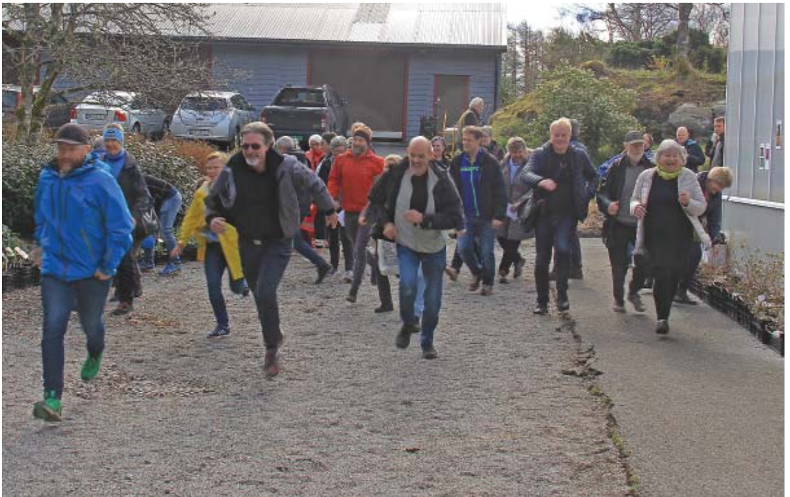
Startskuddet er gått for Venneforeningens årlige plantesalg (foto: Terhi Pousi, 28. april 2018).

Det er observert skade etter hjort, spesielt et tilfelle i Botanisk hage der en hjort hadde gnagd i stykker en furu. Spor etter hjort blir registrert sporadisk i Arboretet, men den gjorde ingen nevneverdig skade der.