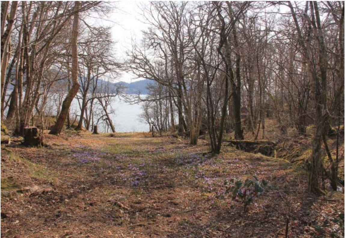
Vårkrokus (Crocus vernus) i den lokale formen 'Mildekrokus' har funnet seg til rette i eikeskogen i "Edens hage". Området, som ligger lunt til mot Fana fjorden, er på 7,5 mål. Det ble kjøpt av Det norske arboret i oktober 2017.