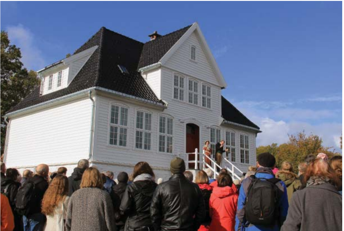
Det var "kjåka fullt" da Lystgården ble overrakt til Universitetet i Bergen og kunne tas i bruk for Botanisk hage (30. september 2018).