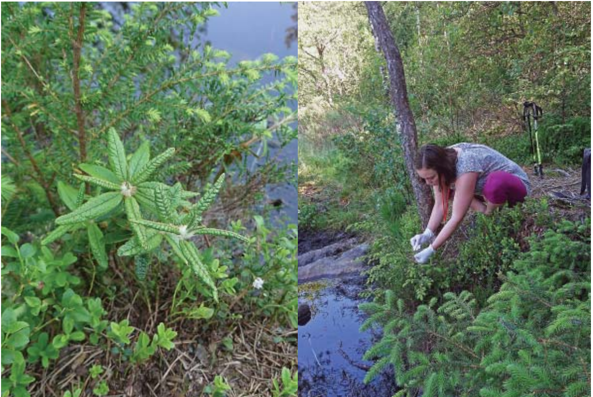
En plante av Rhododendron cf. diversipilosum har etablert seg fra frø ved Mørkevatnets bredd (t.v.). Den må være avkom av en plante i våre samlinger, og Rakel Blaalid (t.h.) samler blad for ekstrahering av DNA og genetiske studier (foto: Per Harald Salvesen, 1. juni 2018).

kum via hageutforskeren i Iris, men så langt er bare rhododendron-artssamlingen og Japanhagen blitt publisert. Det arbeides med å klargjøre flere samlinger for publisering via nettsiden vår, da dette er en prioritert oppgave for Universitetsmuseet.