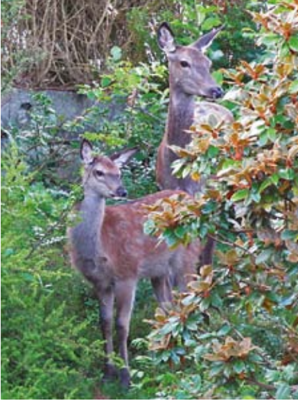
En nærgående hjortekolle med kalv ble til stadighet observert nær husene, her ved Mildevegen 210.

Etter søknad til viltkonsulenten i Bergen kommune, ble det gitt fellingsløyve på to hjorter. Begge dyrene ble avlivet med velrettede skudd tidlig en morgen i begynnelsen av oktober.