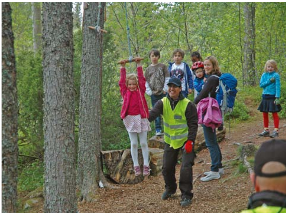
Løypestrengen er høydepunktet for mange i aktivitetsløypen under Arboretets dag.