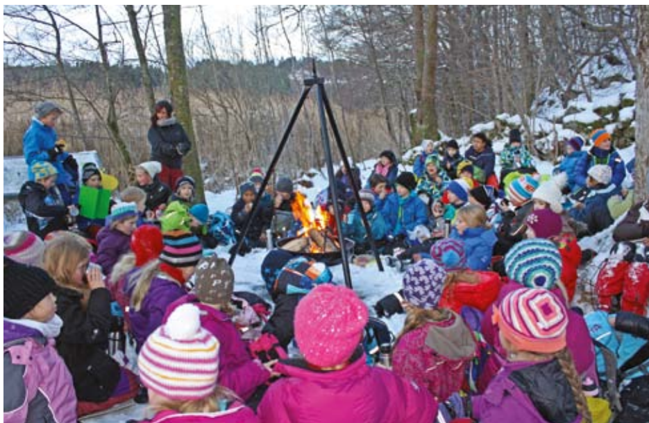
Hjellestad skole på tur til Mildevatnet med ski og bålpanne.

En annen viktig støttespiller for oss er "Kor e' Vi» som driver kaféen i Blondehuset på søn- og helligdager fra påske og ut september. I mai og juni er det kafé også på lørdager. Besøksstatistikken viser størst tilstrømming på søndager med fint vær, med Arboretets dag som et høydepunkt.