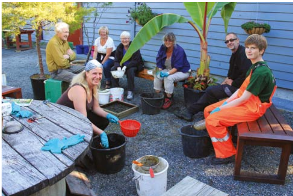
Fra snegledugnad i Arboretet der naboene ble invitert til å være med å infisere brunsnegler fra egne hager med nematoder.

spøytet med insektmiddel i rhododendronsamlingene overhodet. Dette viser seg nå tydelig på visse sorter, som ser medtatt ut og vurderes fjernet fra utstillingene.