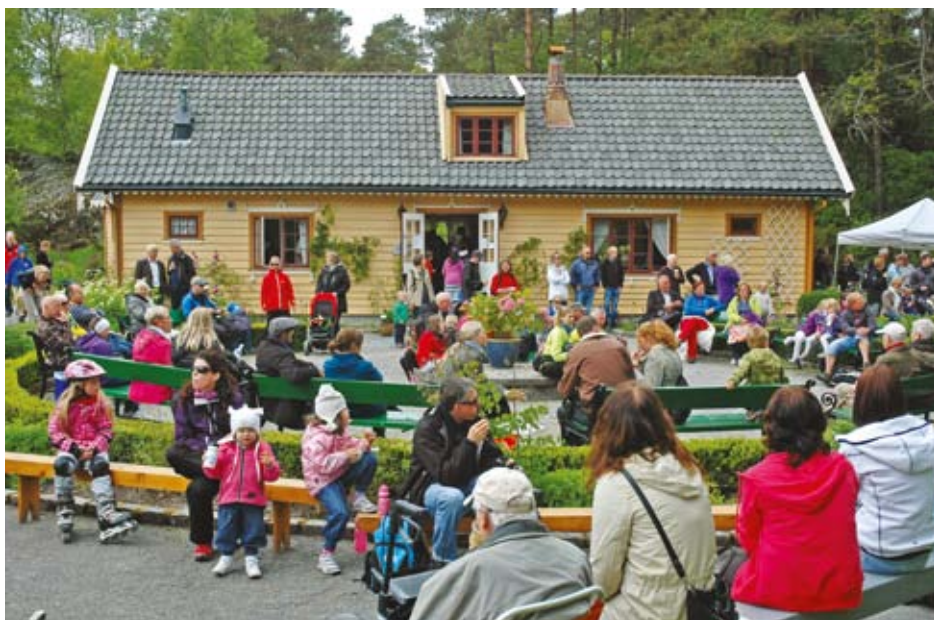
Det var folksomt i Blondehushagen under Arboretets dag, søndag 3. juni 2012.

den vår. Dette er et nyttig og etterspurt tilbud, men vi må sikre at informasjonen er korrekt og at vi ikke publiserer detaljert opplysning om sårbare planter som kan stimulere til tyveri. Så langt har vi gjort artssamlingen til rhododendron tilgjengelig for publikum.