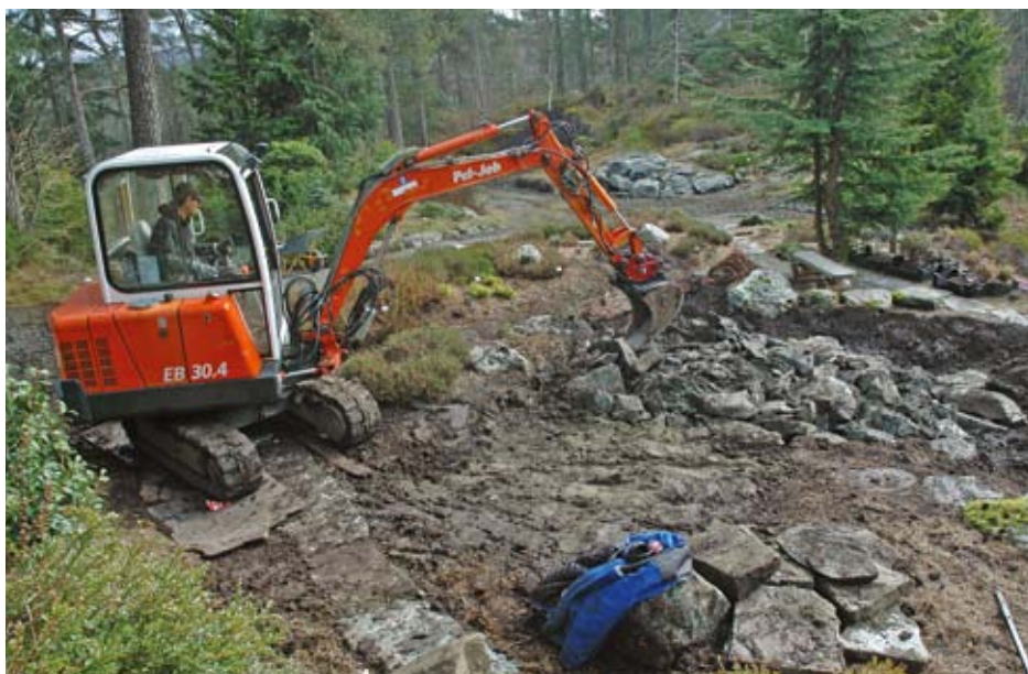
Grunnarbeid i Lynghagen etter kalde vintrer og stor utgang av planter. Et nytt felt anlegges og store steiner i bunnen skal sørge for god drenering og relieff til lynglandskapet.

Universitetets virksomhet på Milde er regulert gjennom en samarbeidsavtale med Stiftelsen Det norske arboret, som forvalter arboretområdet på til sammen ca. 600 daa av tidligere Fana heradsgards utmark på Milde. Stiftelsen fester området av Bergen kommune, og av dette igjen er ca. 70 daa overtatt av Universitetet i Bergen til Botanisk hage. Samarbeidsavtalen mellom Universitetet og Stiftelsen ble fornyet i 2012. Stiftelsen mottar offentlige tilskudd fra Hordaland fylkeskommune, Landbruks- og matdepartementet og Bergen kommune. Viktige oppgaver for Stiftelsen er å bidra til tilrettelegging for opplevelse, rekreasjon og friluftsliv.