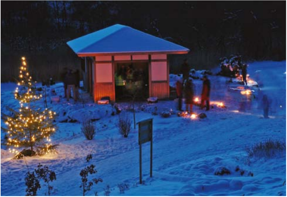
God stemning og fine forhold under lyktevandring i Japanhagen, torsdag 6. desember 2012.

snødekt og det ble en fin stemning i det kalde været med tente lykter, fakler og japansk musikk. Det var omvisning om lyktene i hagen og enkel servering i Tepaviljongen, og det hele ble dekket av et filmteam fra UiB som produserte en video fra arrangementet ( http://vimeo.com/55775509 ).