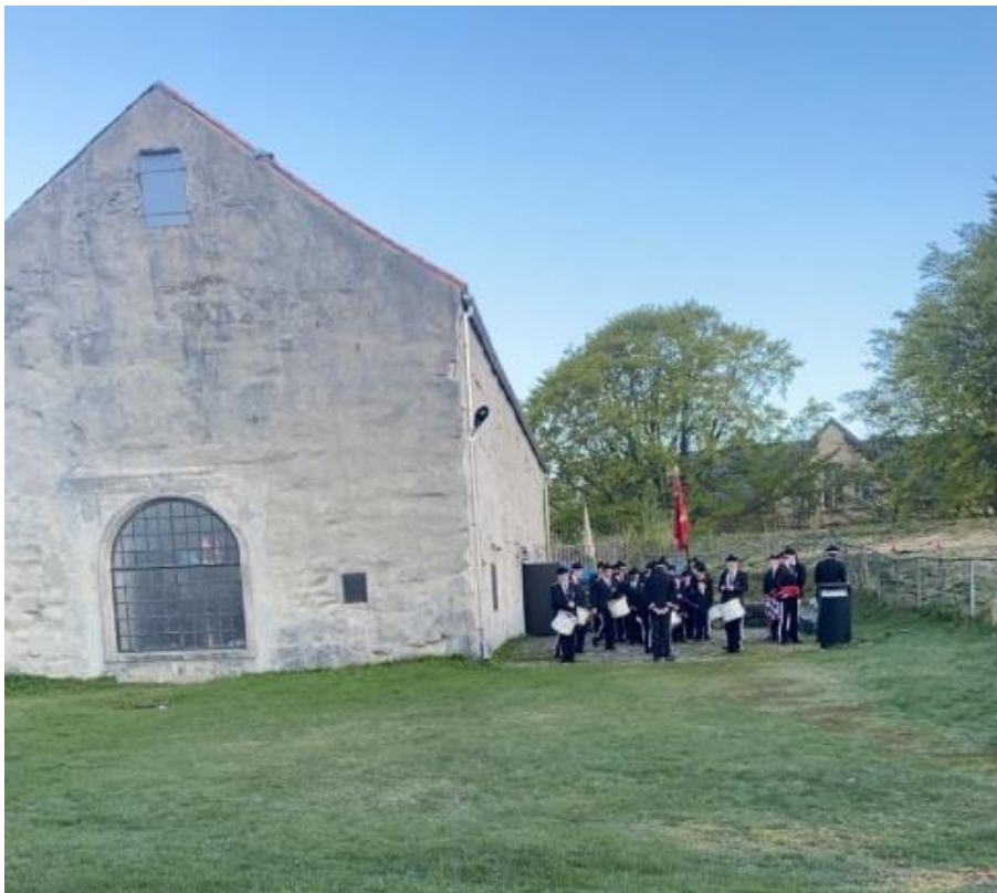
Figur 10 Nordnæs bataillon oppstilt på fredriksberg festning på stiftingsdagen deira, den 3. Mai.

Dersom ein tek utgangspunkt i Nordnes bydel, har denne endra seg mykje sidan Nordnæs Bataillon byrja å marsjere i gatene, og bruke det som sitt område. I dag brukar dei Fredriksberg festning til samlingsplass, og Krutthuset som står igjen frå 1706 er det berre bataillon som brukar til sitt lokale, både som samlingshus og til oppbevaring av utstyr og uniformar. Frå gammalt av var dette eit kruthus, og bataillon begynte ikkje å bruke det før i 1930. Fredriksberg begynte dei å bruke i 1960-åra (Kvamme, 2022:45). Byen har altså endra seg i forhold til gutane, slik at dei skal kunne ha ein plass å vere, og bukorpsa vil dermed bestå. Fredriksberg er blitt Nordnæs Bataillon sitt territorium, sjølv om det er ein viktig del av heile byen. Ved å bruke denne plassen aktivt, kan bataillon vise kven sitt territorium dette er.