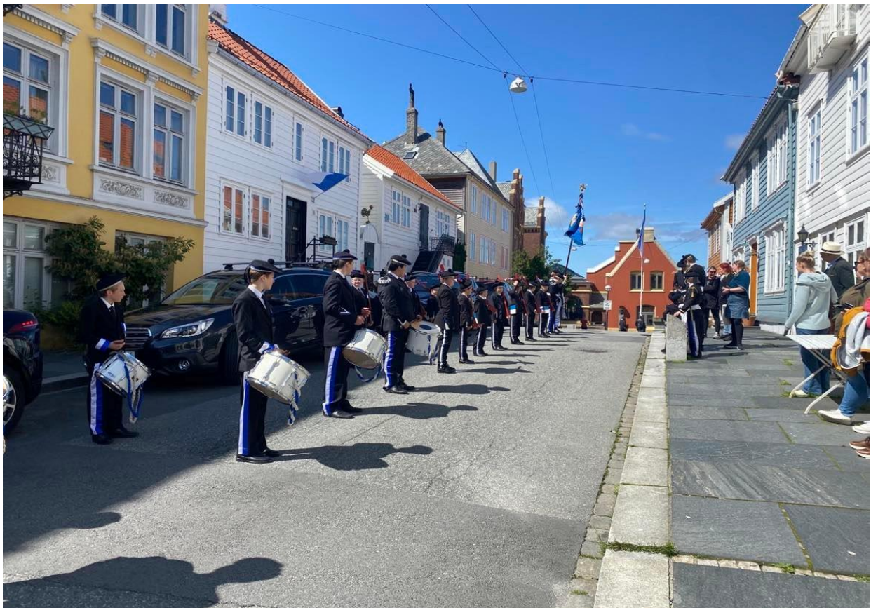
Figur 4 Sydnæs Bataljon stiller opp før marsjering i Sydnegaten på buekorpssenes dag 2022.

I sesongen 2022 marsjerte buekorpset med bogar som bevæpning , men dette er noko dei kjem til å endre neste sesong. Eg kjem meir attende til dette i kapittel 5. Dette buekorpset følgde eg på heile Buekorpssenes dag og på stiftingsdagen deira, som i 2022 blei lagt til nærmaste laurdag, den 11. juni. Dette var veldig kjekt. Det er eit lite buekorps, med lågt medlemstal, noko dei håpar på at skal stige i sesongen 2023, då dei har 160 års jubileum. Dei jobbar no aktivt for å rekruttere medlemmar, slik at korpset skal bli større og endå meir synleg på Sydnes.