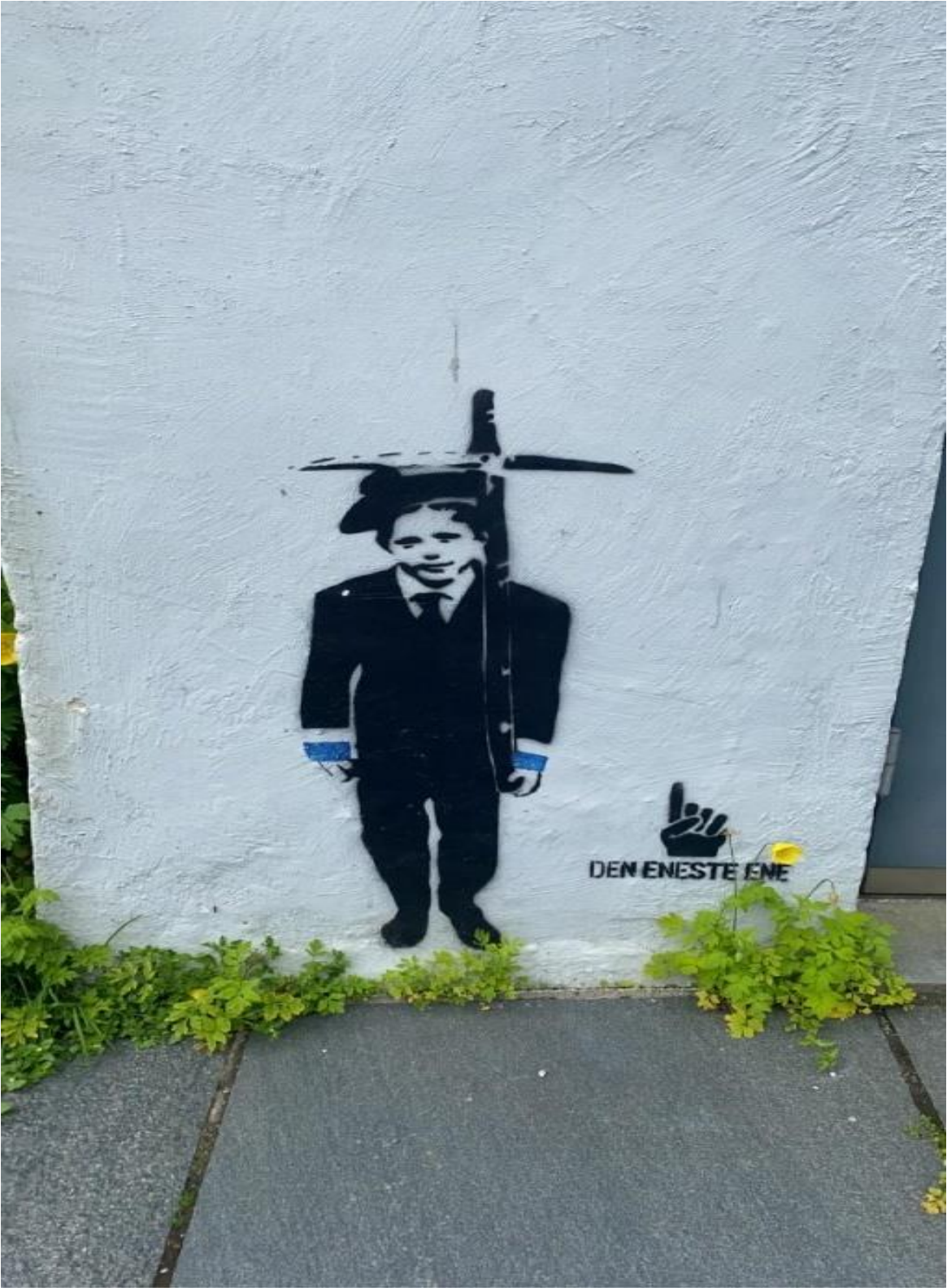
Figur 6 Gatekunst av ein soldat i Sydnegaten.