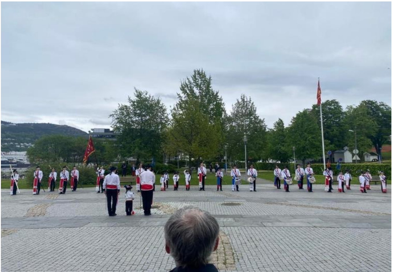
Figur 2 Eksersis i bukta på Laksevåg, Laksevågs Bueskyttere.

Laksevågs bueskyttere er eit buekorps som eg kom tidleg i kontakt med, allereie før feltarbeidet starta. For å få litt greie på korleis eg kunne komme meg inn i buekorpsrørsla, valte eg å ta kontakt med sjefen her ganske tidleg. Dette var for å få vite om det var greitt at eg var med ute i felten, og kva moglegheiter eg hadde for å komme i kontakt med dei ulike tilhøyrande til buekorpset. Eg hadde difor ein god samtale med sjefen tidleg, og opplevde denne som veldig bra og informativ. Eg følte meg allereie inkludert, og kjente meg klar før å starte på feltarbeidet, og bli med på heile sesongen deira, frå start til slutt. Eg fekk kommentarar første gong med dei som for eksempel «du må vere med oss frå klokka 06 den 17. mai!» og «neste søndag må du komme, for då skal me ha fellesmarsjering». Dette gjorde til at eg følte med ein gong at eg var velkommen til å følgje dei resten av sesongen.