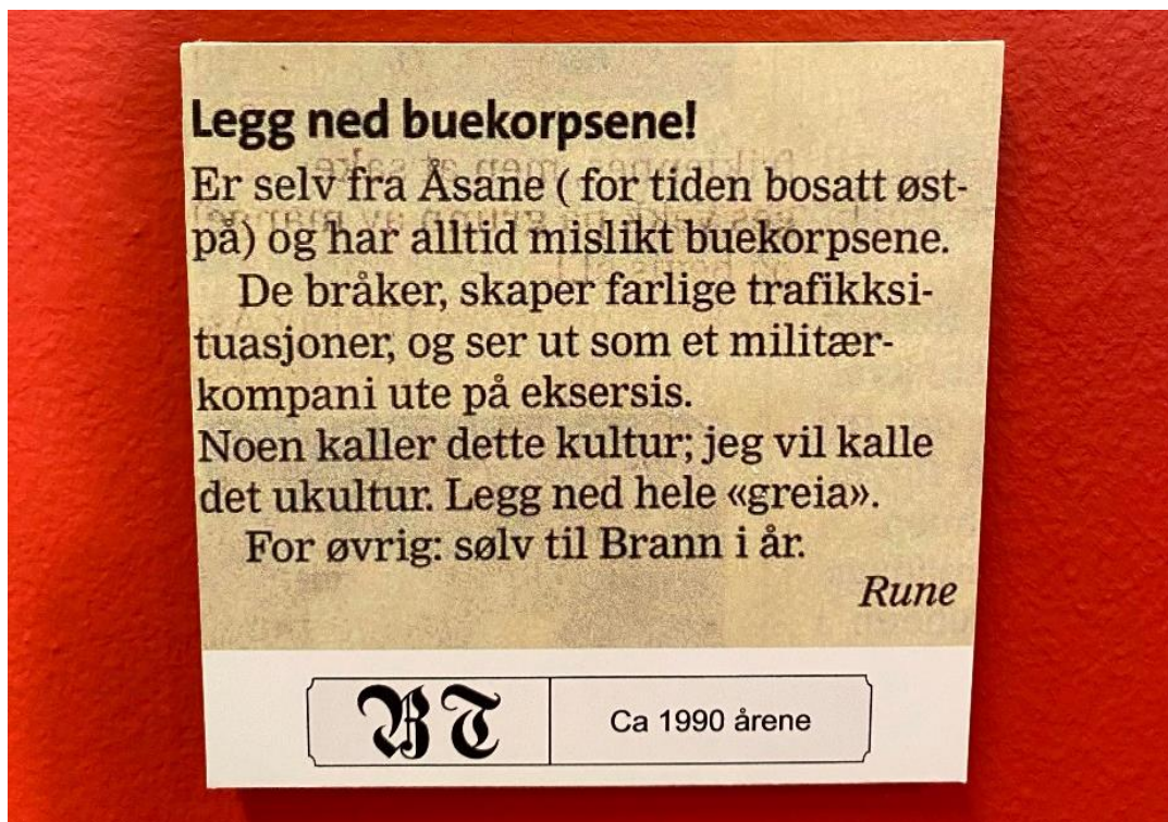
Figur 8 Bilete av avisutklipp frå Buekorpsmuseet, oprinneleg frå Bergens Tidene.

Men sjølv om svært mange under mitt feltarbeid gir uttrykk for at alle i Bergen likar buekorpsa, så er det ikkje heilt slik det er og mange gir også uttrykk for at dei ikkje likar dei: Det er mykje tromming, dei stoppar trafikken, og tek mykje plass i gatene, meiner nokre. Andre som ikkje likar buekorpsa er innflyttarane som ofte framhevar tromminga, og at dei går i vegen for trafikk og folk i gatene.