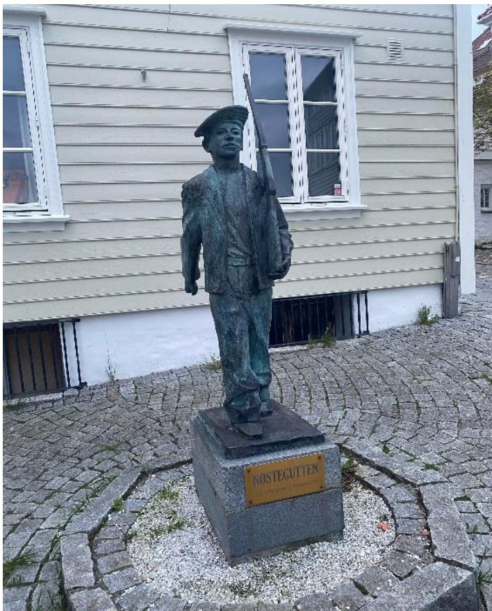
Figur 9 Statue av Nøstegutten.

På Nøstet og Verftet er det ikkje bukorps som høyrer til i dag. Tidlegare har det vore eit bukorps som heitte Nøstets Bataljon. Det vart starta i 1870, og marsjerte heilt fram til 1961, med mange pausar mellom dette (Hartvedt, Skreien, 2001). Då eg var på bukorpsenes dag , og gjekk med ein gjeng med gamlekarar frå Sydnæs Bataljonen ned til Nøsteboden, ein pub på Nøstet i Bergen sentrum, stoppa me med ein statue som sto på Nøstet. Statuen heitte Nøstegutten , og blei reist av Nøstegutar og Nøstejenter i 2011 som eit minne frå bataljonen. Ein av desse gamlekarane frå Sydnæs kunne også fortelje at faren gjekk i Nøstets bataljon. Sjølv om bukorpsa dør ut, lev dei fortsatt vidare i strøket og i den bergenske historie, og er viktige for dei som har tilhøyregheit til desse korpsa. Strøka har bukorps som tilhøyrer dei, sjølv om mange av dei er nedlagte. Slike statuar kan ein sjå rundt om i heile Bergen, både frå nedlagte korps, og dei som fortsatt er aktive i dag. Dette vil eg komme meir tilbake til i kapittel 5.