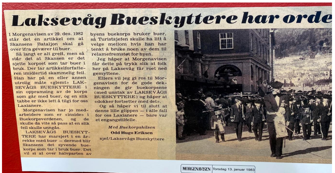
Figur 11 Avisutklipp frå Buekorpsmuseet, opphavelag frå Morgenavisen .

I Morgenavisen den 13. januar 1983, kom sjefen den gongen i Laksevågs bueskyttere med eit utsegn om å bli ekskludert. Morgenbladet skriv at Skansens Bataljon skal gå frå gevær til bogar. Dei skriv at dei er det sjette korpset som tar i bruk bogar. Dette reagerte Laksevåg på, og dei meinte at ein ikkje kan gløyme Laksevåg når ein skriv om buekorps. Dette er noko som dei tek tungt, og det er viktig for dei, buekorpset og strøket og ikkje bli gløymde. Kanskje også ekstra viktig då dette var det einaste buekorpset på andre sida av Puddefjorden på denne tida, og byen var ikkje like samla som den er i dag. Ein er altså veldig opptatt av at strøket sitt, der ein høyrer heime, ikkje skal bli gløymt eller sett vekk ifrå. Poenget var ikkje at det var feil tal, men at ein ikkje skal gløyme Laksevåg, sjølv om det er eit strøk som den gong låg litt utanfor sentrum.