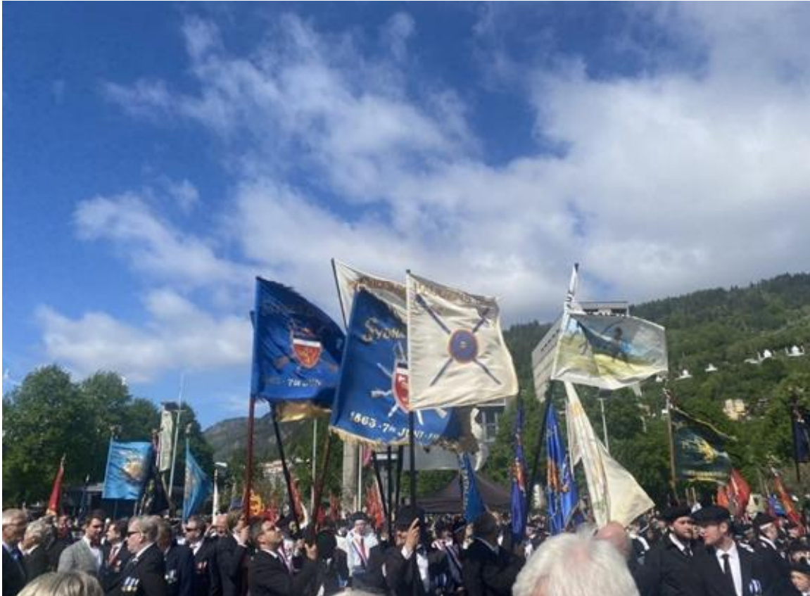
Figur 19 Fanene til Sydnæs Bataljon på buekorpsenes dag, både eldre og nyare.

Til fana er det knytt ulike rituale. Eit av desse er blant anna faneparaden, som vist tidlegare i kapittel 3, kor fanebæraren går parade for å vise respekt for fana. Når Buekorpsenes dag blei arrangert den 28. mai 2022, blei det gjort ein felles faneparade på Festplassen i Bergen, midt i sentrum. Her blei det gjort faneparade av alle som heldt ei fane samtidig. Dette var mange faner frå kvart av korpsa, og det blei til saman mange faner og mykje fargar samla. Både nye og gamle faner var med, noko som var veldig spesielt å få med seg. Alle visste korleis ein parade for fana skulle utførast, og alle gjorde det samstundes. Medan dei som haldt fanene utførte paraden, var det heilt stilt på festplassen. Ein kunne berre høyre marsjen og takten som faneparaden skulle gjerast til. Dette til tross for at det var eit enormt oppmøte denne dagen, noko som viser kor viktig og høgtidleg faneparaden er for buekorpsa.