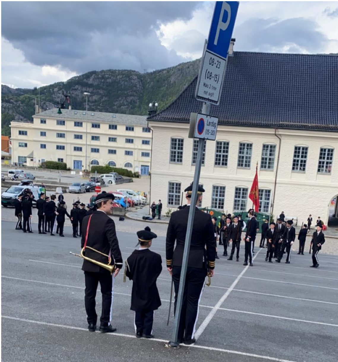
Figur 15 Tulleeksersis, der rollane blir endra på, og soldatane får oppleve å vere offiserar. Her ser ein den yngste av soldatane som sjef for denne dagen.

Å ha ein dag der ein endrar på rollene, er stas, spesielt for dei yngste. Det å endeleg kunne få styre litt, og å få ei rolle som for dei kanskje betyr meir, kan ein sjå at dei tykkjer er kjekt. Når ein gjer om på heile hierarkiet for ein dag, gjer det at alle kan få prøve seg i andre rollar, og kanskje setje seg meir inn i kva dei andre rollane i buekorpset inneberer. Dette skapar nok meir forståing over kva andre som er på ditt lag har som innhald i si rolle, og vil sannsynlegvis skape eit betre samhald i buekorpset.