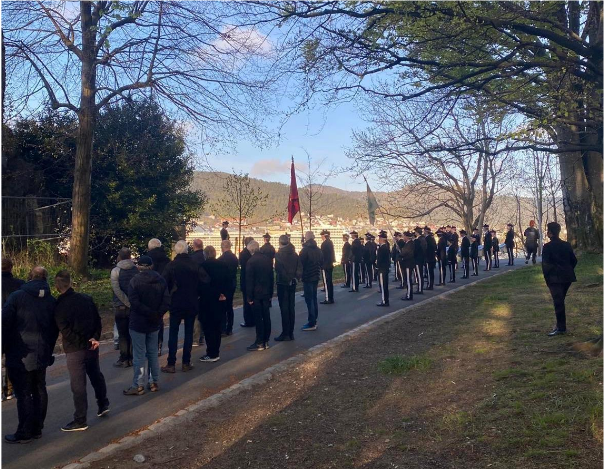
Figur 23 Nordnæsbataillon og gamlekarane oppstilt tidleg den 3. mai, for å ta den historiske runden og heidre buekorpset sine viktige menn.

Ein kunne sjå at dette var ein stor festdag for heile Nordnes. Då denne historiske runden vart tatt, var det mange som følgde med, og fleire og fleire blei med på runden jo lenger den kom. I det bataillonon gjekk forbi Nordnes sjøbad, blei flagget heisa. Dette gjaldt også når dei kom til eit viktig hus der dei skulle halde tale, ved det Ballasthandlerolenske hus. Dette var også eit viktig hus for dei, då det har vore i bataillonon i mange år – og det heile starta med at bataillonon fekk ha rådsmøte der i starten, når dei ikkje hadde nokon anna plass å vere. Huset ligg sentralt til heilt ute på Nordnæs. Det er fortsatt busett av ein tidlegare Nordnæsgut den dag i dag, og går fortsatt i arv nedover.