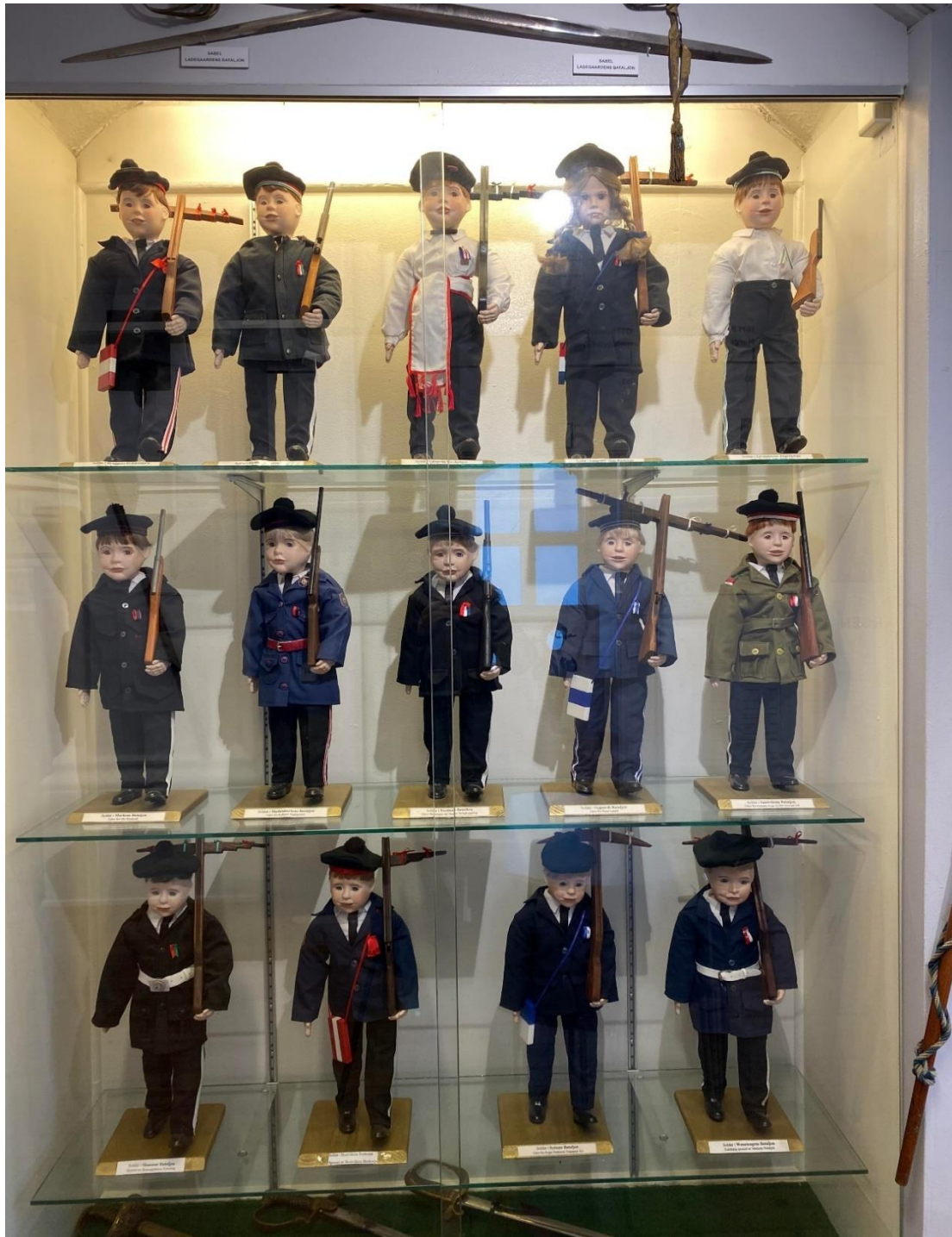
Figur 21 Dagens buekorps (utanom Damsgårdsfjellets Bataljon) sine uniformar, utstilt på Buekorpsmuseet.

Uniforma i dag består av svart dressbukse, svarte finsko, kvit skjorte, skottelue og svart dressjakke for alle buekorpsa, utanom Laksevågs Bueskyttere, Løvstakken Jægerkorps og Damsgårdsfjellets Bataljon. Dei har ikkje svarte jakker, men marsjerer berre i kvite skjorter. Dette er basisen som alle i buekorpsa har på seg når dei er ute på marsjering eller har eksersis.