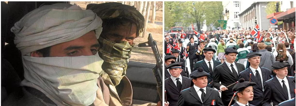
Figur 17 skjermdump av avisutklipp frå Aftenposten nettavis, den 21. November 2008, som også skreiv om uttalelsen til Amir Payan.

SV-politikeren Amir Payan i Bergen går hardt ut mot byens mest elskede form for sivilforsvar, buekorpene.