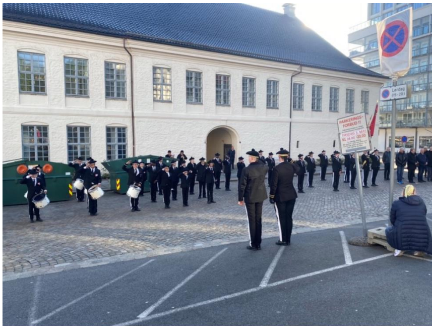
Figur 5 Nordnæs Bataillon på deira faste eksersiseplass, Tollboden.

Buekorpsset er eitt av tre laurdagskorps, og er i allianse med Nygaards Bataljon og Dræggens Buekorps, som er dei to andre laurdagskorpsa. Dei har ulike aktivitetar i lag, som fellesmarsjering og idrettsdag. I tillegg besøker dei kvarandre på deira stiftingsdagar, og har då ein eksersisoppvisning, kor dei overleverer gåver. Når ein har eksersisoppvisning, så har buekorpsa ein oppvisning, der dei småspring rundt etter ordrar frå sjefen, for å forsvare fana si. Eksersisdagane blir ofte avslutta med ein eksersisoppvisning, og det er også oppvisning på større dagar. Dette vil eg komme meir tilbake til i kapittel 5. I løpet av sesongen 2022 var eg med på mange av deira aktivitetar, som stiftingsdag, idrettsdag, landtursdag og såkalla tulleeksersis . Desse dagane og det rituelle innhaldet i dei kjem eg meir attende til i kapittel 3 og 5.