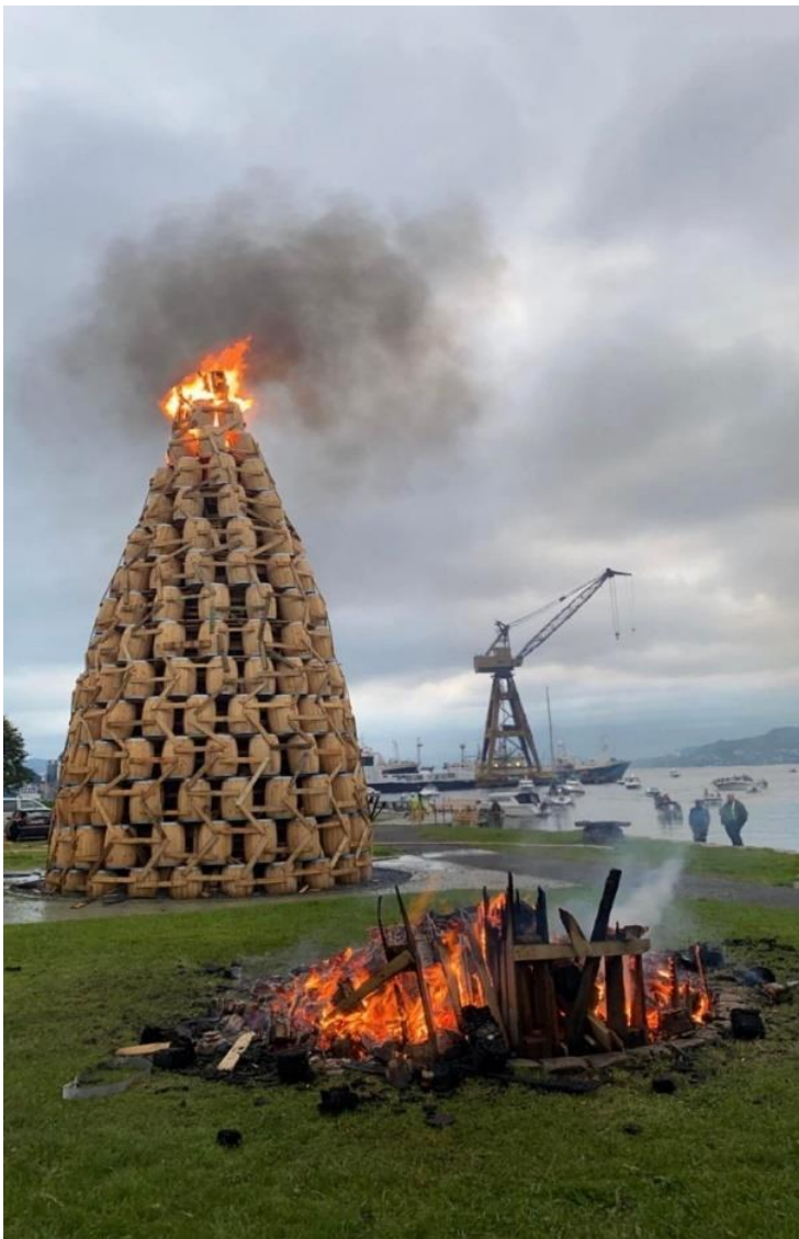
Figur 3 Tønnebålet på Laksevåg.

Laksevågs bueskyttere blei stifta den 8. Mai 1894 (Schönfelder, 1992:64). Fargane deira, som kjem til uttrykk både på uniformen og i fana, er raudt, kvitt og blått. Buekorpset held til på Laksevåg, som er litt utanfor bykjerna, og her har dei både samlingslokale og eksersisplass, i bukta på Laksevåg. Buekorpset er i såkalla «allianse», som er dei som dei har ekstra godt samarbeid med, med Løvstakken Jægerkorps, som ikkje ligg langt vekk frå dei geografisk. Buekorpset er relativt stort i forhold til dagens buekorps, og stilte med rundt 30 gutar på linje sesongen 2022. Buekorpset marsjerar med bogar som bevæpning . Dette er altså kva gevær buekorpsa brukar når dei er ute på marsjering. Det som er ekstra spesielt med dette buekorpset, er at dei kvart år har eit stort tønnebål på Laksevåg, på eksersisplassen deira, som buekorpset står for. Dette har dei hatt ansvaret for sidan 1903 (Hartvedt og Skreien, 2008). Også i sesongen 2022 var det tønnebål. Då møtte mange frå heile byen, og buekorpset hadde bygd eit stort og flott bål, hadde kioskar med sal av mat, og eit flott sceneshow for store og små.