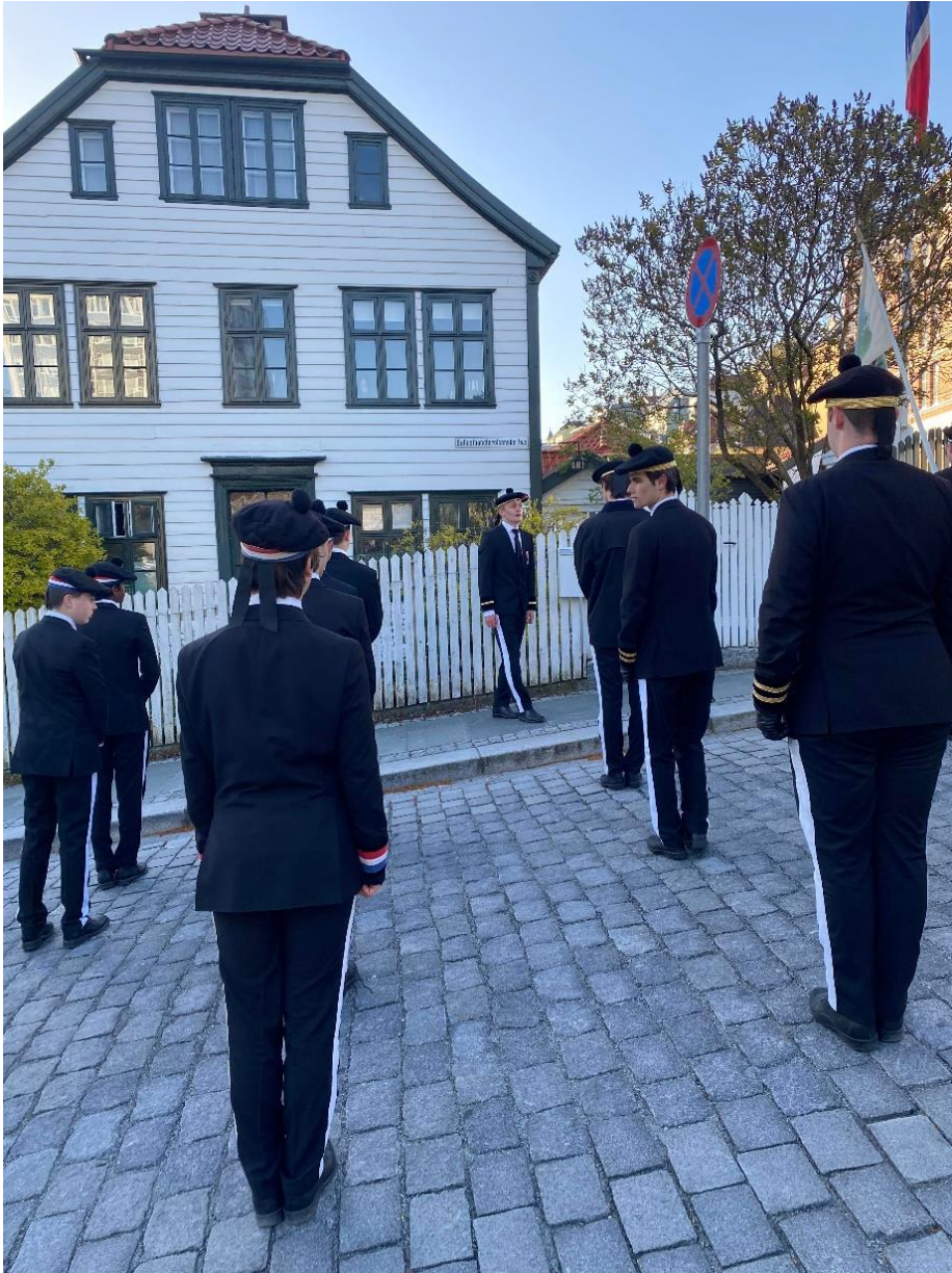
Figur 24 Nordnæs bataillon utanfor Ballasthandlerolenske hus den 3. mai. Her blei det haldt ein takketale til familien som i generasjonar har hatt huset og lånt det ut til bataillon i trangare tider.

«Hurra for bataillon!» ropte buekorpset og gamlekarane etter kvar tale, før dei stilte opp igjen, og gjekk vidare til den neste historiske staden. Alle helse også på huset eller plassen som dei held tale til, ved å ha handa opp mot hovudet. Det er ein veldig høgtidleg stemning, og ein skjønnar fort at denne historiske runden til bataillon er viktig for dei. Det å heidre dei som er viktige og har vore med på å bygge opp bataillon gjennom åra er viktig på slike dagar som dette, når bataillon skal feirast.