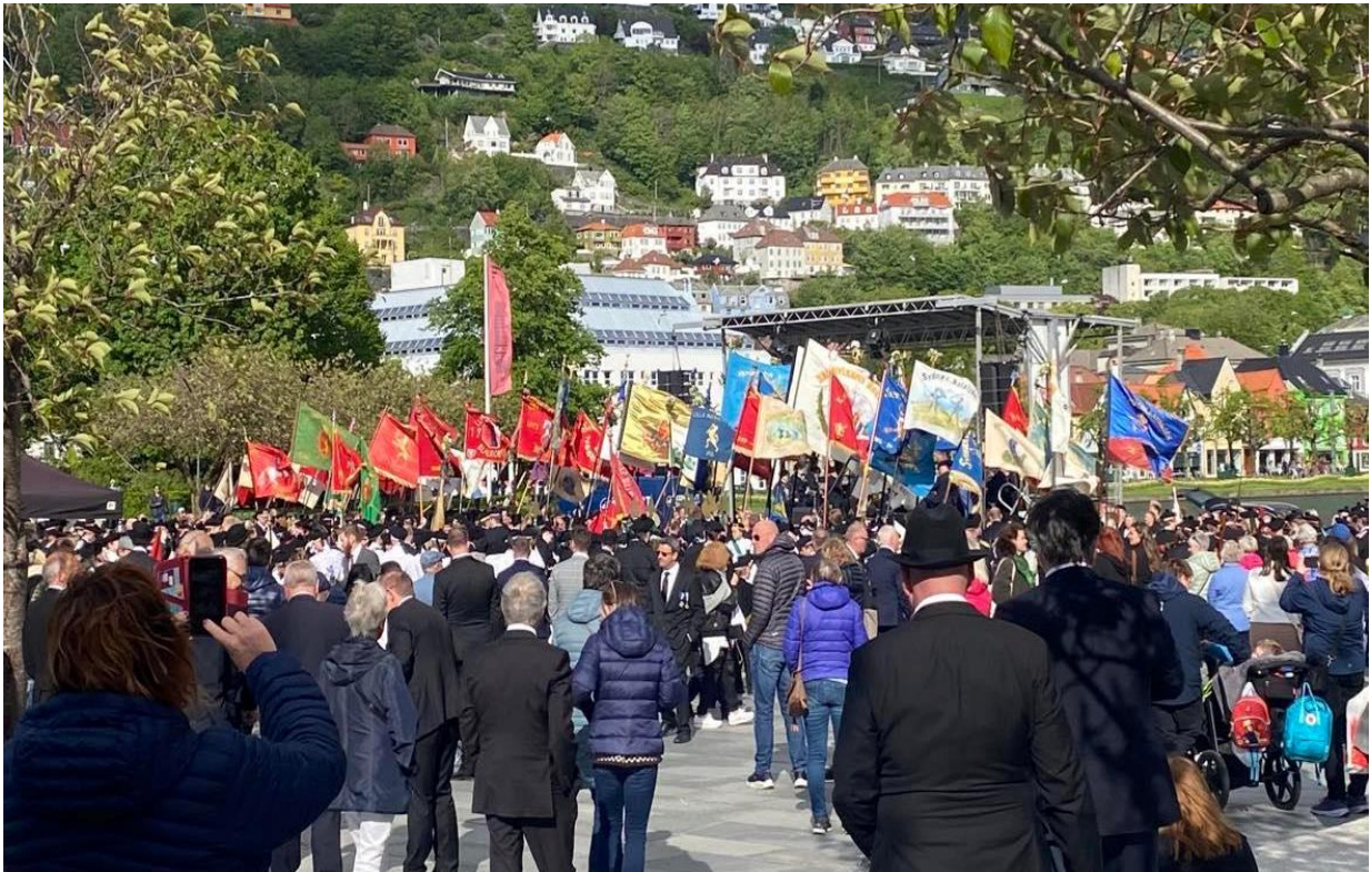
Figur 20 Felles faneparade på buekorpsenes dag for alle buekorpsa.

Eit anna ritual fleire korps har med fana, er at nokre korps ved spesielle anledningar har ein blomsterbukett i fana. Dette er på dagar som Buekorpsenes dag , stiftingsdagen og andre dagar der ein pyntar fana ekstra mykje, fordi det er ein større dag. På stiftingsdagen, i alle fall i Sydnæs Bataljon, er det gamlekarane som gir blomstrar til bataljonen. Dette er ein av gåvene deira, og noko dei gjer kvart år, for å starte dagen. Når dagen er ferdig, blir buketten sjefen sin, sidan han er den øvste leiaren i buekorpset.