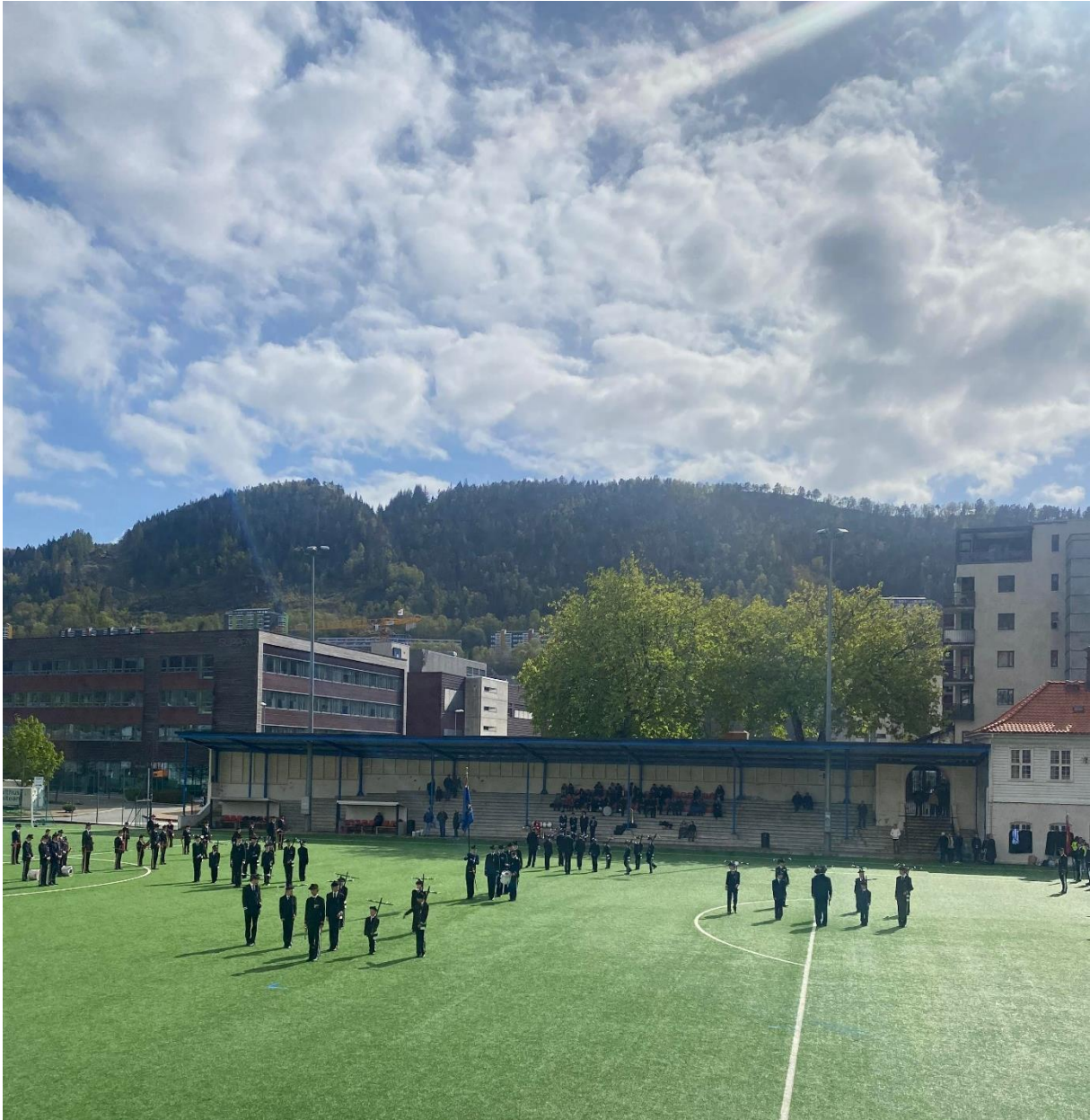
Figur 14 Eksersisopptreden på Møhlenpris under laurdagskorpsa sin årlege fellesutmarsj til Bellevue og Møhlenpris.

Denne tradisjonen med fellesutmarsj har laurdagskorpsa heldt på med lenge, heilt sidan dei begynte med det i 1910. Det er fortsatt ein stor dag for store og små, og er ein aktivitet som fengjer. Heile dagen blir avslutta med Nystemten, «nasjonalsongen» for bergensarane. Den blir brukt på slike store arrangement, som for eksempel jubilea til buekorpsa. Ein song som denne er noko som kan gi ein ekstra patriotisk følelse, og ein ekstra følelse av eit fellesskap. På denne måten gir det ein fysisk realisering av fellesskapet som oppstår i byen (Anderson, 1991:141).