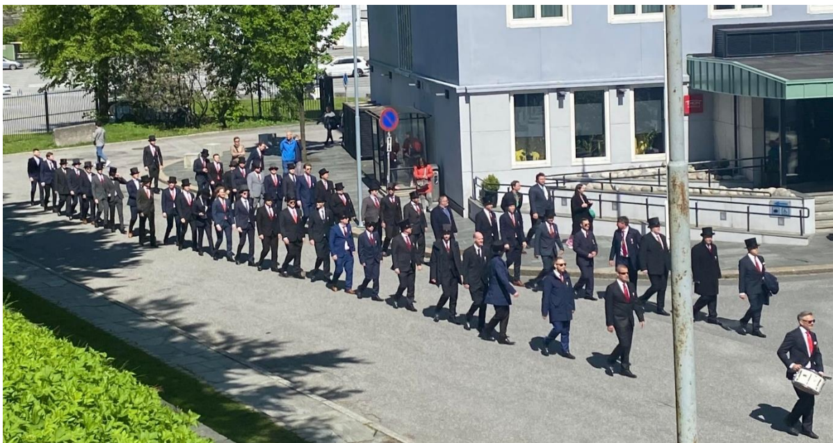
Figur 16 Her ser ein Nordnæs bataillon marsjerande på buekorpsanes dag. Dei har beholdt flosshatten, noko som viser at dei ein gong kom frå overklassen.

Når ein då byter posisjon fordi ein har blitt for gammal, vil ein også bytte sosial posisjon. Ein går frå å vere øvst i buekorpset, med mykje ansvar, til å bli eit vanleg medlem i gamlekarane, då det i gamlekarane ofte er dei med lengst erfaring som har ansvaret. Denne dagen, når ein er ferdig som buekorpsgut, er ein i ein mellomfase, før ein går over til gamlekarane. Ei ny tid ventar, denne gongen i ei anna rolle. Nordnæs Bataillon laga då ein seremoni ut av dette, for å takke sjefen som hadde vore den øvste leiaren i løpet av dette året, og gjort ein god innsats. Ein får ei anna tilhøyring til buekorpset med den nye rolla, men er fortsatt ein del av det.