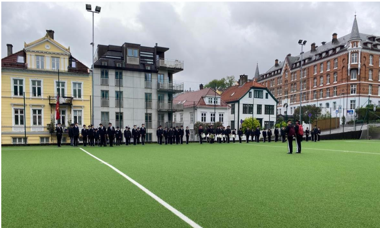
Figur 22 Norsnæs Bataillon oppstilt på Fotballbana på Nordnes. Dette er årets siste eksersisdag, og dei får utdelt medaljar for innsatsen sin denne sesongen.

Siste dagen eg var med Nordnæs Bataillon, hadde dei landtursdag. Dette vart ein lang dag med mykje som skjedde. Tidleg på morgonen møtte heile buekorpset, gamlekarane og foreldra opp på fotballbana heilt ute på Nordnæs, ved sidan av Depotbakkane, der dei vanlegvis møter opp når dei har marsjering. Det var kaldt og litt regn i lufta. Til tross for litt ruskete vêr, var det mange av foreldra som også møtte opp. Det var klart for å reise til Nordnæs dalen, men sidan dette var siste dag i sesongen, fekk alle som hadde gjort seg fortent til det medalje. Dette var det sjefen og adjutanten som sto for. Då gutane fekk utdelt medaljen som dei skulle ha, kunne ein sjå på stoltheita dette førte med seg. Gutane var stolte over å få medalje, men foreldra og andre bekjente som sto på sida og såg på, var minst like stolte. Det er stas å få medalje for å vere med i buekorpset, og ekstra stas når ein får utdelt heiderleg, den største av dei alle, som ein må gjere ein innsats i buekorpset for å gjere seg fortent til.