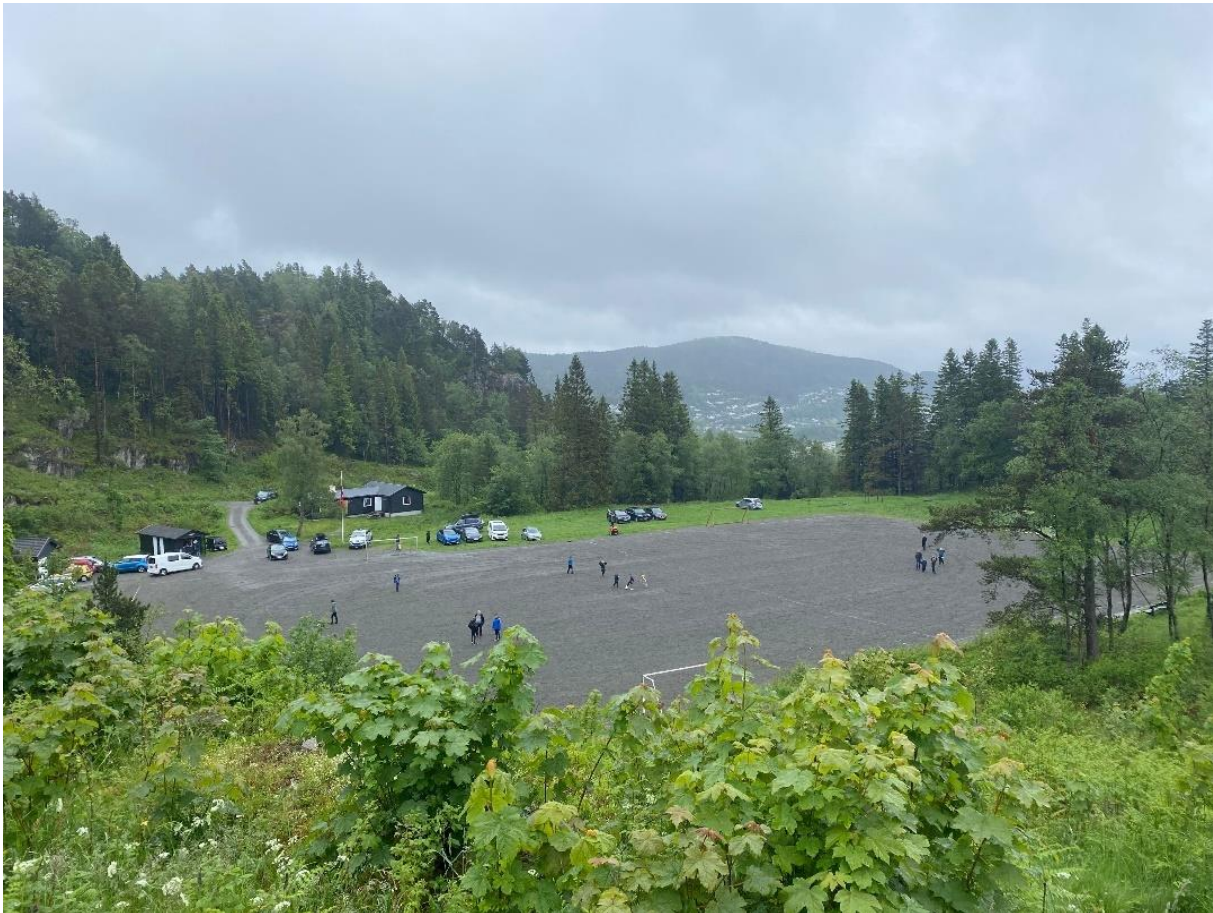
Figur 12: Idrettsdag i Nordnæsdalen.

I tillegg til at kvar og ein skal ha sine roller dei skal utføre i buekorpset, har dei også felles roller som dei skal utføre ilag som eit lag. Det er då viktig at alle som er med i buekorpset er obs på si eiga rolle, og laget sin rolle saman, slik at desse blir utført på best mogleg måte, og kan koplust med kvarandre.