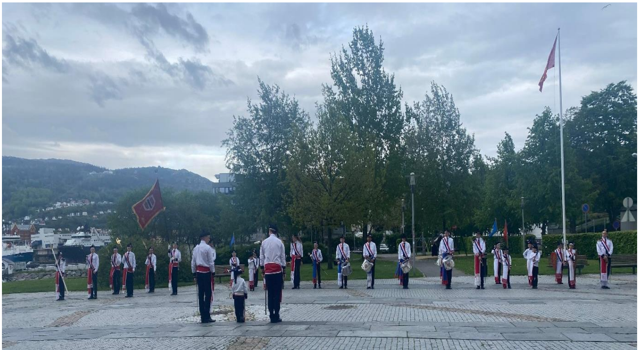
Figur 7 Eksersis i bukta på Laksevåg, Laksevågs Bueskyttere.

Då gutane gjekk for å øve på marsjeringa, kom eg i snakk med ei mor som hadde med ungar i buekorpset. Ho var ikkje frå Bergen, men har budd her i nokre år. Sjølv om det var mykje nytt og uvitande for ho, fortalte meg det ho kunne om buekorps, som var utruleg mykje. Eg fekk eit veldig godt innblikk i kva buekorpsa var, og ikkje minst kor mykje det betydde for dei som var med, både som medlemmar, men også som foreldre eller føresette. Som dette glimtet tyder, er buekorpset og ein sosial arena der foreldre møttest, med buekorpset som eit sentralt tema.