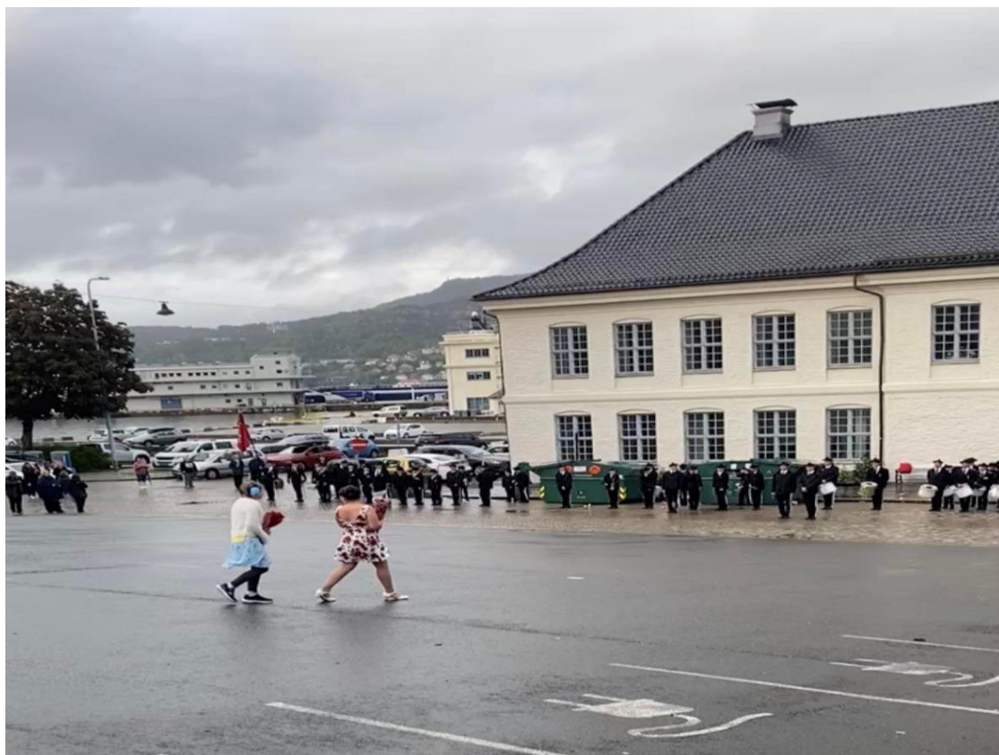
Figur 18 Blomsterpikene gir blomar til offiserane i Nordnæs Bataillon, her på Tollboden, deira faste eksersisplass.

Sjølv om kvinnene si rolle i buekorpsa framleis skil seg frå mennene, spelar kvinnene ei viktig rolle inn i den kvardagslege drifta av buekorpsa. Mødrene stiller ofte opp i kiosk, til hjelp med faner og uniformar, og der det elles trengs ei hjelpande hand. Mødrene og andre interesserte kvinner, er ofte med i noko som tidlegare blei kalla for damegarden. Dette er ein samling for kvinnene som vil hjelpe til. I dag blir denne kalla for støtteforeininga, slik at både menn og kvinner kan vere med i denne. Kvinnegarden har altså utvikla seg, slik at også menn kan få vere med. Då står det att å sjå om også buekorpsa vil gå i same retning med tida, eller om dei vil fortsetje å vere like kjønnsdelte som dei er i dag.