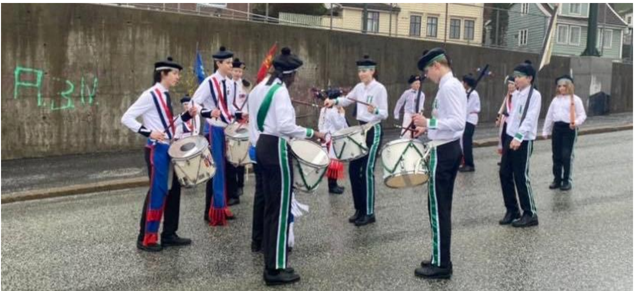
Figur 13: Ein slagarbattle, her mellom Laksevågs Bueskyttere og Løvstakkens Jægerkorps, under deira fellesmarsjering på Laksevåg.

På veg opp svingane, starta dei tre buekorpsa ein battle mellom slagarane. Slagarane frå alle dei tre buekorpsa samlar seg då på ein plass og står tett i tett. Då er det om å gjere å slå sin marsj, og prøve å få dei andre til å miste takten frå sin marsj. Ein marsj er ein song som ein spelar på trommene buekorpsa går med. Desse marsjane er litt ulike frå buekorps til buekorps, men samstundes som dei har fleire marsjar til felles. Ein må då slå høgast, noko som krev mykje uthald og fokus frå slagarane. Her er det om å gjere å vise kven sitt buekorps som er best. Det blir nok aldri kåra ein ordentleg vinnar, då alle buekorps meiner at sitt eige buekorps er det beste. Dette vart veldig intenst, og spennande å følgje med på. Gutane slår marsjen sin til dei blir heilt sveitte, og resten av buekorpsa står og føl spent med, og heiar på sitt korps.