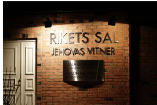
KAN MISTE REGISTRERINGEN: «Vi skal nå vurdere om de forholdene som kom frem i våre undersøkelser også kan ha betydning for registreringen av Jehovas Vitner», skriver Statsforvalteren i Oslo og Viken i et brev til Jehovas vitner.

JEHOVAS VITNER: Eksklusjonspraksisen til Jehovas vitner er årsaken til at de nylig mistet statstilskuddet for i fjor. Det kan få betydning for deres registrering som trossamfunn, varsler Statsforvalteren i et ferskt brev.