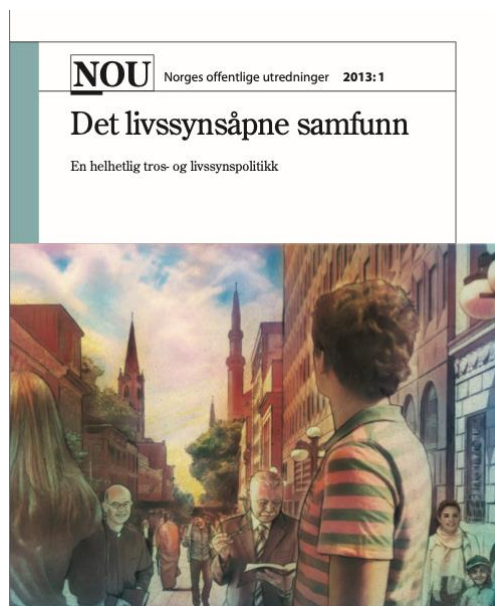
(Skjermdump av NOU 2013: 1)