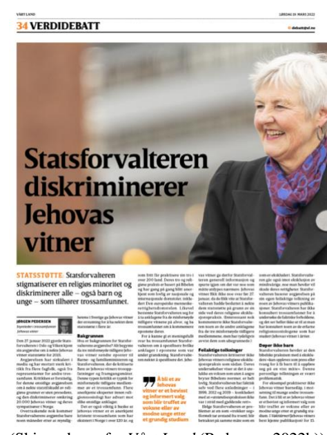
(Skjermdump fra Vårt Land (Pedersen, 2022b)).