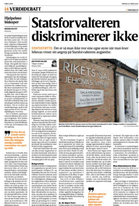
(Skjermdump fra Vårt Land (Nilsen, 2022)).

En annen straff Nilsen trekker frem er «offentlig refs», noe som medfører en organisert utfrysning av barn. Han legger til at alle dømte i Jehovas vitner skal behandles som voksne, uansett alder. Dette mener Nilsen legger grunnlag for avgjørelsen, og er et brudd på betingelsen for å kunne søke om statstilskudd. Avslutningsvis trekker Nilsen frem trossamfunnsloven (2020) som et resultat av en omfattende demokratisk prosess. Det politiske Norge ønsker med denne loven å sette betingelser for pengeutbetalingen. Betingelsene skal ikke være en forfølgelse av religion, men beskytte menneskene som rammes av den. Nilsen mener derfor trossamfunn må følge minstekrav i henhold til oppførsel (Nilsen, 2022).