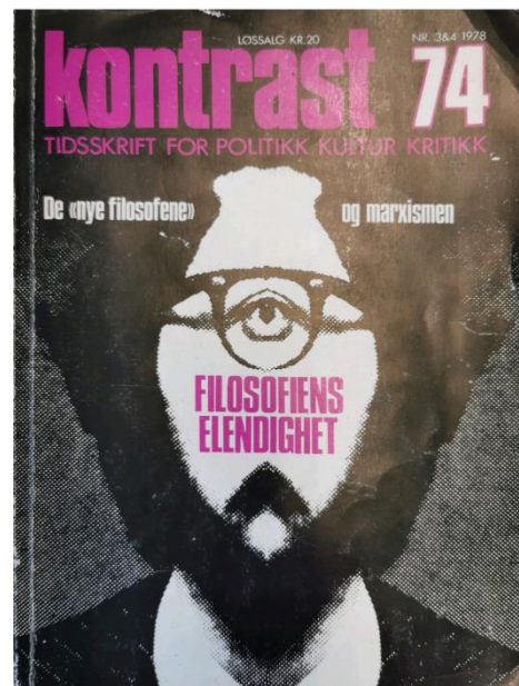
Kontrast 1978, nummer 74

I 1978 utga Kontrast et helt nummer dedikert til de nye filosofene med tittelen «De 'nye filosofene' og marxismen: Filosofiens elendighet». Dette var klart det mest sofistikerte, men også det mest infame forsøket fra venstresiden på å imøtegå Stubberuds kritikk. I dette nummeret er det to røde tråder. Det første som blir tydelig når man leser nummeret er et at det gjøres et forsøk på å «overta» diskursen om de nye filosofene; målet er ikke først og fremst å avskrive kritikken de reiste i Frankrike, men å skape et bilde av at deres norske formidlere og tilhengere har presentert dem på en feilaktig måte for egen vinning. Spesielt er dette tilfellet for André Glucksmann som var den fremste teoretikeren for de nye filosofene, og derfor også den som var vanskeligst å avskrive. Dette kommer klart frem i lederen til nummeret, som fikk tittelen: «Den franske ideologi og filosofiens elendighet: Forsøk på å stille André Glucksmann på beina». Der står det blant annet: