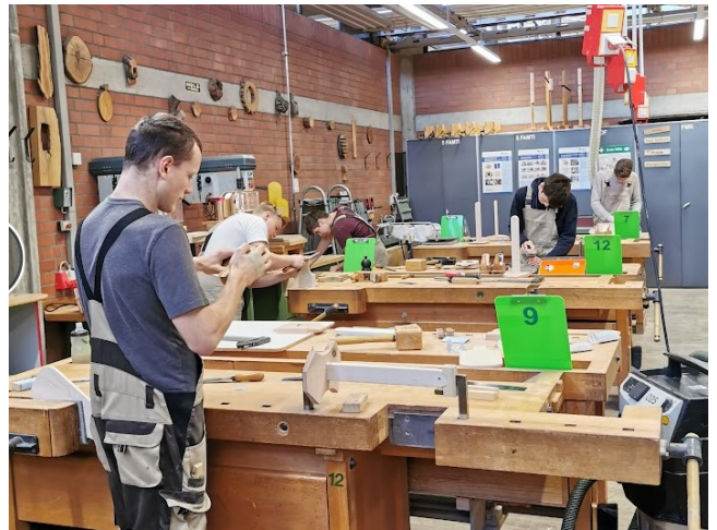
Figur 1 Klasserom for Tømrarar i Freiburg

Voss vgs har som mål at når ein reiser ut med ei gruppe elevar, skal ein kunne få oppleve nokre dagar på ein skule innan same programområde. Dette fungerer bra då dei aller fleste partnerane våre er skular. Det me har sett i mellom anna med Byggfag i Tyskland er at dei har meir fokus på materiallære og bruk av manuelt verktoy. I tillegg er skule og næringsliv to forskjellige dimensjonar. Medan i Noreg har me kanskje tettare samarbeid med næringslivet. Den tyske skulen i Freiburg fekk forklart vår modell og dei såg verdien av å ha særstette band med det som skjer i næringa og utviklinga der.