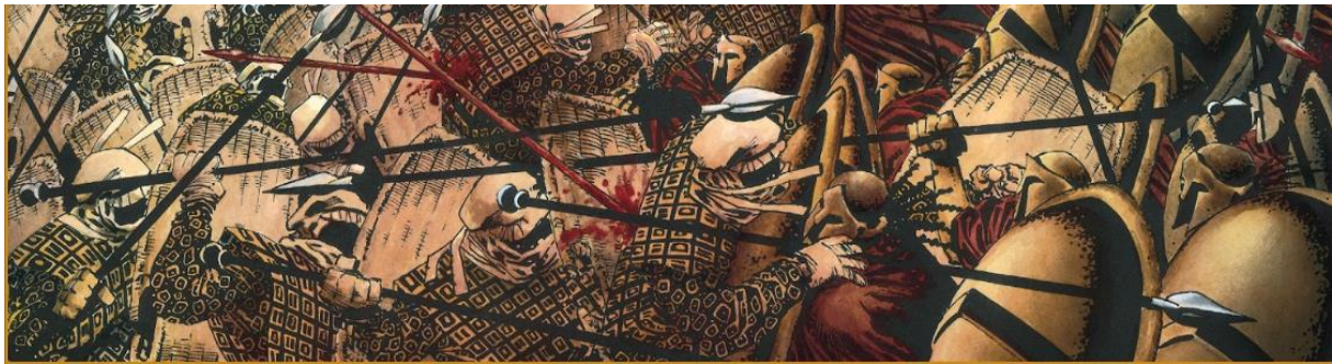
Fig. 2: Bilde av kamper mellom persiske fotsoldater (venstre) og spartanerne (høyre) fra kapittel 4 i Millers verk, hvor begge hærene blir fremstilt med flere detaljer. Den korintiske hjelmen og den greske bokstaven lambda på spartanernes skjold blir deres definerende trekk i både tegneserie og dens filmatiseringen.

Situasjonen i Iran kan ha vært med på å påvirke Millers fremstilling av perserne, hvor terrorangrepene 11 september 2001 bekrefter hans fordommer.