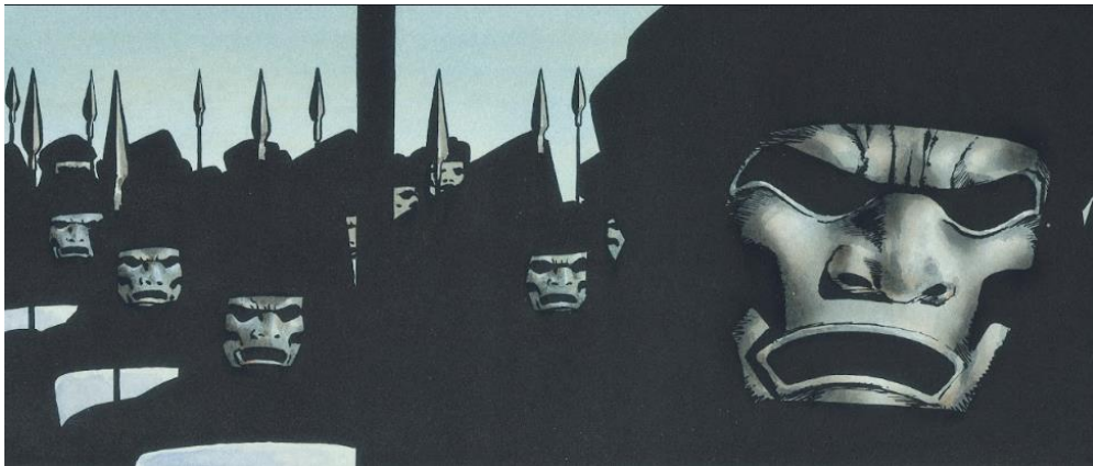
Fig. 4: De udødeliges introduksjon i 300

De udødelige skiller seg ut fra den normale persiske soldat eller bueskytter; Dilios beskriver dem som udyr med øyne mørke som natten, skarpe klør, spisse hoggtenner og uten sjel som har handlet etter persiske kongers mørke vilje i over 500 år, og er Asias dødeligste soldater. Miller fremstiller kun hodene til de udødelig i detalj, hvor de går med en svart hette, en maske laget av metall som skjuler deres ansikt og er bevæpnet med spyd. Resten av kroppen får vi se kun i silhuetter, med deres spyd og en brystplate av metall som det eneste som vi kan identifisere på dem.