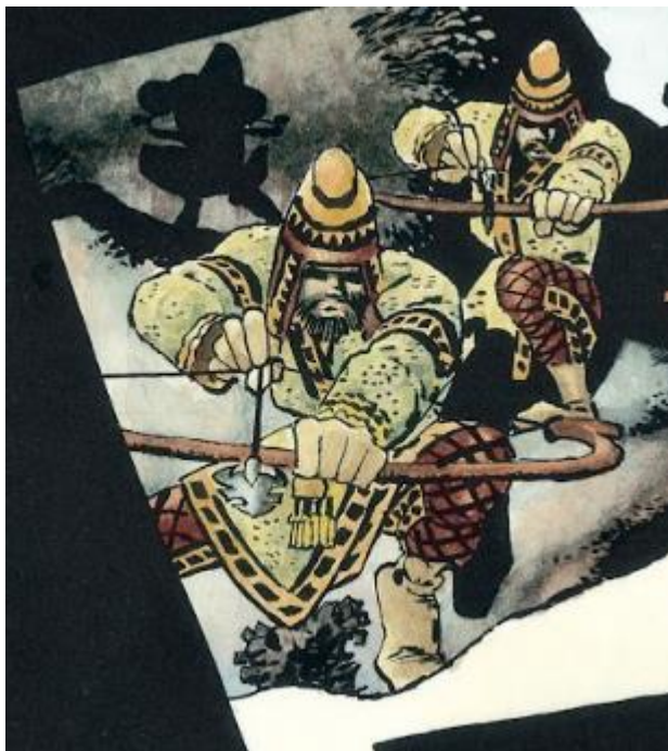
Fig. 3: Persiske bueskyttere slik de blir vist i Frank Millers tegneserie.

I Frank Millers 300 består den persiske hær av tre ulike soldater: Bueskyttere, soldater bevæpnet med spyd og skjold, og den persiske elitestyrken, de udødelige. Soldatene og frontlinjen til den persiske hær er ikledd turban i ulike farger, som regel hvit med spyd og skjold. På overkroppen har de en hvit kåpe med en brunaktig rustning utpå. Enkelte ganger er det kun ett mørke hvor ansiktet er, men i øyeblikk hvor et fåtall soldater fokuseres på, kan en se enkelte ansiktstrekk som øyne, nese, bart og munn. De avdøde soldatene fremstilles mer detaljert enn dem som er levende. 160