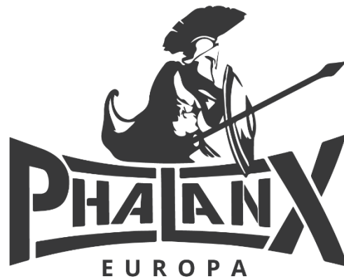
Fig. 8: Phalanx-Europa sin logo

Julie Müller påpeker at når identitærbevegelsen og nyere høyreekstremer bevegelser refererer til Sparta og spartanerne, er det Snyders film 300 som blir referert til, og ikke det historiske Sparta. 180 Det kan også forklare bruken av det greske lambda som bevegelsens symbol, ettersom symbolet er fremstilt på skjoldene til spartanerne både i 300 og The 300 Spartans , samt at symbolet ikke har blitt brukt i høyrepolitisk sammenheng inntil 2012. 181 Dette kommer til synet gjennom nettbutikken Phalanx Europa som tilhører lederen av IBÖ, Martin Sellner. Sellner beskrives som frontfiguren for Europas ytre høyre, hvor han er en sterkt imot muslimske innvandrere til Europa, og hevder at deres eksistens truer den europeiske identiteten og vil føre til at muslimene erstatter den europeiske kulturen. 182 Navnet stammer fra militærformasjonen som var regelmessig brukt av hoplitter under antikken og visstnok benyttet enda mer effektivt av spartanerne. 183