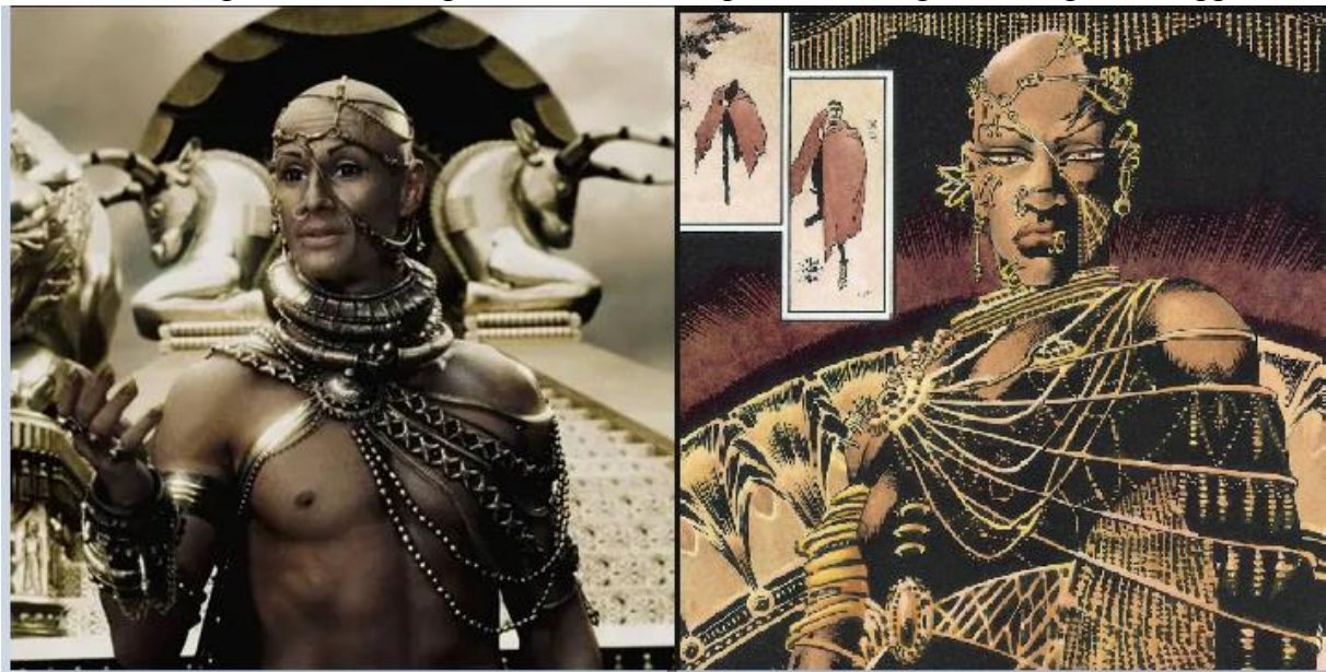
Fig. 6: Xerxes slik han fremstilles i Snyder sin filmatisering (venstre) og Miller sin tegneserie (høyre)

Ved flere anledninger hører vi perserne omtales som ulike dyr; svin, hunder og udyr. De udødelige blir vist i større detalj i filmen, og bærer mange av likhetstrekkene fra filmen. Masken er identisk, og vi ser nå at de bærer beskyttelse i form av lær og metall på deres skuldre og bryst, med svarte klær under rustningen og på beina. Spydene er byttet ut med korte sverd som sitter på deres rygg utenfor kamp. De udødelige blir først nevnt når spartanerne kommer over en gresk landsby som har blitt jevnet med jorden og deres innbyggere drept på inhumane måter, noe som ikke forekommer i tegneserien. De udødelige blir beskrevet med de samme ordene som i tegneserien av Dilios, men en hovedforskjell forekommer i en scene hvor en av de udødelige mister masken under en av kampene. Da ser vi at de udødelige er bokstavelig talt monstre, med grå hud, blodige munn og med hoggtenner.