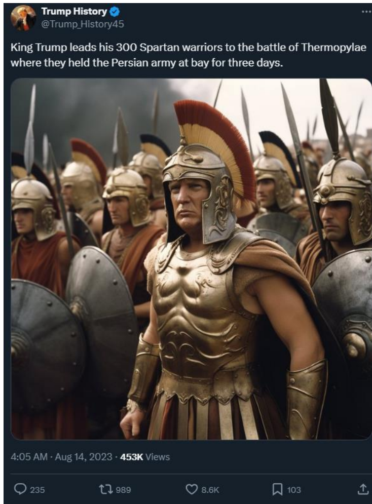
Fig. 11: Post på Twitter som fremstiller Trump i rollen som Leonidas.

Giuliani, blir anklaget for å være medlemmer av en kriminell organisasjon som opererer i Georgia. 216 Samme dag som tiltalene blir gjort offentlig, dukker det opp to poster fra "Trump History", en selverklært parodikonto som med hjelp av kunstig intelligens (KI) lager bilder av Trump hvor han deltar i historiske begivenheter. 217 Teksten i posten går som følger: "King Trump leads his 300 Spartan warriors to the battle of Thermopylae where they held the Persian army at bay for three days." Med teksten ser vi et bilde av Trump hvor han går uvæpnet med en hjelm, brystplate med linjer som viser frem musklene til Trump, med en brun