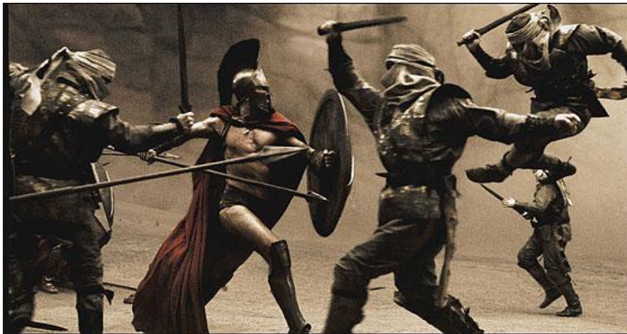
Fig. 5: Kampscene under det første slaget mellom perserne og spartanerne, hvor Kong Leonidas slåss mot persiske soldater etter å ha holdt tilbake den første av persernes storming mot det spartanske forsvaret. Legg merke til hvordan perserne bokstavelig talt hopper mot det spartanske forsvaret.

spartanerne; Perserne skader og dreper hverandre like mye, om ikke mer, enn de utsetter spartanerne for skade. Perserne blir fremstilt som primitive som viser null hensyn til menneskeliv når de kaster seg mot spartanernes spyd, og er en hær hvor kvantiteten er stor, men kvaliteten er nærmest lik null. Dette manglende hensyn til menneskeliv kommer i kontrast med spartanerne menneskesyn under dialogen mellom Xerxes og Leonidas, hvor Xerxes uttaler «I would gladly kill any of my own men for a victory», hvor Leonidas svarer lakonisk «And I would gladly die for any of mine». Tegneserien inneholder en dialog mellom Leonidas og Xerxes, men utsagnene sitert ovenfor forekommer kun i filmatiseringen.