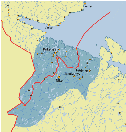
Bildet viser landegrensa mellom Norge og Sovjetunionen med Kirkenes, Vadsø og Vardø for å gi et inntrykk av avstander og geografien i grenseområdet Bjonness, Astrid. Gode naboer . Kart. https://astridbjonness.files.wordpress.com/2014/02/fig7-2.gif

Landegrensa mellom Russland og Norge ble etablert i 1826 og er 197,7 km lang. 42,9 km av grensestrekninga går over land, resten følger vassdragene i Pasvikelva og Grense Jakobselv. 83 Sørfra trekkes grensa langs Pasvikelva helt til Boris Gleb, en liten russisk enklave på 3,6 kvadratkilometer på vestsida av Pasvikelva. 84 Derfra krysser grensa Pasvikelva østover, går over land til Jakobselvs øvre løp, og følger denne elva ut mot havet ved Grense Jakobselv. Storskog grensestasjon var passeringspunktet hvor grensa kunne krysses på land og den norske og sovjetiske grensekommisæren møttes ved forhandlinger. 85 I løpet av 1900-tallet kan