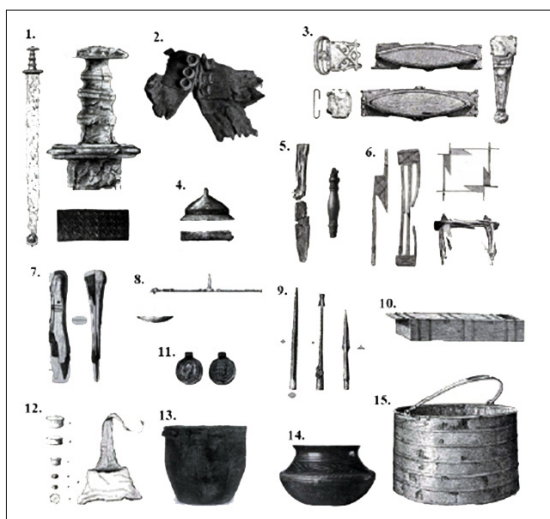
Figur 1. Funn fra Evebøhøvdingens grav. 1: sverd med sølvbeslag; 2: rester av drakt med sølvknapper; 3: belte; 4: skjoldbule; 5: syl; 6: «tankering»; 7: saks; 8: skålvekt; 9: spydspisser; 10: treeske; 11: guldsolidus; 12: blylodd; 13: spannformet leirkar; 14: bulevase; 15: trespann med bronsebeslag.

Gavebytte er en sentral del av modellen, og denne foregår på to nivåer: likt eller ulikt plan. Gavebytte på likt plan, som for eksempel fra en høvding til en annen, var et sosialt spill der målet var å hevde seg ved å gi andre rike gaver og på denne måten knytte til seg allierte. Gavebytte på ulikt nivå var ofte mellom høvdingen og hans menn. Høvdingen ga gaver til menn som ikke kunne gi tilbake en like rik gave, men måtte returnere gaven med en ytelse som for eksempel å kjempe med høvdingen som en del av hærfølge. I hærfølget er det også større hierarkisk åpenhet enn tidligere, der rikdom kommer som følge av innsats i kampsituasjoner. For eksempel sverd, som er et statusvåpen spesielt i symbolsk forstand, kan hærføderer gi til enhver mann i følget sitt som har vist fremragende innsats, og ikke kun basert på avstamning (Evans 1997:34; Kristoffersen 2000:40 f).