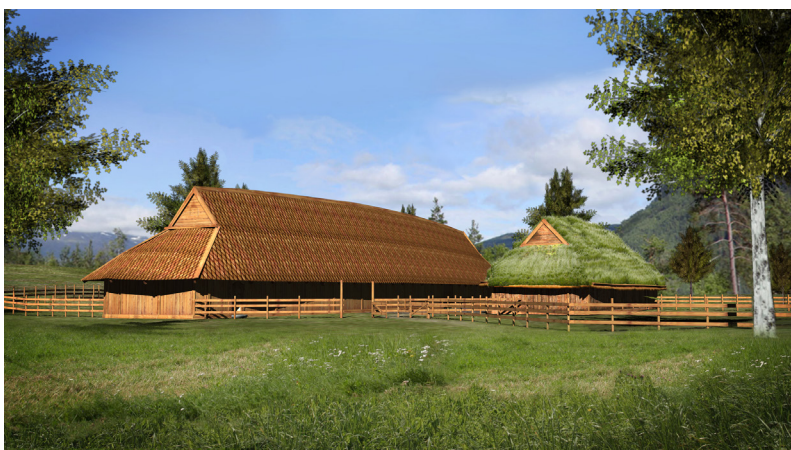
Figur 3. Rekonstruksjon av Eidegården. Grafikk Arkikon.

Det kan selvfølgelig diskuteres om storgården på Eide virkelig tilhørte Eivebøhøvdingen, men mye tyder på nettopp dette. For det første er det en geografisk nærhet mellom grav og gård. Graver i jernalderen ligger gjerne på gården, sjelden mer enn 200 meter fra hverandre (Skre 1998:226). For det andre vitner dateringene av både gård og grav om en nærhet i tid, da begge er daterbare til folkevandringstiden. Dateringene på Eivebøgraven ligger på ca. AD 475-525, ut fra gravgavene (Fjelberg 2008). Den yngste dateringene av hovedbygningen på Eidegårdens andre fase, BETA-200775, dateres til 1530±60 BP (AD 360-480) (Diinhoff 2007:41).