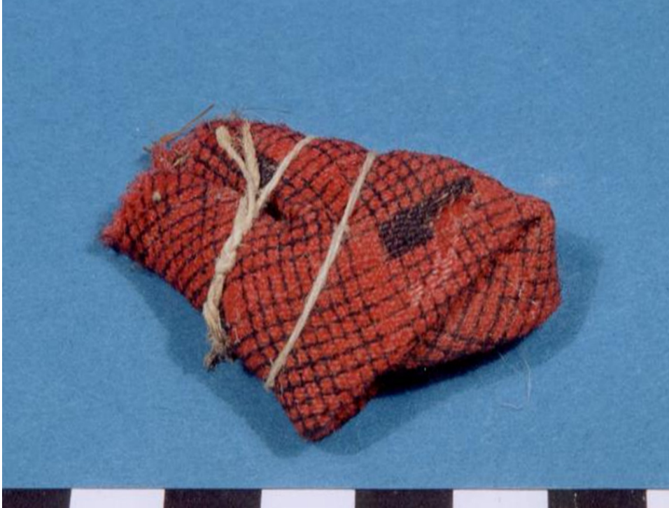
Figur 5. Pjotrepakke fra Borgund stavkirke.

rådet gjelder om sykdommen var forårsaket av underjordiske eller sykdomsvetter, men rådene for hvor man skulle gjøre av dukkene varierer noe. Kirken/kirkegården har imidlertid vært det vanligste. Man kunne også helgardere seg og lage flere dokker og plassere dem ulike steder. Ved å plassere noe fra det syke barnet i dukken eller skrinet, f. eks. negler, hår eller biter av klær, skulle man så lure den døde, sykdomsvetten eller de underjordiske til å tro de hadde fått barnet med seg.