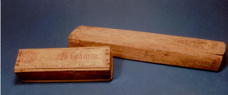
Figur 3. Skyvelokkskrin og skrin med etikettrester fra Borgund stavkirke.

Stivelse". Esken inneholder en del av en avisside, fra en utgave av "The Times" fra 1898. Denne har antagelig vært svøpt rundt fosteret, men ingen beinrester er bevart. Det andre skrinet er en rød fyrstikkeske i tre fra "H. Jölsens tændstikker, Enebak, Norway". På esken er det også to årstall, 1873 og 1876. Esken inneholder et hvitt klede, men dette er så sammenklistret at det ikke har vært mulig å undersøke innholdet uten å ødelegge det. Ved røntgengjennomlysning kan det imidlertid skimtes noe som kan være små beinrester. Selve fyrstikkesken er forøvrig også pakket inn i et hvitt stoffstykke (se fig. 4).