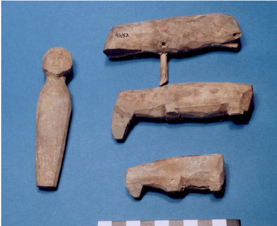
Figur. 6. Menneskefigur og dyrefigurer fra Borgund stavkirke.