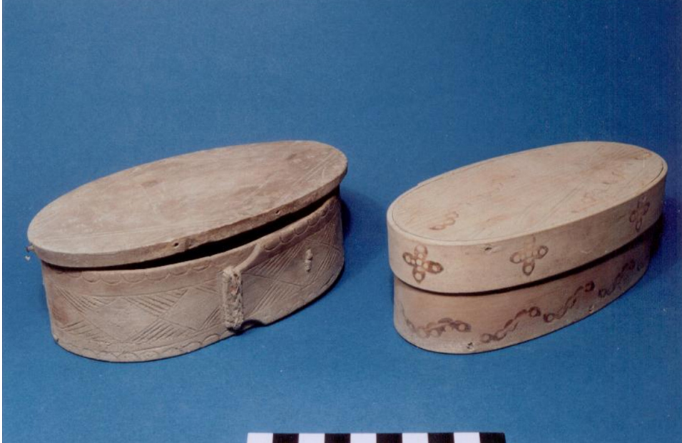
Figur 1. Sveipeskrin fra Borgund stavkirke.