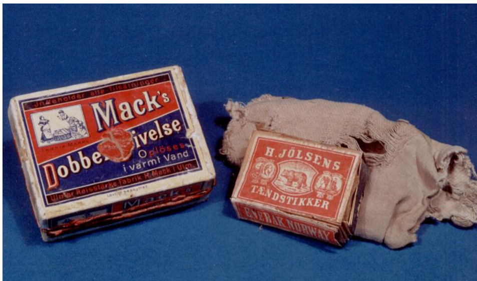
Figur 4. Stivelseseske og fyrstikkeske fra Borgund stavkirke.

kan ha blitt lagt ned under gulvet f.eks. ved å løfte på gulvbord. Det er med andre ord ikke snakk om begravelser i bokstavelig forstand, idet skrinene man finner ikke fysisk er gravd ned i jorden. Jeg har allikevel valgt å benytte betegnelsen fosterbegravelser, all den tid det er snakk om små mennesker som har fått et hvilested i vigslet grunn. Både kirkebygningen og det området kirken stod på har her vært betraktet som vigslet jord (Vibe Müller 1984).