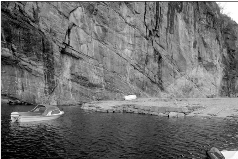
Figur 4. Berget med ristningene heller svakt framover. Båtene er hugget inn i berget rett ovenfor baugen på plastbåten på land. Legg merke til sprekken i berget like vest for denne og den skrå lagdelingen i berget. Det lyse avtrykket etter morenen sees også tydelig til høyre på dette bildet. Bildet er tatt mot nordøst.