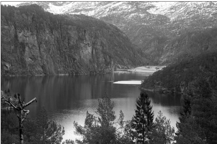
Figur 2. Innerste del av Romarheimsfjorden. Mostraumen og morenen sees tydelig som et lyst oppdyrket område. Bildet er tatt mot nordøst.