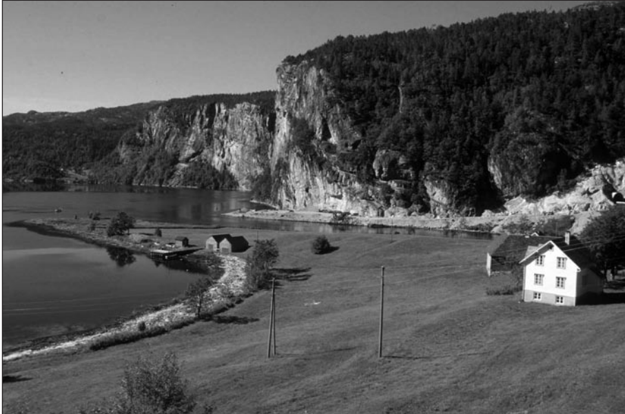
Figur 3. Mostrraum gård. Det bratte hellende berget ligger på andre siden av strømmen. Figurene ligger ved foten av berget i den lille vika nord for utløpet av strømmen. Bildet er tatt mot nordvest.