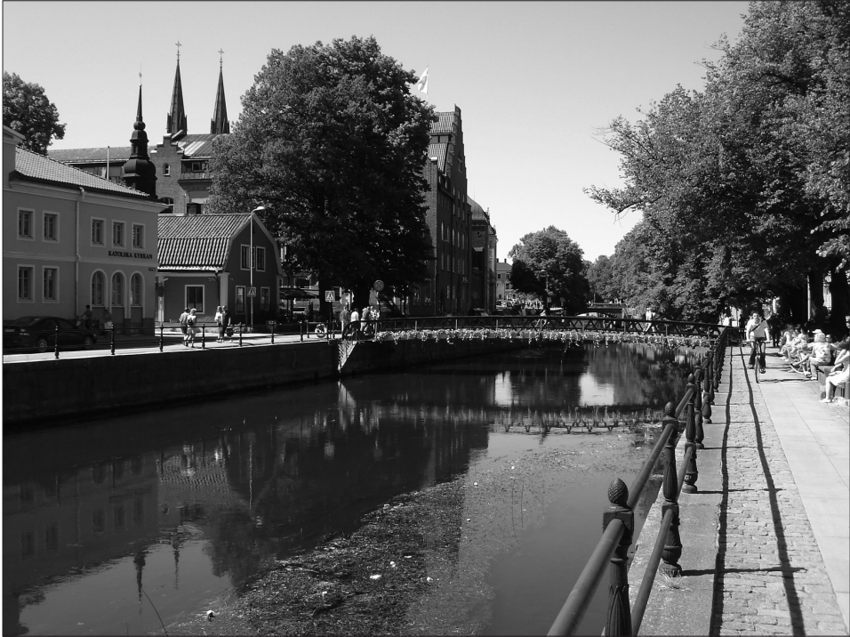
Figur 5. Platsen för Aros, med de två broar som fanns redan under högmedeltiden. Till vänster skymtar domkyrkan på åsen. Till höger är den numera stenskodda strandkant som leder till kungsgårdsområdet och platsen för vapenoffren.