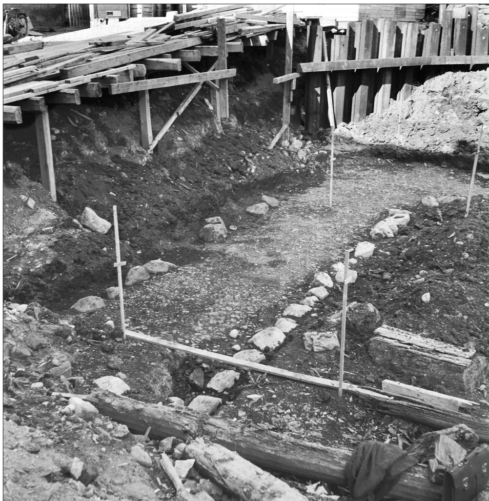
Figur 3. Processionsvägen från tidig medeltid. Den löpte troligen från en bro vid ån, mot landsvägen till Gamla Uppsala. Denna del undersöktes på 1970-talet.

även om timrade byggnader förekom (Anund 2001). Resvirkes- och stavverkshus har märkligt nog i princip aldrig funnits i Uppsala. Den stora andelen skiftesverkshus är intressant. I andra nordiska städer i samma biologiska zon var timringekniken helt dominerande redan från tidigmedeltid (Anund 2001). Då virkestillgången var likartad bör skillnaderna vara kulturella. Väggar i skiftesverk i järnålderns långhus var troligen vanliga i Svealand. Den urbana kulturen kanske endast innebar övergången till enfunktionshus med takbärande väggar – inte ändring av väggkonstruktionen i sig. I stadens centrum vid ån fanns ett unikt inslag, en manifest stensatt gata (fig. 3). Den kan härröra från stadens anläggande och kan ha löpt från ån norrut mot Gamla Uppsala – i så fall bör den ha varit en markering gjord av centralmakten (Beronius Jörpeland et al. 2000:3 ff; Carlsson et al. 2000). En liknande lämning med liknade förmodad funktion har påträffats i Linköping (Feldt & Tagesson 1997:149). I stadsgårdarna användes man keramikkarl av det kvardröjande äldre inhemska svartgodset men även yngre svartgods,