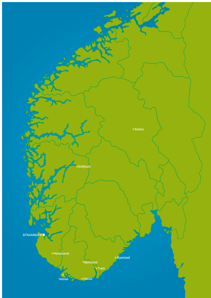
Figur 5 Sjelegaver overført lokalt