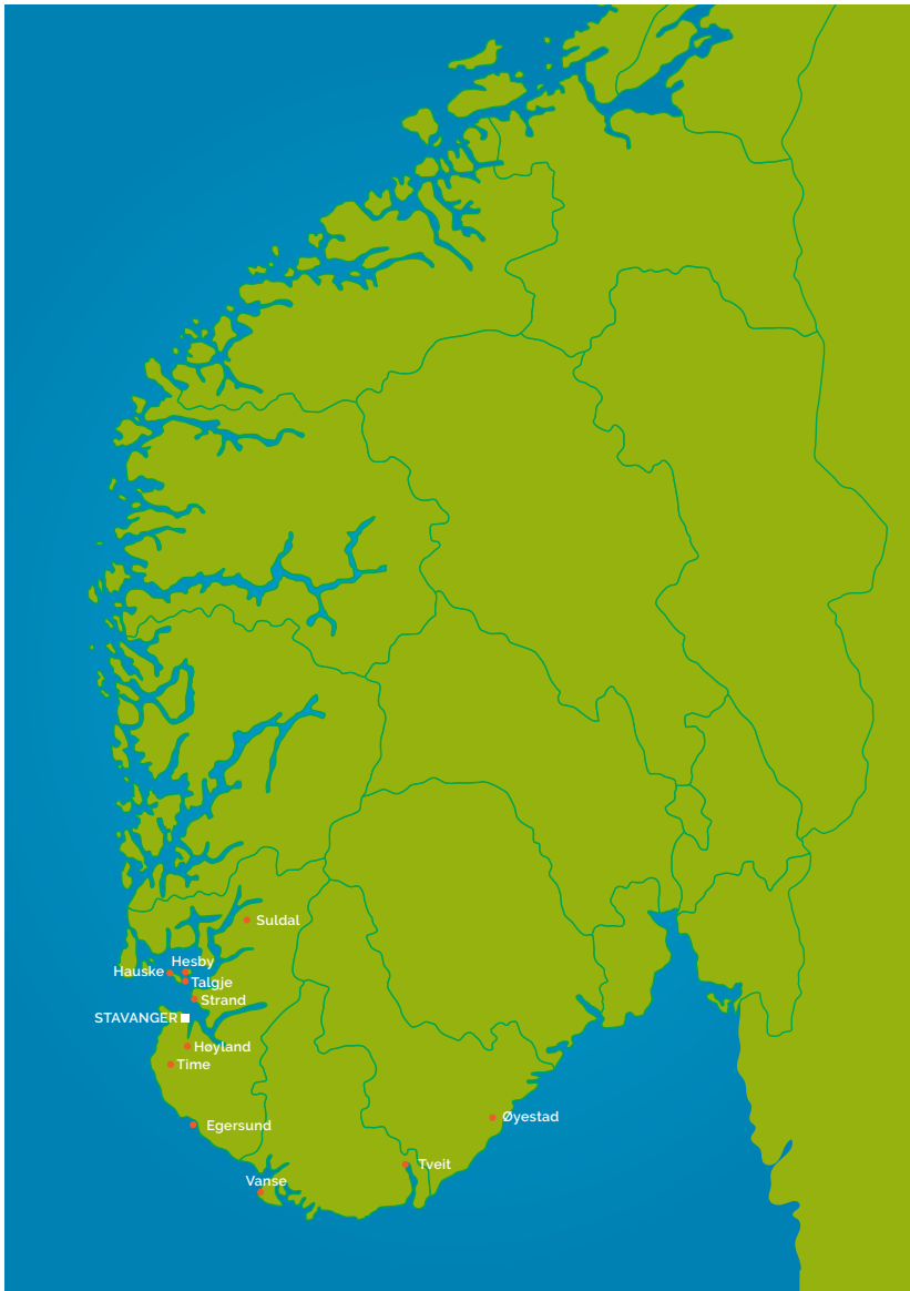
Figur 2 Lokale steder med prest og kannik

ha dekket nærområdene rundt. Samtidig ser vi at de indre områdene, både i Agderfylkene og i Valdres og Hallingdal, ikke er merket av på denne illustrasjonen. Kildene viste ikke noen kombinasjoner av prest og kannik i de områdene.