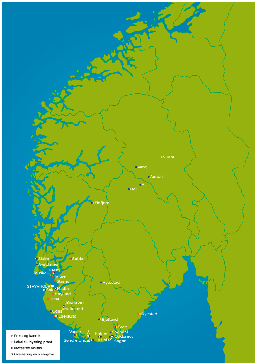
Figur 6 Sammenstilling av resultater

Figuren viser en konsentrasjon av funn langs kysten og i området rundt bispesetet. Kombinasjonen av prest og kannik ses tettest i omkringliggende områder til Stavanger. Nærheten til bispesetet og muligheter for å skjøtte begge stillinger kan ha spilt inn. Vi