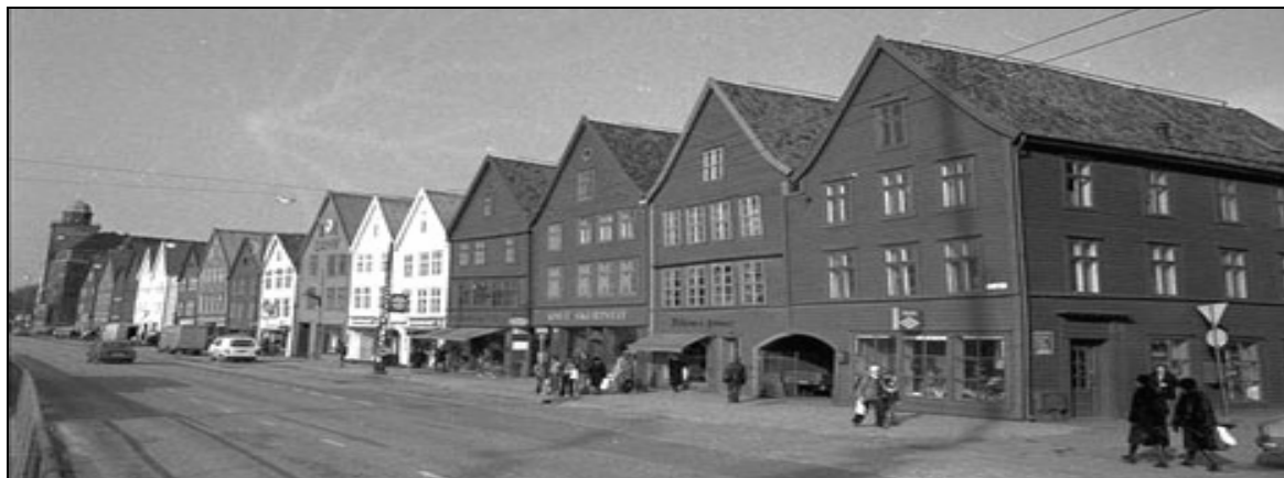
Bryggen ca. 1995(?) sett fra den nybygde Gullskoen til venstre (nord) til den opprinnelige Holmedalen fra 1702 til høyre (sør). Nikolaykirkealmenning helt til høyre. "Enhjørningen" sees under urskiven midt i husrekken.