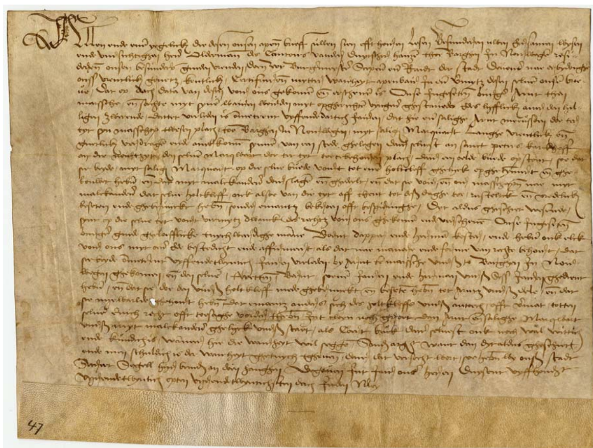
DN VI nr 692, sendt fra Deventer 24. mai 1524. Utlånt fra Manuskriptsamlingene UBB

http://home.wxs.nl/~amels098/index.html ,