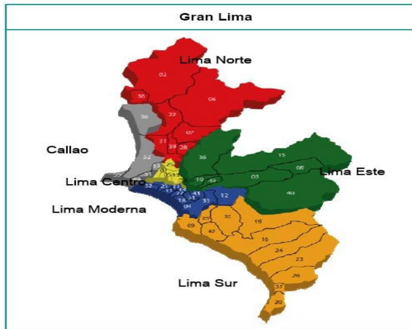
Los conos de Lima Metropolitana: 134

distritos en los Conos, Sur, Norte y Este, que a fines de los años 80 constituyeron el 42% de las viviendas de Lima y albergaron al 47% de su población, (De Soto, 2005) Se hace hincapié que la terminología Conos está siendo reemplazada por Lima Norte, Lima Sur etc. Sin embargo, ya que este trabajo se inició en el año 2000, se usará la terminología de Conos.