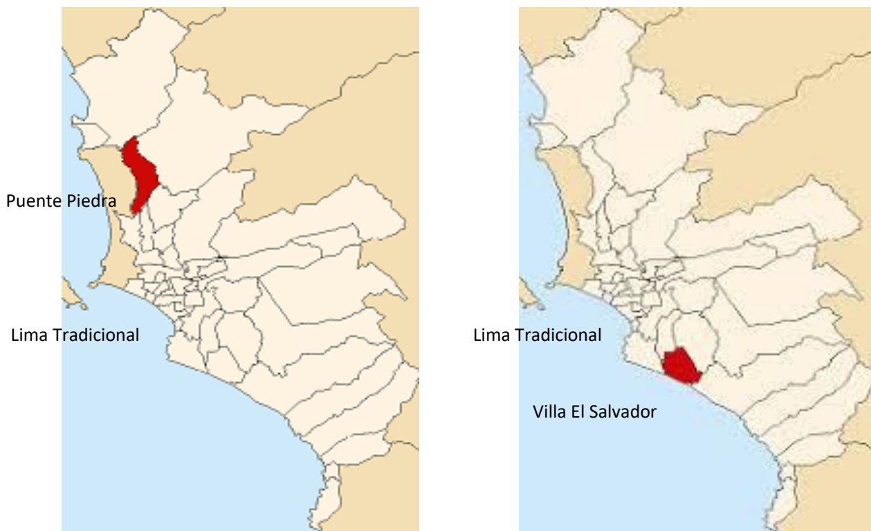
Mapas N° 1 y 2: Ubicación del Distrito de Puente Piedra y el Distrito de Villa el Salvador

Por cuanto es necesario situar y precisar el espacio geográfico en donde se ubican ambos comedores populares. Las informantes entrevistadas en el año 2000, pertenecen al comedor popular Juana Alarco situado en el distrito de Villa el Salvador, ubicado en el Cono 11 Sur de Lima. Villa El Salvador (VES) tiene una extensión 35,460 kilómetros cuadrados y según los datos de INEI en 2002 VES contaba con 388,588 habitantes. 12