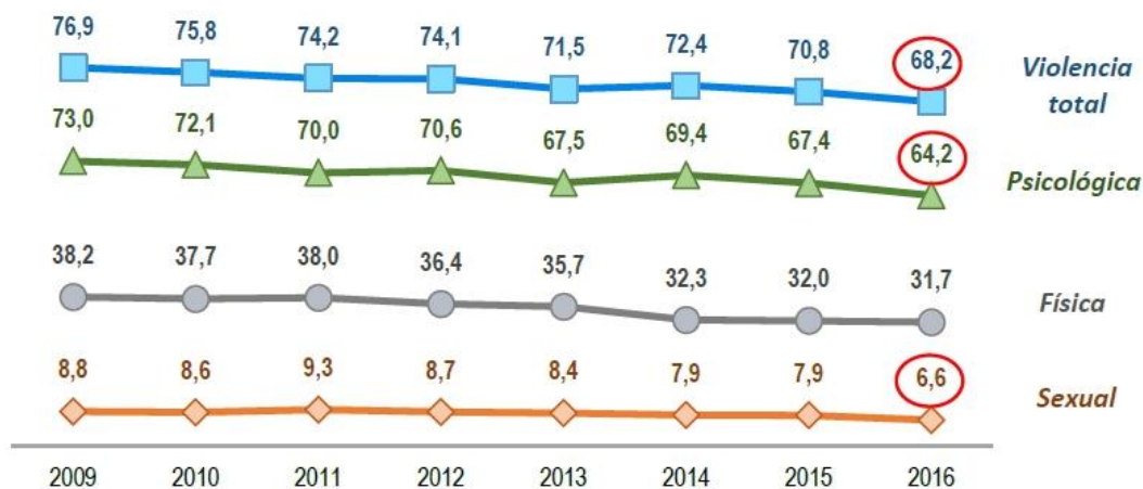
PERÚ: VIOLENCIA CONTRA LA MUJER, EJERCIDA ALGUNA VEZ POR EL ESPOSO O COMPAÑERO, 2009 - 2016 (Porcentaje)

Fuente: Instituto Nacional de Estadística e Informática - Encuesta Demográfica y de Salud Familiar.