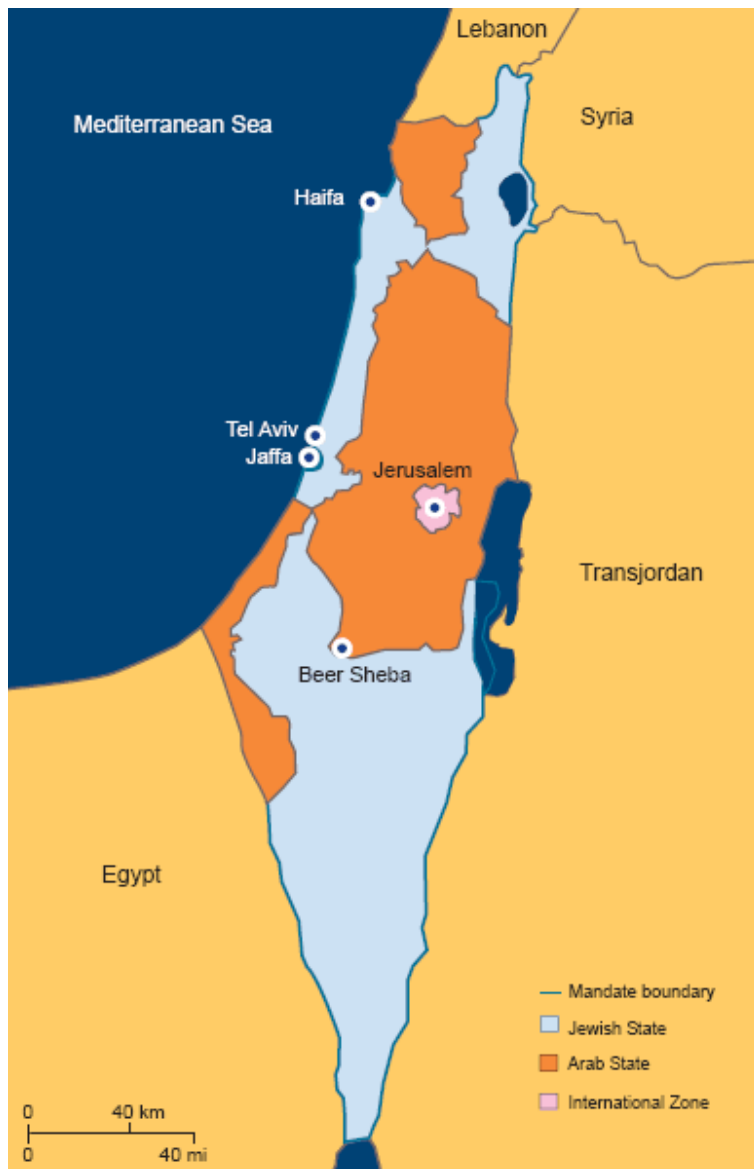
Kart 1: FN's delingsplan for Palestina, 1947.