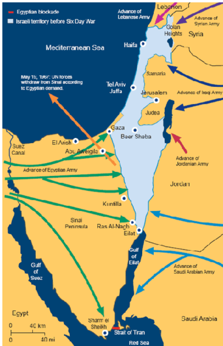
Kart 2: Kartet viser, blant annet, grensen mellom Israel og Jordan før Seksdagerskrigen, 5.-10.juni 1967.