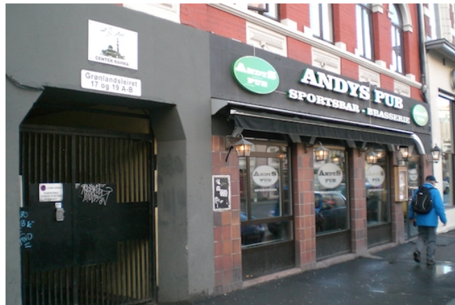
Moské vegg i vegg med en norsk fotballpub i engelsk stil på Grønlandsleiret

Men jeg selv besøker ikke deres utesteder. Altså, det finnes her i Motzfeldtgata disse kafeene der det kun sitter menn. De er vanligvis veldig godt besøkt. Jeg går ikke inn der, men passerer dem bare og kikker, «Aha». Og de [muslimene] besøker ikke serveringssteder med alkoholskjenking, det vil si at det finnes en streng atskillelse. Det er påfallende. På gaten har du et helt annet bilde og i kneipene har du plutselig dette skillet mellom disse to gruppene. 579