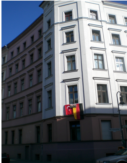
Pyntet vindu med tyrkisk og tysk flagg