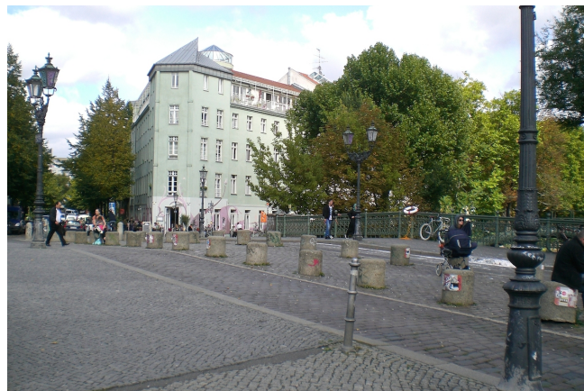
Admiralbrücke på dagtid

[...] jeg unngår Admiralbrücke. [...] Om sommeren er Admiralbrücke grusom, dag og natt okkupert av bare unge folk. Altså, man får ikke roen der og det synes jeg ikke er helt riktig. Altså, en litt mer respektfull omgang med hverandre ville ha vært på sin plass. Det er ingen jungel, det bor mennesker der, mennesker jobber der [...] Altså som Kreuzberger ville jeg for eksempel ikke ha satt meg ned der. Nei, det hadde ikke vært aktuelt. [ler] Jeg ville heller gått på en kneipe på et gatehjørne, på Jodelkeller eller på Trinkteufel. Der ville jeg ha funnet meg mye bedre til rette enn der blant de altfor åpenbare turistene. 355