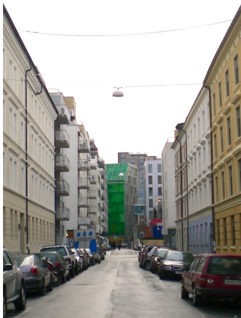
Blikk fra Grønlandsleiret mot Schweigaards gate og Bjørvika