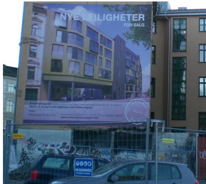
Annonsering for et kommende nybygg på Grønlandsleiret