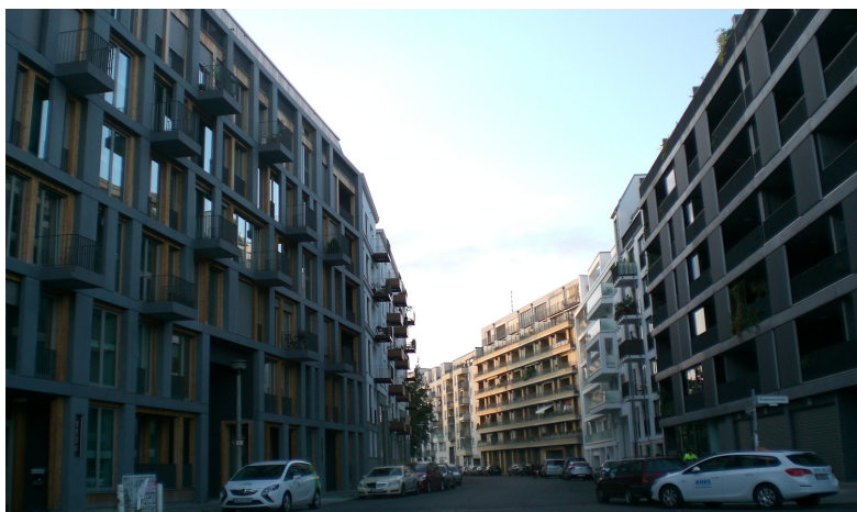
Nytt og påkostet boligkvartal i Dresdener Straße