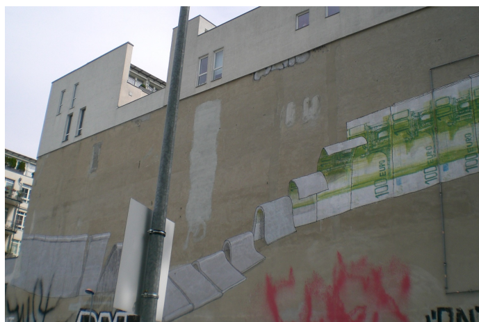
Veggmaleri som viser til en (ny) mur i Kreuzberg SO36