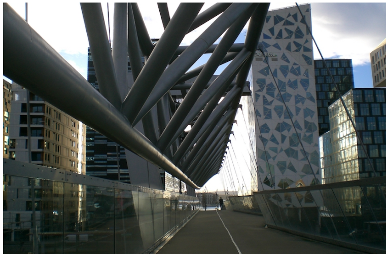
«Akrobaten» fotgjengerbro som forbinder Grønland (og Tøyen) med Bjørvika