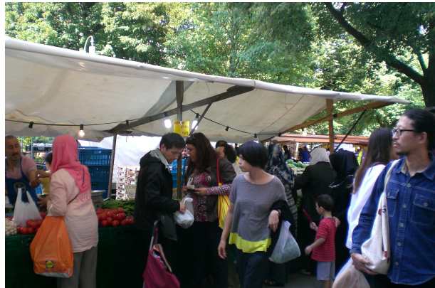
Markedet ved Maybach Ufer

First of all I love the fruit vegetable market at the Maybach Ufer. It is really amazing. I have this personal thing that every Friday, I am going to the market, because it is pretty funny. There are people of different ages and it is like being in a bar sometimes. Because you go, walk up and down and instead of looking at the vegetables [...] If you go there, on one square meter it is like on a United Nations conference. [ler] There are people from everywhere. Which I think is a nice thing, this is something I really, really like. 303