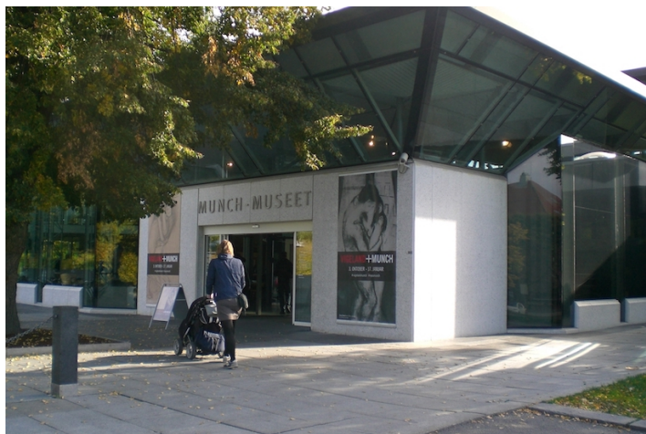
Munchmuseet på Tøyen

av områdene, 725 andre igjen gir inntrykk av å ha en mer nøytral eller sågar positiv innstilling til vedtaket.