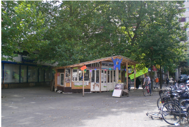
Geçekondu'en til Kotti & Co