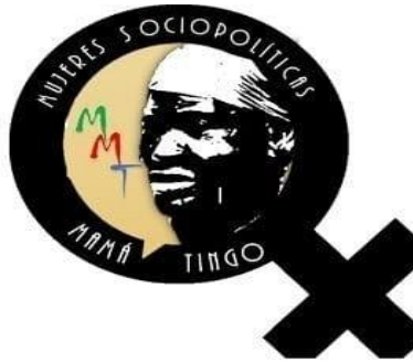
Figura 2: Logo de la organización Las Mujeres Sociopolíticas Mamá Tingó , ubicado en Santo