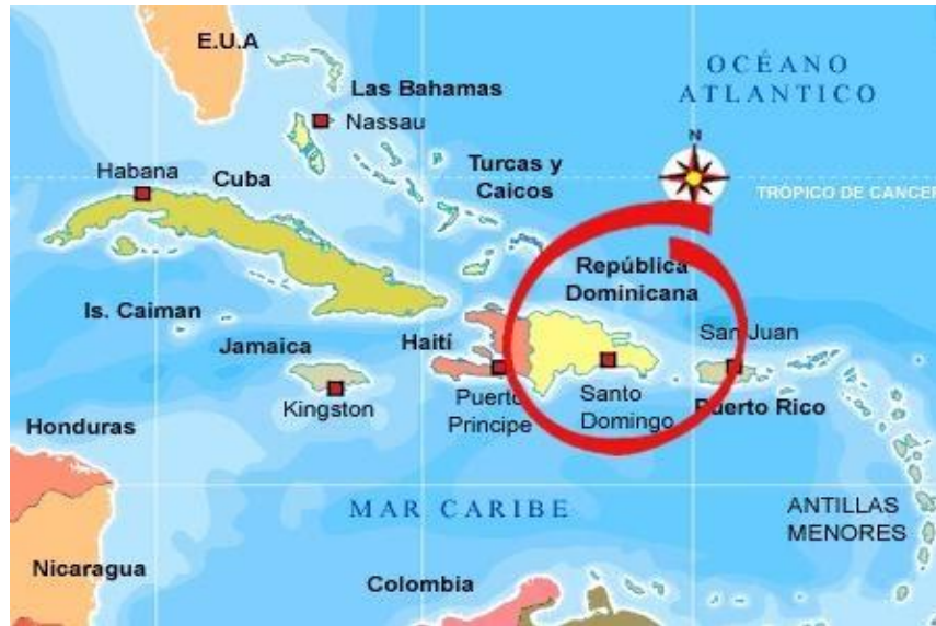
Mapa 1: Del Mar Caribeño, con la localización de República Dominicana.