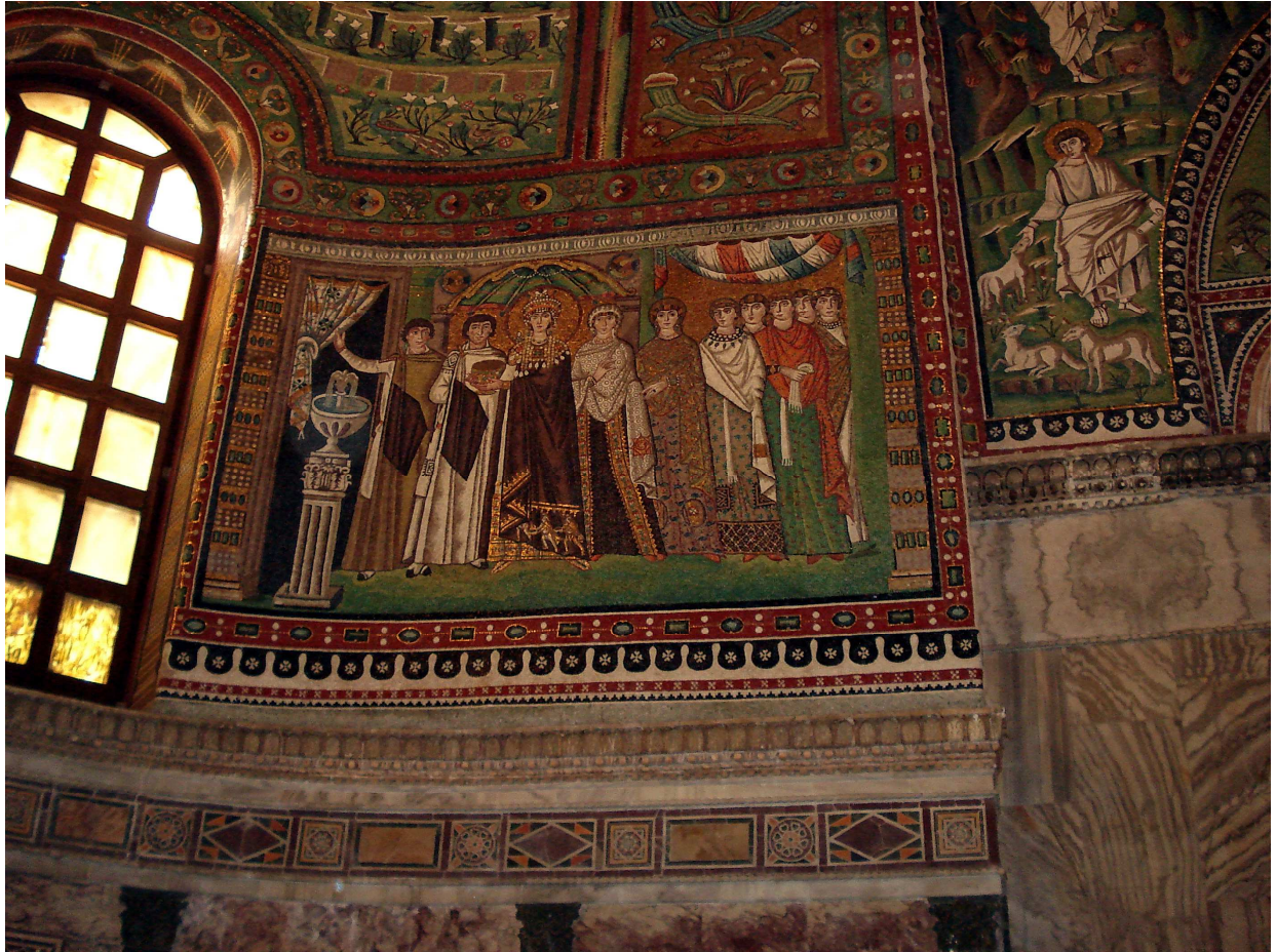
Mosaikk av keiserinne Teodora frå alteret i basilikaen San Vitale, Ravenna. (Foto: Eirik Fære 2006).