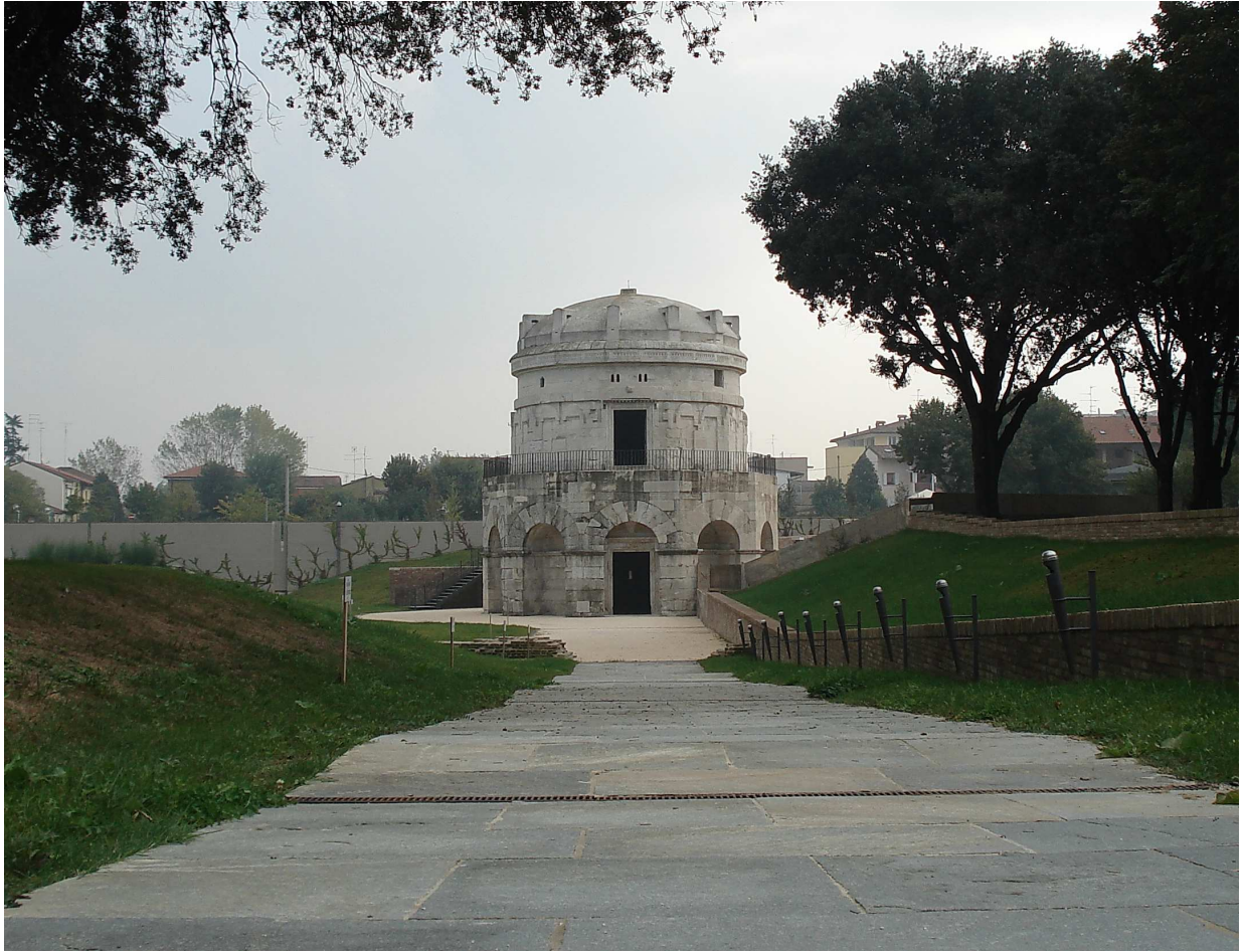
Austgotarkongen Teoderik den store (488-526) sitt mausoleum i Ravenna. (Foto: Eirik Fære 2006).