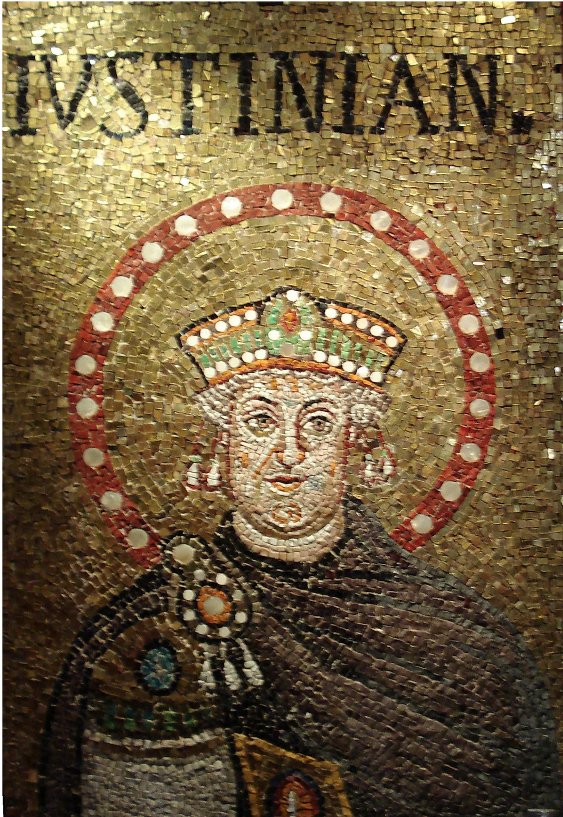
Mosaikk av Justinian i basilikaen St. Apollinare Nuovo i Ravenna. Opprinneleg av Teoderik, men ”tilpassa” til å vere Justinian på 540-talet etter austromarane sin inntreden i Ravenna. (Foto: Eirik Fære 2006).