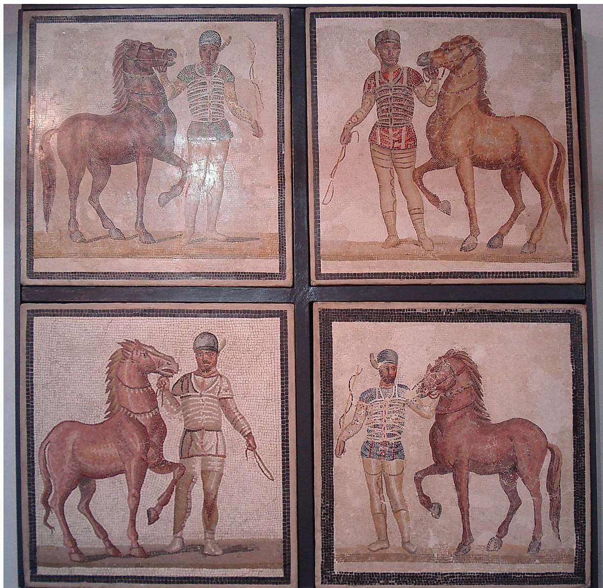
Mosaikk frå 200-talet av dei fire fraksjonane ved Sirkus Maksimus i Roma. Opprinneleg frå Villa Baccano utanfor Roma. Utstilt ved Museo Nazionale Romano i Roma. (Foto: Eirik Fære 2006).