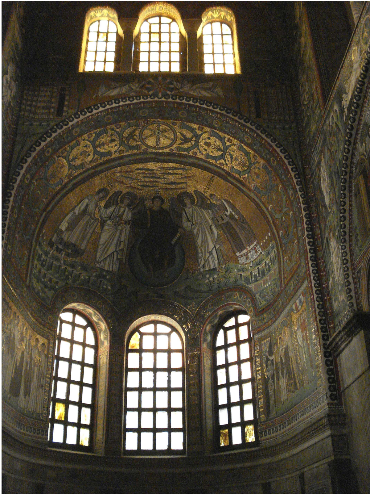
Alteret i basilikaen San Vitale i Ravenna, Italia. Mosaikk av Justinian og Teodora på kvar side. Eit sjeldent godt bevart eksempel på bysantinsk kunst på sitt beste. (Foto: Eirik Fære. 2006).