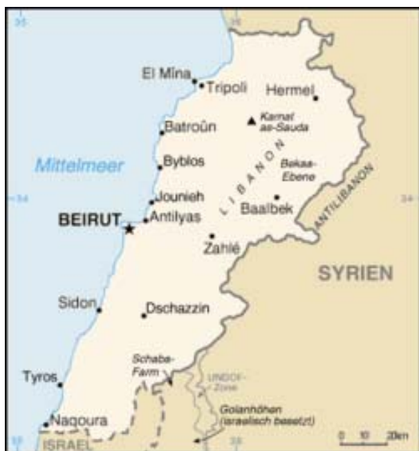
Kart over Libanon