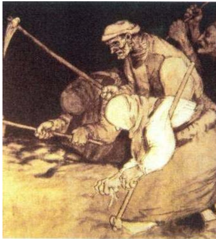
Slavene av fysisk arbeid. Tegning av Alfonso R. Castelao, for tidsskriftet Nos .

Men de stemte overveldende for statuttene om selvstyre; 28. juni 1936. 68