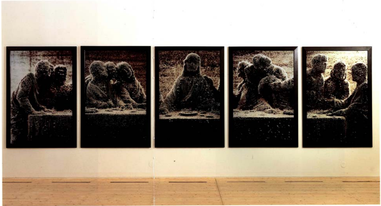
Black Supper I, II, III, IV, V, 1990