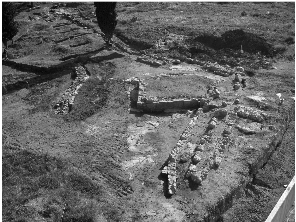
Εικόνα 2: Νότιος τομέας της ανασκαφής.