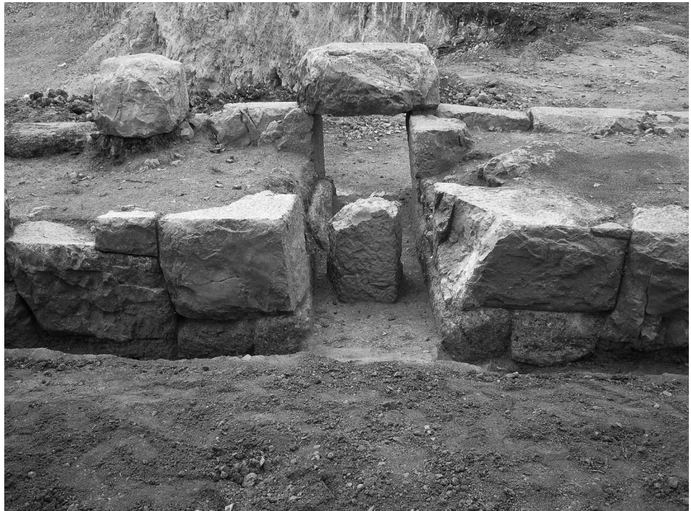
Εικόνα 6: Βόρειος τομέας της ανασκαφής. Ο αγωγός απορροής όμβριων υδάτων.