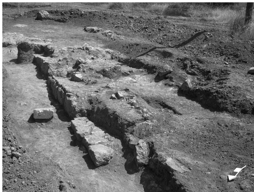
Εικόνα 4: Νότιος τομέας της ανασκαφής. Πρώτη κατασκευαστική φάση του τείχους.