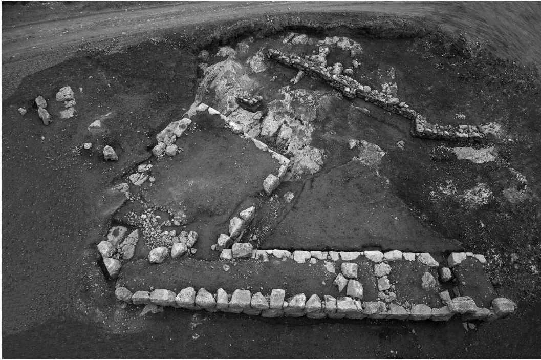
Εικόνα 5: Βόρειος τομέας της ανασκαφής.