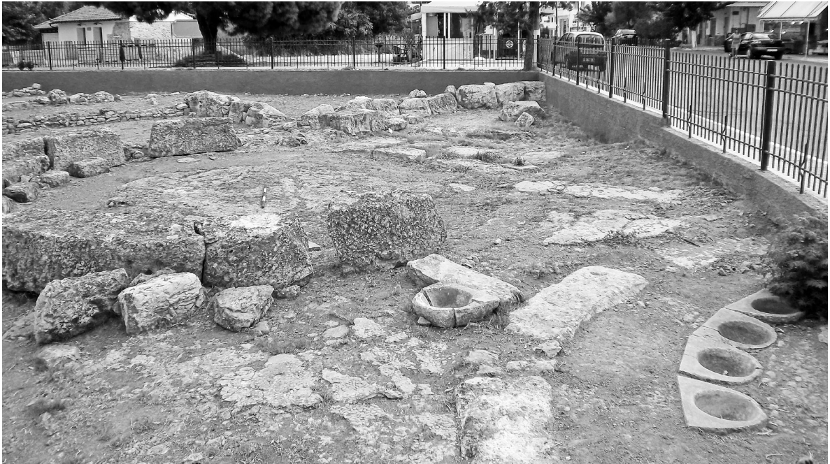
Εικόνα 4: Άποψη των κυκλικών αιθουσών των λουτρών του λιμανιού της Αρχαίας Ερέτριας από ΝΔ.