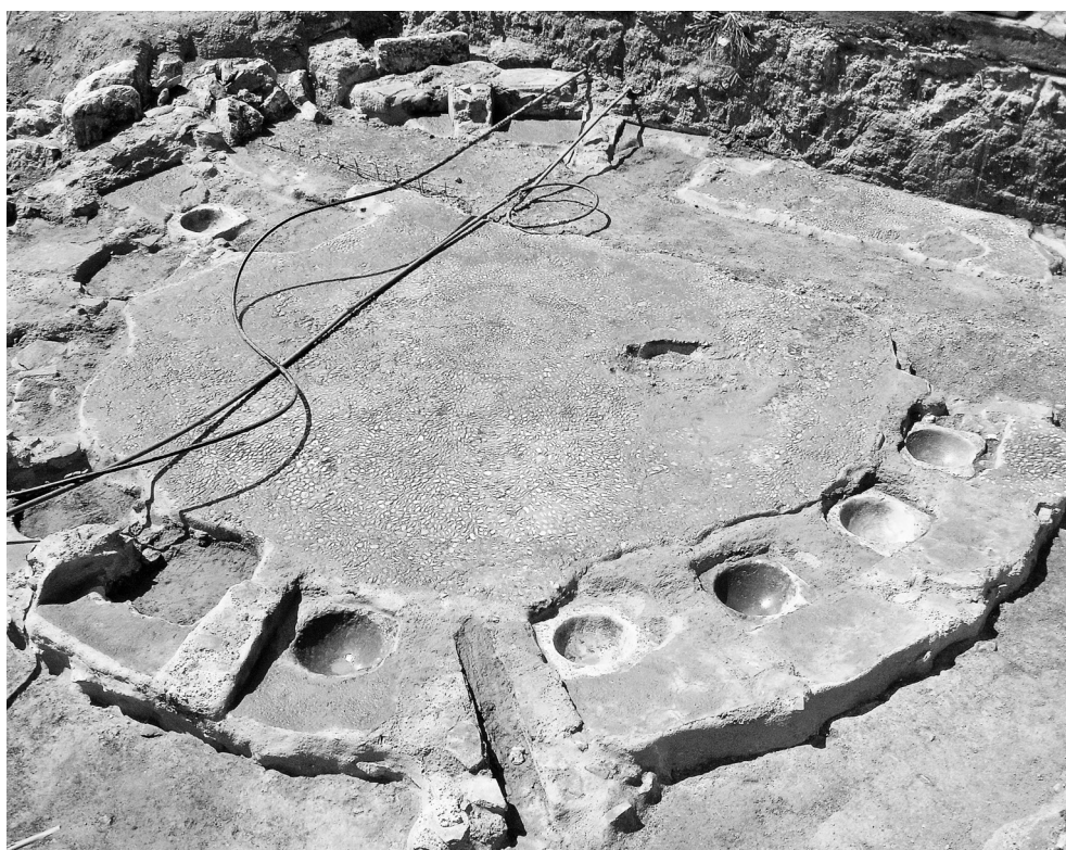
Εικόνα 3: Αποψη του κυκλικού λουτρού της Αγοράς της Αρχαίας Ερέτριας από ΒΑ.