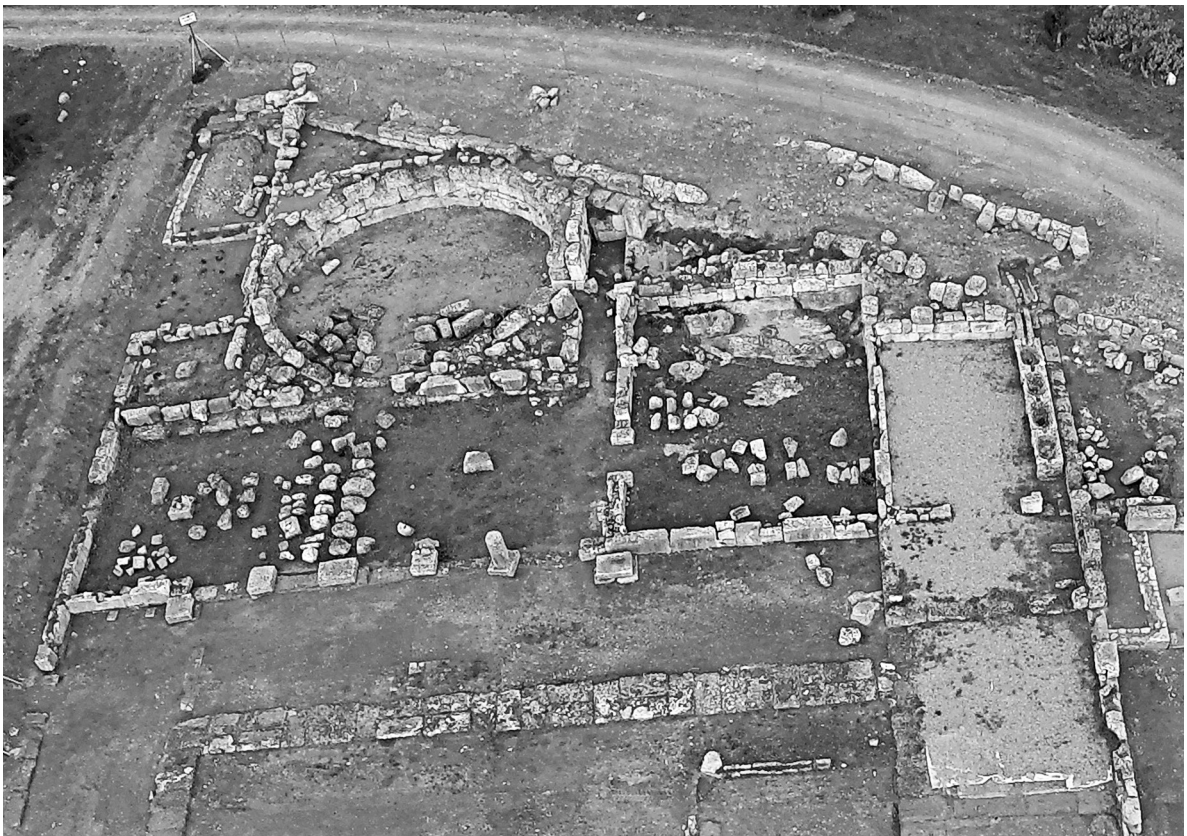
Εικόνα 5: Άποψη του Άνω Γυμνασίου της Αρχαίας Ερέτριας από Ν. Διακρίνεται η κυκλική αίθουσα εφίδρωσης στα δυτικά, και το δωμάτιο του λουτρού στα ανατολικά.