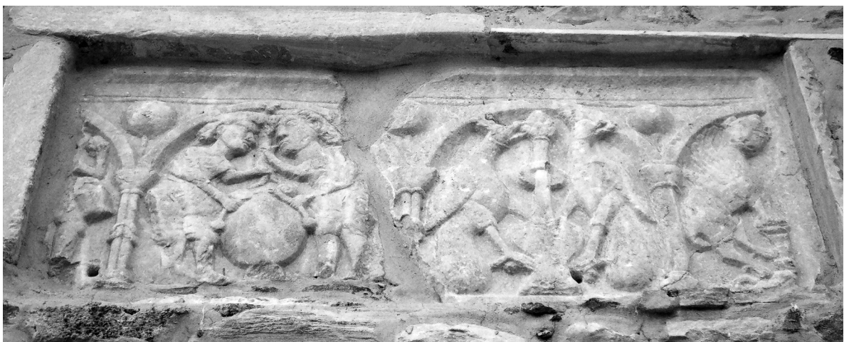
Εικόνα 5: Ανάγλυφη πλάκα ψευδοσαρκοφάγου στον Άγιο Γεώργιο στο Ωρολόγι.