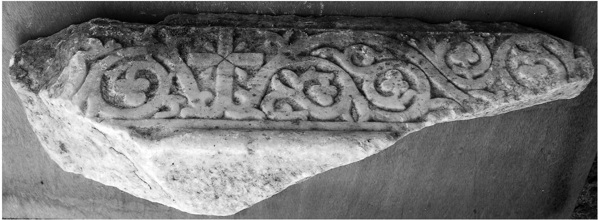
Εικόνα 3: Κοσμήτης θυρώματος από την Αγία Τριάδα Κριεζώτη (23η ΕΒΑ).