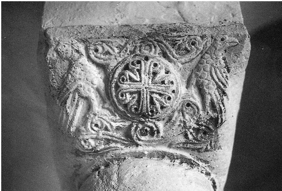
Εικόνα 4: Κιονόκρανο στον Άγιο Ανδρέα στους Παραμερίτες (Μαμαλούκος 1994, πίν. 104, εικ. 16).