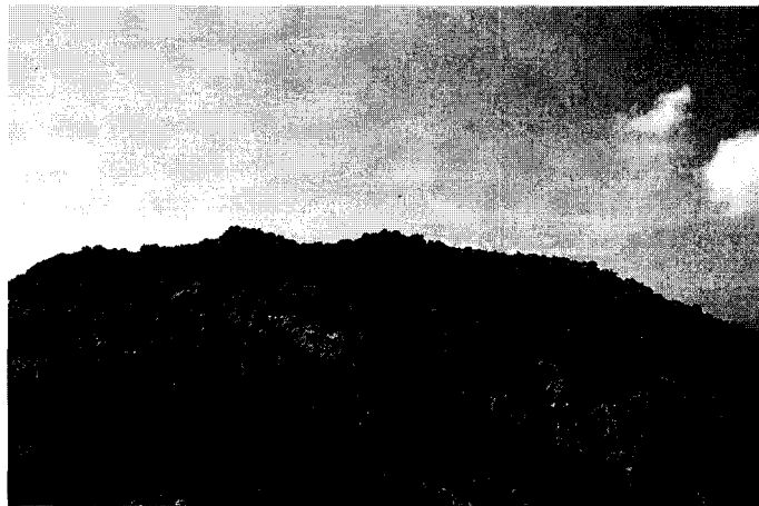
Εικ. 4. Η βόρεια πλευρά του οχυρού.