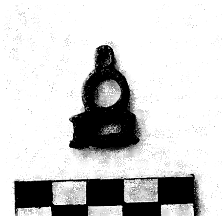
Εικ. 5. Η χάλκινη πόρπη του 6ου-7ου αι. που βρέθηκε στο οχυρό.