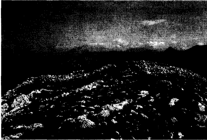
Εικ. 3. Η νότια πλευρά του οχυρού.