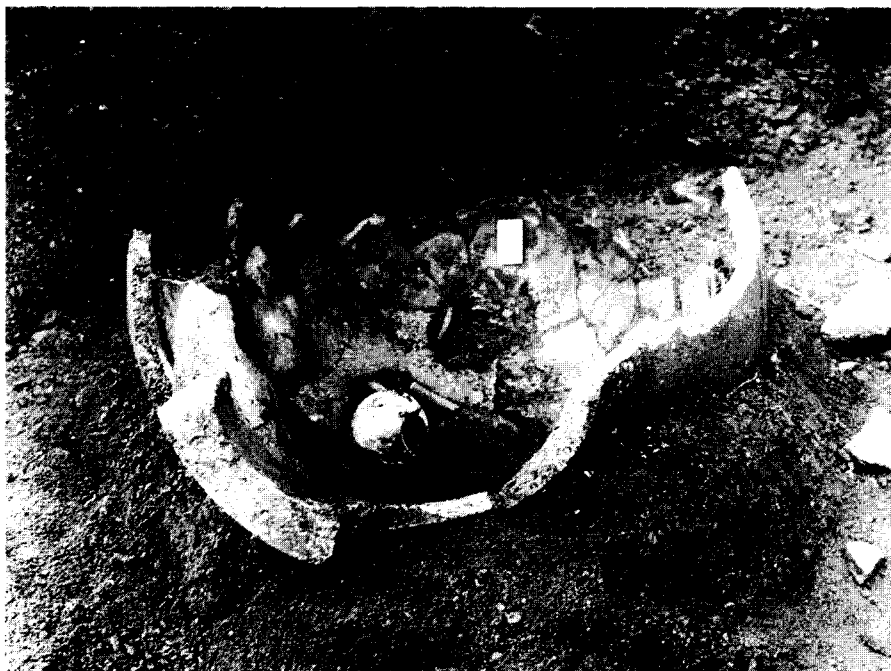
Εικ. 3. Σκεπαστό Καλαβρύτων, θέση Ξερόκαμπος. Ο πίθος Ι κατά χώραν. (Φωτογρ. ΣΤ' ΕΠΚΑ.)