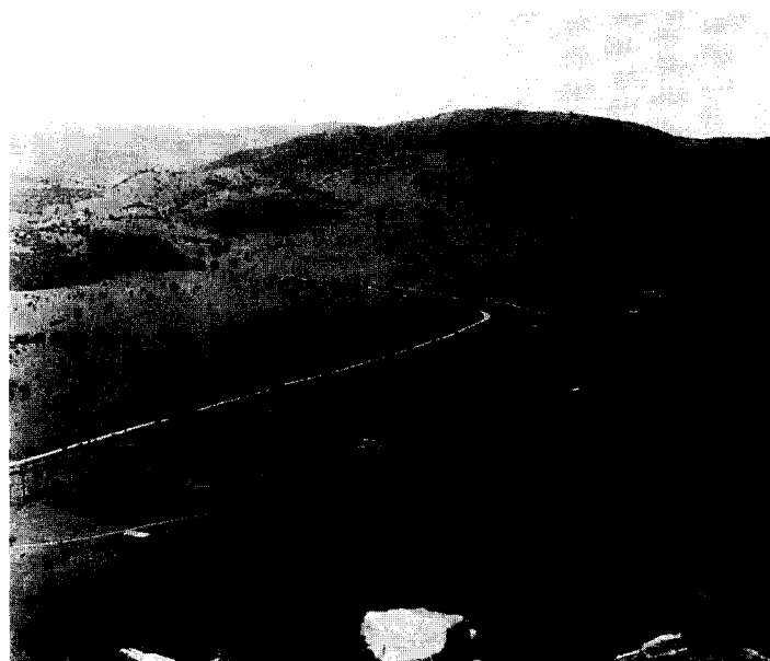
Εικ. 2. Κούτελη Καλαβρύτων, θέση Κάστρο. Το στενό πέρασμα προς τα Καλάβρυτα, μεταξύ Κάστρου Κούτελης και λόφου Ράϊκου.