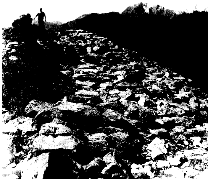
Εικ. 1. Κούτελη Καλαβρύτων, θέση Κάστρο. Τμήμα του οχυρωμένου πλατώματος.