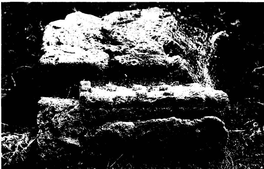
Εικ. 4. Γκρεμουλιάς Καλαβρύτων. Πλίνθος γείσου με προμόχθους και σταγόνες.