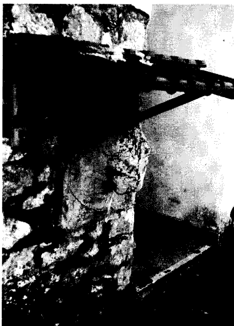
Εικ. 1. Ο λέων της Αραχαμίτας.