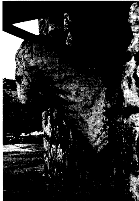
Εικ. 4. Ο λέων της Αραγαμίτας, αριστε- ρή πλευρά.