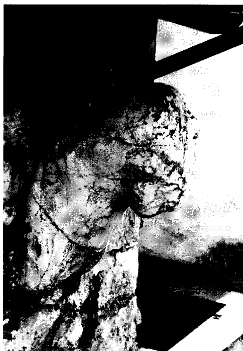
Εικ. 2. Ο λέων της Αραχαμίτας, δεξιά πλευρά.