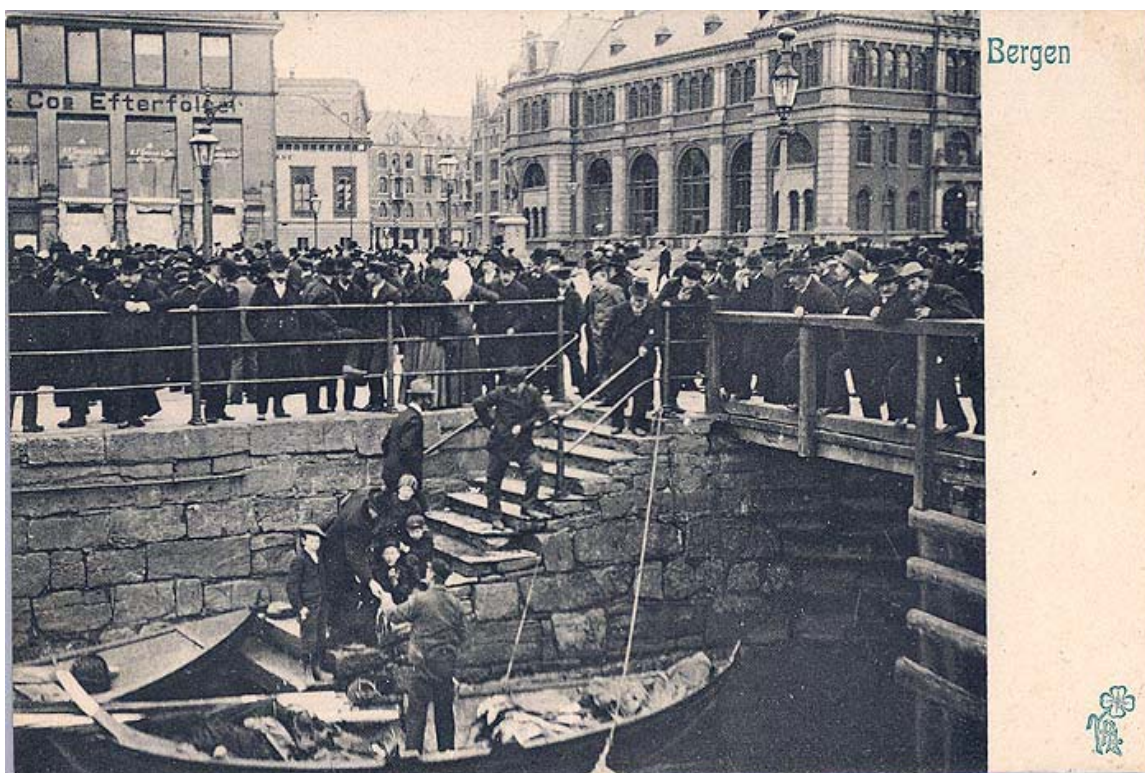
Torget i Bergen. I bakgrunnen Børsbygningen der opprørsparagrafane først vart opplesne. Postkort henta frå www.hist.uib.no/postkort

utvida rekka si meir og meir og fekk til slutt reinska plassen for folk. Med det var også første akt i potetkrigen slutt. Med unntak av at politifullmektigen forslo armen i fallet, vart ingen skada. I alt 11 personar vart likevel arresterte denne laurdagskvelden for oppløp og motstand mot politiet.