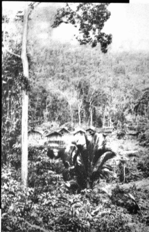
Hovedlandsbyen til Baktaman

dem, og som indeholder alle de impulser, som ligger til grund for deres tænkning". Det er selvfølgelig til en vis grad illusionisk, men det bliver dog en påfaldende reel kontrast til de Melle-møstlige folk, som er så dybt forankret i en historie, som de selv har opfattelser af. Og de er omgivet af hellige skrifter, som ligger der og skal fortolkes.