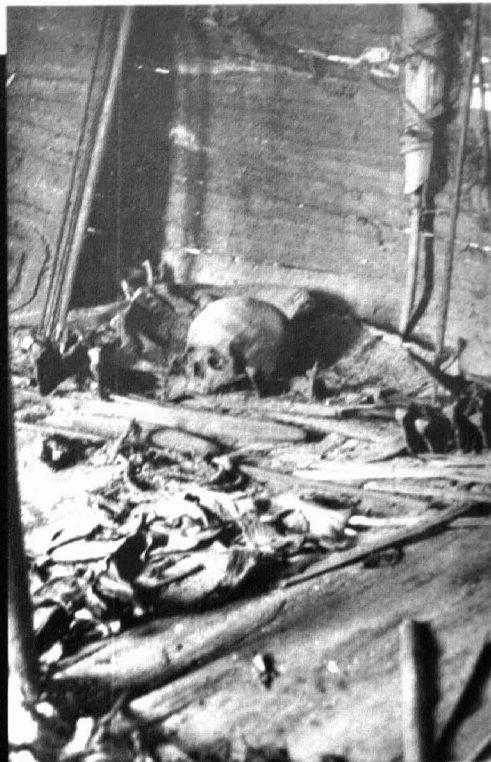
Den centrale helligdom i templet, forfaderens kranie

definerede dig som person. Men jeg opfattede dog nok til at forstå, at jeg ikke skulle spise offentligt, når det ikke var i selskab med en gruppe mænd, som også spiste offentligt. Der var en, som prøvede at afsløre mig. Han gik på jagt i skoven og kom tilbage med forskellige dyr. Han ville finde ud af, hvem jeg var, og hvad jeg var. Så han gav mig forskellige ting. Frøer, fisk, forskellige fugle, pungdyr og så videre. Og det var en slags eksperiment fra hans side, så noget af det, han gav mig, var for at teste mig: spiser han det? ...Og det havde jeg en anelse om, så jeg takkede ham høfligt for det, han kom med, og lagde det til side og viste aldrig, om jeg spiste det. Nogle måneder efter opdagede jeg, at det havde været for-