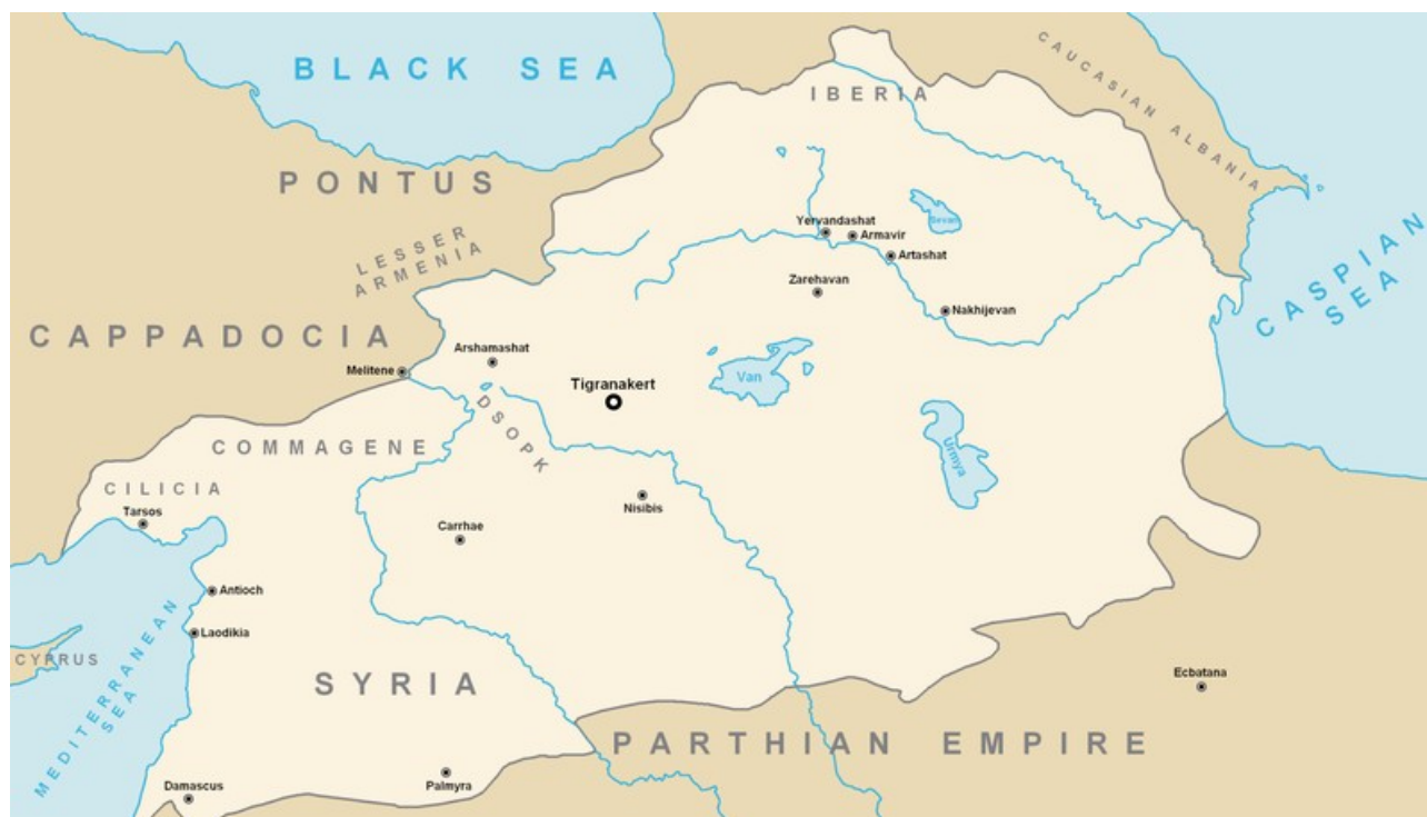
(Kart 3: Dette kartet er henta frå http://en.wikipedia.org/wiki/File:Armenian_Empire.png den 1.5.2011, og viser Tigranes den Store sitt rike på sitt største rett før den tredje Mithridatiske krigen.)

guvernøren blir jaga ut av provinsen, og Bithynia går inn i Mithridates sitt imperium (App. Mith. 71). Den første generalen som romarane sender austover for å nedkjempe Mithridates er Lucius Lucullus. Mithridates står først i mot kringsetjinga av byen Cyzicus, men må så trekke seg tilbake. I 71 fvt blir det på ny eit slag mellom Lucullus og Mithridates. Romarane vinn og Mithridates må søke tilflukt hjå Tigranes (App. Mith. 81-82).