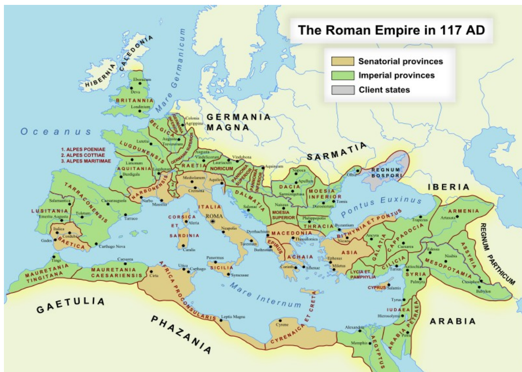
(Kart 6: Kartet er henta frå http://en.wikipedia.org/wiki/File:RomanEmpire_117.svg den 10.03.2011, og viser Romarriketb etter Trajan sitt felttog mot partarane.)

Dei romerske erobringane blir forlatta av Trajan sin etterfølgar Hadrian og dei nye provinsane Armenia, Mesopotamia og muligens Assyria blir overgitt. Partarane gjer også opprør og kastar ut den romerskstøtta kongen Parthamaspates (Dio 68.33.1-2). Kart 6 viser korleis det romerske imperiet såg ut rett før Trajan døydde, med dei nye austlege provinsane, Armenia, Mesopotamia og Assyria, teikna inn.