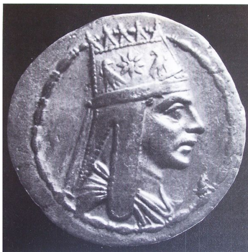
(Bilete 4: Mynt som viser den armenske kongen Tigranes den Store. Dette biletet er henta frå http://en.wikipedia.org/wiki/File:Tigran_Mets.jpg den 1.5.2011.)

Tigranes blitt mistruisk mot Mithridates på grunn av at sonen hans (sjå seinare) hadde gått til opprør mot han, og Tigranes mistenkte Mithradates, som var bestefaren hans, for å stå bak opprøret (Dio. 36. 50). Pompeius følger etter han til han kjem til Kolkhis, der han gir opp jakta. Han slår kongane av Hiberia og Albania før han set kurs mot Armenia for å hemne at Tigranes hadde vore alliert med Mithridates (App. Mith. 103-104).