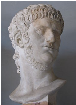
(Bilete 9: Byste av den romerske keisaren Nero. Dette biletet er henta frå http://en.wikipedia.org/wiki/File:Nero_1.JPG den 30.4.2011.)

Partarkongen Vologaesus på si side ville no ha tilbake makta over Armenia for å kunne setje inn broren sin, Tiridates (bilete 8), som konge der. Han går inn i Armenia og både Artaxata og Tigranocerta overgir seg utan kamp, men ein hard vinter og dårlege forsyningslinjer får partarane til å trekke seg ut igjen. Då kjem Radamistus attende og oppførte seg i følge Tacitus veldig valdelig i eit forsøk på å straffe det armenske folket, som Tacitus seier at Radamistus såg på som svikarar ettersom dei hadde gått til opprør mot han. Denne oppførselen får armenarane til å reagere. Dei kringset borga Radamistus er i, og tvingar han til å forlate landet (Tac. Ann. 12. 50-51). Sjølv om Tacitus ikkje seier det eksplisitt, kan eg med ganske god sikkerheit seie at Tiridates etter dette har blir gjort til konge over Armenia, fordi Tacitus nemner ein episode der kona til Radamistus blir forlatt og såra av ektemannen før ho blir frakta til hovudstaden Artaxata der Tiridates tek imot henne (Tac. Ann. 12.51).