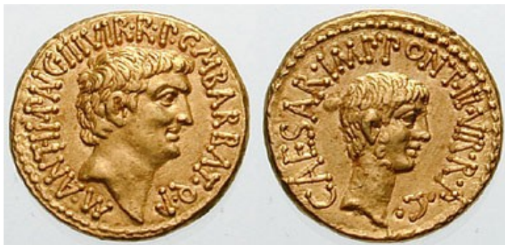
(Bilete 6: Dette biletet viser ein romersk mynt med Marcus Antonius til venstre og Octavianus til høgre. Biletet er henta frå http://en.wikipedia.org/wiki/File:Antony_with_Octavian_aureus.jpg den 1.5.2011.)

Marcus Antonius sin mislukka invasjon av Partarriket er den neste hendinga eg skal gå inn på. Her spelar igjen armenarkongen Artavasdes ei viktig rolle i konflikten mellom Romarriket og Partarriket, og dei vala han tek i denne konflikta får mykje å seie både for Armenia si framtid og ikkje minst for han sjølv.