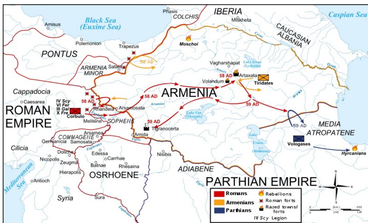
(Kart 4: Kartet er henta frå http://commons.wikimedia.org/wiki/File:Roman-Parthian_War_58-60.svg den 10.03.2011. Det viser rørslene til dei ulike hæraene i dei første åra av krigen.)

få regjere over det kongeriket han hadde blitt gitt eller at han skulle få det i gåve av nokon andre enn han. Corbulo på si side ville gjenvinne romersk ære ved å erobre dei områda som generalane Lucius Lucullus og Pompeius Magnus hadde erobra under den tredje mithridatiske krigen. Tacitus seier også at armenarane hadde bedt begge sider om hjelp mot den andre parten, og at dette kunne ha påverka stormaktene til å gå til krig mot kvarandre (Tac. Ann. 13.34). Det kjem ikkje klart fram av Tacitus her om romarane har kome med eit tilbod til Tiridates om at han kan bli konge over Armenia dersom han reiser til Roma og blir krona av keisaren, men ein kan annta det på grunn av Vologaeses sitt utsegn som vi ser over.