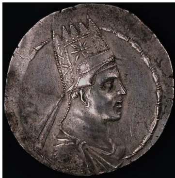
(Bilete 7: Mynt av den armenske kongen Artavasdes som er henta frå http://en.wikipedia.org/wiki/File:ArtavasdesII.jpg den 1.5.2011.)

Plutark seier så at i år 36 fvt samlar Antonius så hæren sin i Armenia, der han blir møtt av fleire allierte kongar, med Artavasdes av Armenia som den største bidragsytaren. Han stiller nemleg med 6000 kavaleristar og 7000 infanteristar, medan romarane kan stille med 60 000 infanteristar og 10 000 kavaleristar. Til saman kan dei andre allierte kongane dersom ein ikkje tel med armenarane stille med 30 000 troppar, fordelt mellom kavaleristyrkar og lette infanteristar (Plut. Ant. 37.3). I forkant av denne samlinga har i følge Dio Cassius Antonius sin general Canidius erobra Hiberia og Albania (Dio 49.24), noko som gjer at den romerske hæren kan angripe Media utan å vere redde for å bli angripne i flanken av desse to kongerika. Plutark seier i staden at Canidius i tillegg til å ha erobra Albania og Hiberia erobra han også Armenia (Plut. Ant. 34.6) og slik kan han ha fått dei tilbake i allianse med romarane.