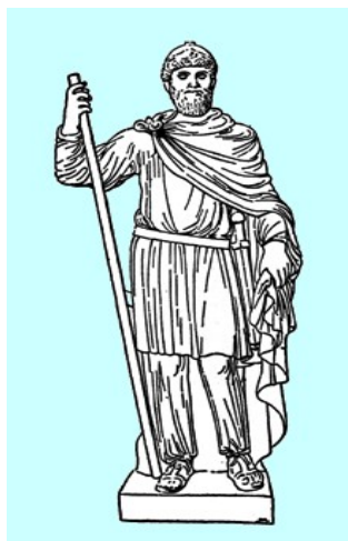
(Bilete 8: Teikning av ei statue av den armenske kongen Tiridates. Dette biletet er henta frå http://en.wikipedia.org/wiki/File:Trdatrome.gif den 30.4.2011.)

Når dette er gjort går far og son saman for å angripe Armenia. Mithridates søker tilflukt hjå ein romersk garnison, men blir kringsat av Radamistus og romarane må trekke seg ut. Når Mithridates og Radamistus møtest lurar Radamistus igjen onkelen sin og får han drept (Tac. Ann. 12.45-47). Den romerske guvernøren i Syria kallar inn til eit møte for å drøfte det som har skjedd i Armenia, og kva romarane burde gjere med det. Dei blir i følge Tacitus einige om at det ikkje var bryet verdt å ta tilbake Armenia, og at Radamistus ville bli hata av forbrytelsen han har gjort. Men dei sender likevel ein beskjed til Pharasmanes om at han må trekke seg ut av Armenia og at han må kalle tilbake sonen sin også (Tac. Ann. 11.48).