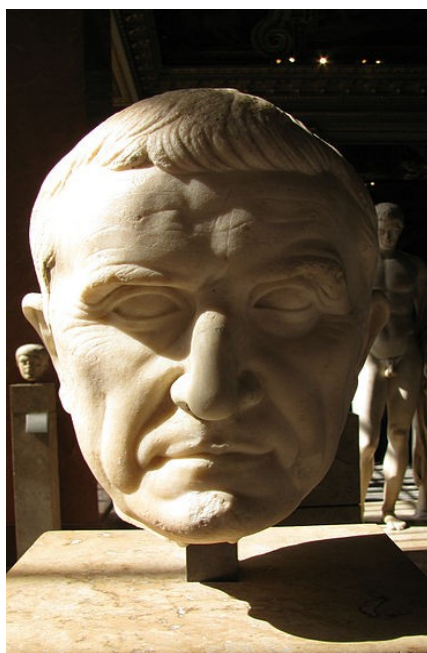
(Bilete 5: Byste av den romerske statsmannen og triumvire Marcus Crassus. Dette biletet er henta frå http://en.wikipedia.org/wiki/File:Marcus_Licinius_Crassus_Louvre.jpg den 1.5.2011.)

No skal eg sjå litt vidare på ei hending som først og fremst vedkjem relasjonen mellom Romarriket og Partarriket, nemleg den romerske triumviren Crassus (bilete 5) sin mislukka invasjon av Partarriket i år 54 fvt. Eg har valt å fokusere litt på denne hendinga sjølv om Armenia ikkje spelar ei særlig stor rolle i konflikten, litt for å vise korleis fredsavtalen etter den tredje Mithridatiske krigen påvirka armenarkongen Artavasdes (bilete 7), etterfølgaren til Tigranes, men mest for å kunne gi fleire forklaringar til det som skjer seinare under Marcus Antonius si innblanding i Midtausten og Kaukasus.