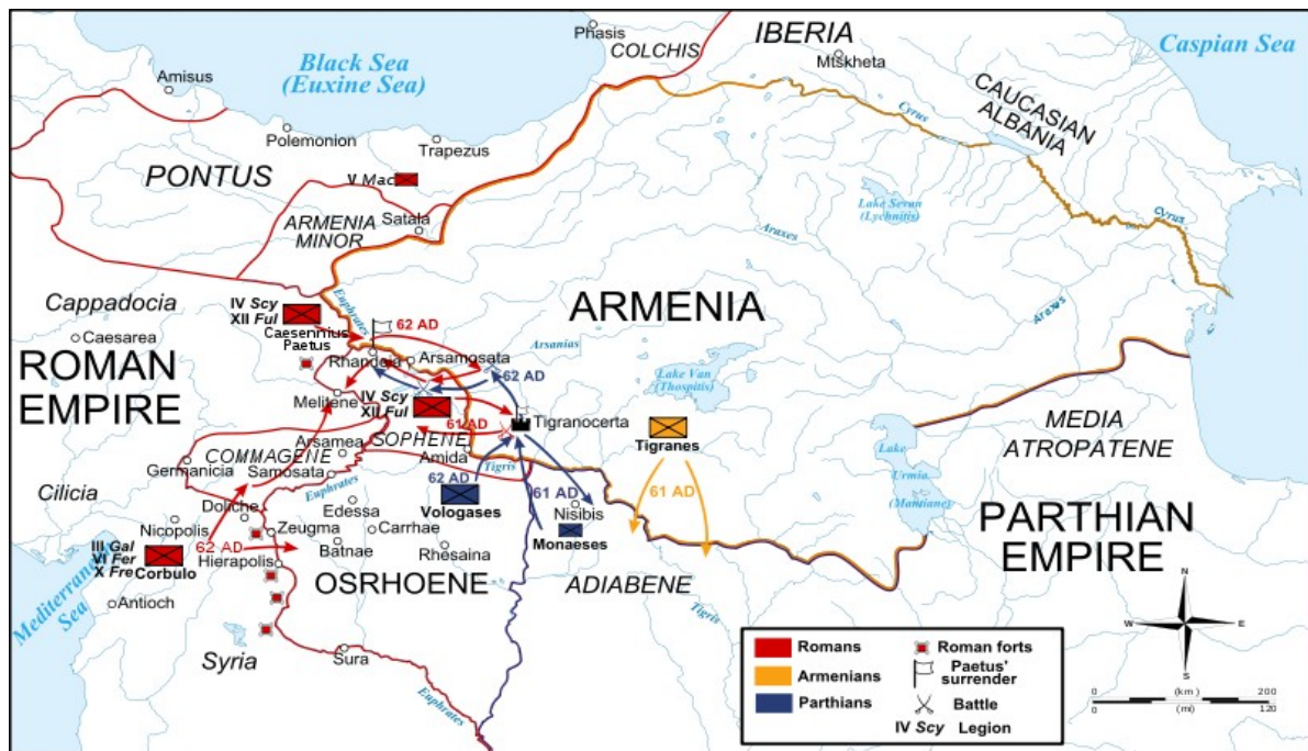
(Kart 5: Dette kartet er henta frå http://commons.wikimedia.org/wiki/File:Roman-Parthian_War_61-63.svg den 10.03.2011. Det viser dei ulike hærane sine rørsler under dei siste åra av krigen.)

I år 62 får Vologaesus høyre at broren hans har blitt jaga ut av kongeriket som han sjølv hadde gitt han, og at ein annan no er konge over landet. Han vil ha hemn over dette, men i følge Tacitus kan han ikkje gjere det, fordi han ikkje ville bryte freden han hadde med romarane og fordi provinsen Hyrcania framleis var i opprør mot partarane. Men når den nye armenarkongen Tigranes angrip Adiabene, eit kongedøme som var alliert med partarane, blir den partiske eliten sur. Dei likar ikkje at riket deira blir angripe av ein tidlegare slave av Romarriket, og kritiserer også Tiridates for å ikkje ha gjort nok for å halde på kongeriket sitt. Også kongen av Adiabene, Monobazus, reagerer. Ettersom partarane har forlatt Armenia, føler han seg ikkje sikker på at dei vil støtta han heller (Tac. Ann. 15.1).