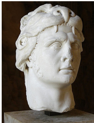
(Bilete 2: Byste av Mithridates VI Eupator. Henta frå http://en.wikipedia.org/wiki/File:Mithridates_VI_Louvre.jpg den 1.5.2011.)

Den første av dei tre konflikttane eg skal sjå på er den tredje mithridatiske krigen, då romarane for første gong kom skikkeleg i kontakt med armenarane. Men før eg kan begynne å analysere dei ulike handlingane i denne krigen, må eg sjå kort sjå på dei to tidlegare krigane som romarane førte mot kong Mithridates av Pontus.