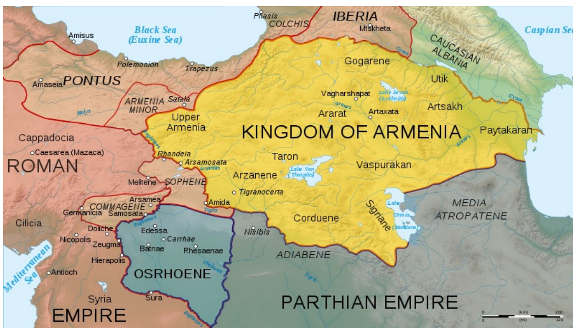
(Kart 1: Dette kartet er henta frå http://commons.wikimedia.org/wiki/File:Roman_East_50-en.svg den 3.5.2011, og viser det armenske kongedømet og nabolanda rundt år 50 evt.)

Strabon nemner også fleire elver som renn gjennom Armenia. Mange av dei har sitt utspring i Kaukasusfjella og har laga dei djupe dalane i landet. To av elvane, Phasis og Lucys, renn ut i Svartehavet, medan elvane Cyrus og Araxes renn ut i det Kaspiske hav. Dei siste to av dei store elvane som renn gjennom Armenia er Eufkrat og Tigris, som renn ut i Persiabukta, som Strabon feilaktig kallar Raudehavet (Str. 11.14.7). Av fjell er det først og fremst verdt å nemne Ararat, som ligg i dagens Tyrkia og er eit sårt tema for både Tyrkia og Armenia i dag. Av sjøar kan ein nemne Sevan, Van og Urmia, der Urmia er den største (Hewsen 2001: 17).