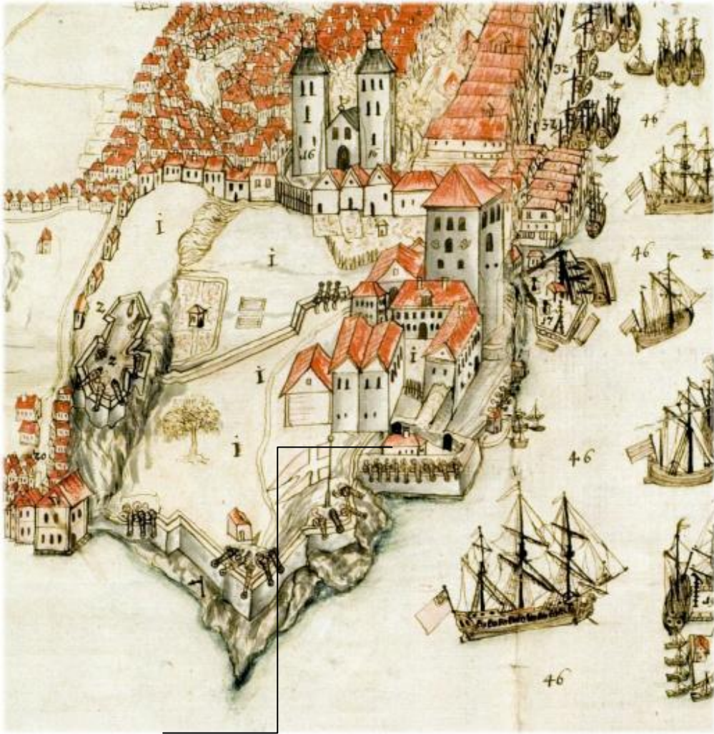
Figur 2: Bygninga som her er markert var slaverilokalet. utsnitt av perspektiv frå 1740-åra.