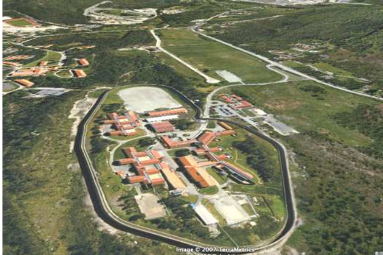
Bilde av Bergen fengsel