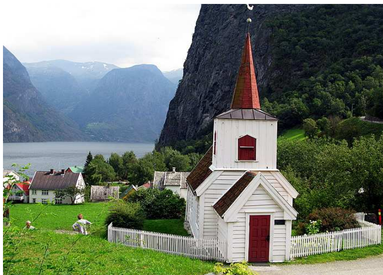
Figur 1: Undredal kyrkje sett frå aust

Undredal kyrkje er ei lita stavkyrkje som ligg i bygda Underdal i Aurland kommune i Sogn og Fjordane. Aurland kommune er å finne kring Aurlandsfjorden, som er ein av dei inste fjordarmene på sørsida av Sognefjorden. Kyrkja har om lag 40 sitteplassar, er utvendig dekt av kvitt panel, og har seks spissbua, smårutete vindaug. Kyrkja er enkel i si form, og består av eit rektangulært skip, eit kor i aust med same breidde som skipet, skjønt noko lågare, og eit mindre våpenhus i aust. Kyrkja har sadeltak. Den har ein takryttar over den austre delen av skipet. Kyrkja sitt kor kviler på ein mur som er bygd opp i ein skråning, og våpenhuset stikker ut i ein liten grusveg som må gjere ein sving rundt kyrkja. Eg vil i denne delen freiste å gje ei oversikt over dei ulike elementa til kyrkja, med årstal der det lar seg gjere, gje ei oversikt over tidlegare restaureringsarbeid samt sjå på kva stavkyrkjeprogrammet har gjennomført så langt.