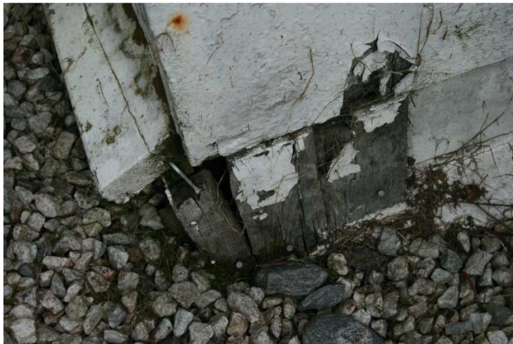
Figur 13: Råteskade på våpenhuset

Det arbeidet som no er i gang i Undredal, og som nærmer seg slutten, er istandsetting og utbetring av sjølv konstruksjonen til kyrkja. Nedre Jølster Bilelag har i 2012 arbeidd med dette, og har i all hovudsak måtte fokusere på det så mange gonger påpeika problemet med utilstrekkeleg lufting mellom botnen av kyrkja og terrenget under. Dette var første gongen trekt fram i 1927, og har i løpet av 1900-talet fått nokre melombelse løysingar, stort sett gjennom senking av terreng ved å grave rundt kyrkja, og, i 1982, erstatting av grastorv med singel innerst mot konstruksjonen. Dette har difor vore primærfokuset til Stavkyrkjeprogrammet si hansaming av bygningskroppen til Undredal kyrkje. I tråd med Domenico Erdmann sitt forslag i 1927 har kyrkja no vorte heva 30 cm, og det har blitt laga ny mur under henne. Dette vil føre til betre lufting under kyrkja, og følgeleg forebygge problem med råte. Bjelker og stokkar som har vorte skadd av råte og innsekt har vorte skifta ut, saman med den nederste delen av det utvendige panelet. Svillene i skipet låg så å seie rett på bakken, og tilstanden i våpenhuset var ikkje noko betre. Koret er den einaste delen det ikkje, med unntak av hevinga, har vore naudsynt å gjøre noko med. Dette vart da også samvitsfullt behandla etter synfaringa i 1982. Dette arbeidet, med delvis fjerning av ytre panel, har gitt Riksantikvaren sine folk anledning til å sjå nærmare på den originale