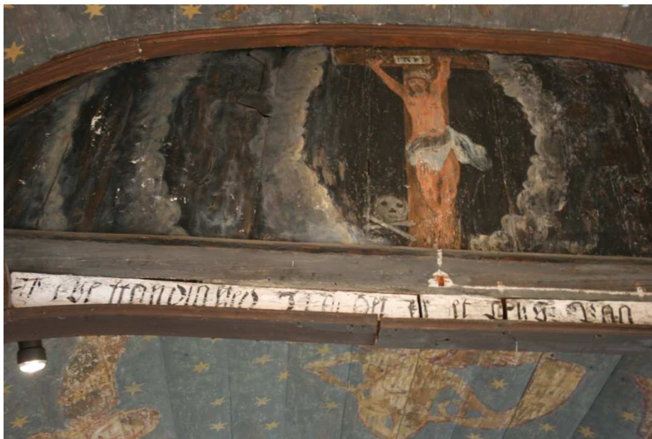
Figur 3: Krossfestinga over inngangen til koret

I det indre av bygget er det også lite som vitnar om den opphavlege stavkyrkja. Vegg- og takmaleri er etterreformatoriske, og tønnekvilvet som takmaleria er gjort på er også eit seinare tillegg. Me veit ikkje sikkert når kvilvet vart sett inn, men dersom ein skal ta utgangspunkt i stilen til takmaleria, kan det ha vore mot slutten av 1500-talet, kan hende i byrjinga av 1600-talet. Under kvilvet er framleis delar av saksestolkvilvkonstruksjonen synleg. I aust og vest er dei originale gavlane delvis bevarte. 160 Dateringa av måleria herskar det mykje usemje kring. Over inngangen til koret finn me truleg noko av den eldste utsmykkinga i kyrkja (figur 3). Her er eit krossfestingsmotiv, og det er mogleg at skyane og bakgrunnen kan sporast heilt attende til 1200-talet. Det same kan svarte linjer som markerer listene langs tak og veggar. I krossfestingsmotivet over korinngangen har Kristus sjølv vorte måla på ny på eit seinare tidspunkt, truleg på 1600-talet, for å tilpassast det nye avgrensa arealet som var resultat av innsettinga av tønnekvilvet. Avgrensinga av areal har også truleg ført til at det ligg ein oppatt-måla daudingskalle attmed Kristus sine bein, heller enn under desse, der den nok eigentleg skulle ha vore plassert. Øvste del av krossen i krossfestingsmotivet, sett frå skipet, ber preg av å ha blitt delt av kvilvingen, og syner seg berre som ein T for kyrkjelyden. Dette kan tyde på at det er eldre enn kvilvet.