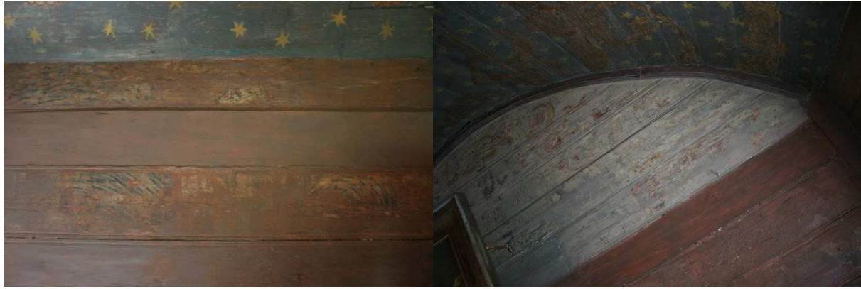
Figur 8: Korets nordvegg