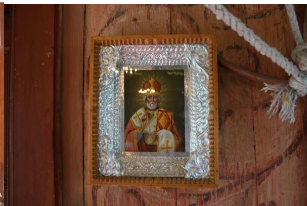
Figur 12: St. Nikolai

Dei mange spørsmåla som framleis står utan svar, gjør at det skumle med eit kvart arbeid med bygget er tap av element som potensielt løyner løysningar. Like fullt er eit utbetningsarbeid i kyrkja på høg tid og naudsynt. Dette gjeld særleg eit problem som har vore trekt fram i fleire omgangar frå 1927 til i dag, nemleg at terrenget rundt ligg for tett opptil botnen av kyrkja, og fører til fuktskadar og råte.