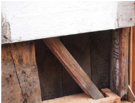
Figur 11: attbruksmaterial i våpenhus

Eit aspekt ved Undredal Stavkyrkje, ved sidan av at den er eit historisk dokument, er nemleg at det er ei levande og aktiv soknekyrkje som framleis er i regelmessig bruk. Kyrkja er dermed ikkje ferdig med å spele si rolle for lokalbefolkninga og bygda. Kyrkjelyden har framleis behov for å sette sitt preg på bygget. Eksempel på dette frå nyare tid er dei nye benkane frå 1980-åra som vart satt inn etter at kyrkjelyden kravde betre komfort, og eit russisk-ortodoks St. Nikolai-ikon som henger bak ved inngangen til skipet (figur 12). Ikonet er ei gåve bygda fekk då den lokale barneskulen vitja ei venskapsbygd i Sør-Rusland i 2001. Det er lokalt trass mot biskop og vernemyndigheiter sine vurderingar som gjør at det i dag henger på veggen. Til trass for at helgenkultusen vart avvikla under reformasjonen, har Undredal haldt fram med å feire St. Nikolai-dagen den 6. desember, ei feiring som først og framst har ein samlande funksjon for den vesle bygda i dag. Ikonet fungerer difor som ein slags identitetsskapar for lokalsamfunnet, og som ei forteljing om bygda si nyare historie.