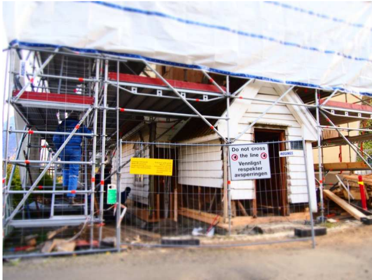
Figur 14: Undredal kyrkje under Stavkyrkjeprogrammet

kyrkja vart bygd ein gong på den siste halvdel av 1100-talet. Etter kvart som prosjektet vert avslutta, vil truleg eit meir heilskapleg bilete teikne seg.