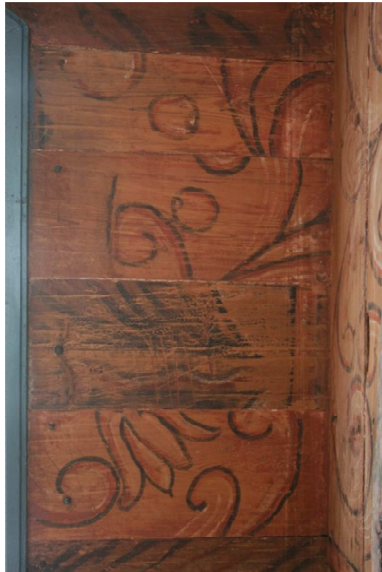
Figur 5: Dekoren som eit feillagt puslespel i den bakre forleninga av skipet

Veggane i skipet er ved sidan av dekorasjonen, også interessante grunna ein del merker og inskripsjonar me kan finne der. På sørveggen finn me noko såkalla kyrkjegrafitti som er fri frå den øvrige dekormålinga, ramma inn av tynne svarte strekar. Det er tre slike felt. Det eine syner ein mann med øks, eit felt er ei rekke sirkclar fletta inn i kvarande, og det siste er eit vesen som kan likne på ein hest, eller eit slags fabeldyr med drakehovud som bit seg i halen. Nøyaktig kva det skal vere er ikkje lett å seie, og det kjem mange ulike forslag frå ulike betraktarar. Om lag \frac{3}{4} oppe på veggane bakarst i det opphavlege skipet ser me fire rektangulære merker. To på kvar side (figur 6). Her har det i si tid vore eit galleri over den gamle vstdøra. Galleriet vart fjerna kring 1860. Historier på bygda vil ha det til at grunnen til fjerning var at ungdommen som nytta seg av galleriet hadde ei stygg uvane med å spytte ned i hovuda til dei som sat under. På dei fire originale hjørnestavane samt midt på kvar vegg av det opphavlege skipet finn me til saman seks kors rissa inn (figur 7). Desse vart truleg rissa inn då kyrkja først vart tatt i bruk som del av innvigsla av kyrkja.