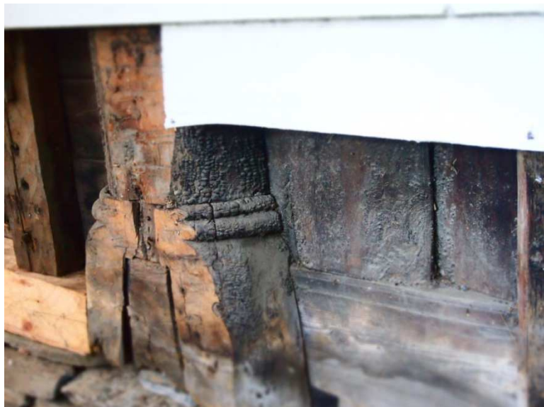
Figur 2: Basen på framre stav mot sør.

å kome med ei datering på grunnlag av stil, om enn noko vid. Basene til stavane har doble vulstprofilar med ein tydeleg romansk form (figur 2). Dei ytre profilane til veggplankane har likskapstrekk med materialet som finnes i dei nyare delane av Urnes stavkyrkje. Alt dette talar for at kyrkja vart reist i løpet av den siste halvdel av 1100-talet. Eit anna dokumentasjonsarbeid som er i gang, men enno ikkje avslutta, av takverket i kyrkja kan truleg seie meir om saka. 152