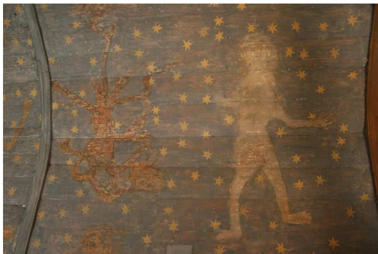
Figur 10: Kamp mellom det gode og det vonde? Dekor i den sør-austre hjørnet av den opphavlege delen av skipstaket

sola» som figurerer i Johannes' Openbaring. Ho er eit bilete på den rette tru, og eit symbol på jomfru Maria. Dette passar i så høve saman med resten av dommedagsikonografien, som også finn støtte i Openbaringa. Attmed kvinneskikkelsen er det måla ei krossfesting, og attmed denne igjen eit lite Jesusborn. I det nordaustlege hjørnet av taket er ein skikkelse som gjør ein velsignande gest. Dersom me tar omsyn til at det truleg har vore eit dåpskammer kring ein døypefont rett under denne skikkelsen, kan me gjette på at det skal vere døyparen Johannes.