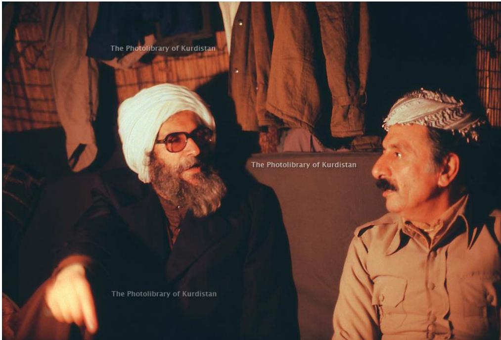
Iran 1979. Sheikh Ezzedine et Abdul Rahman Ghassemlou.Iran 1979. Sheikh Ezzedine and Abdul Rahman Ghassemlou at the headquarters of KDPI.