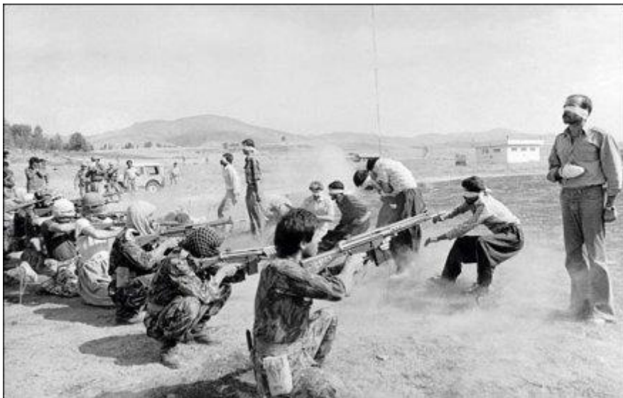
In 1979, the only anonymous photograph captured nine Kurdish rebels and two of the executed by firing squad in revolutionary Iran. 424