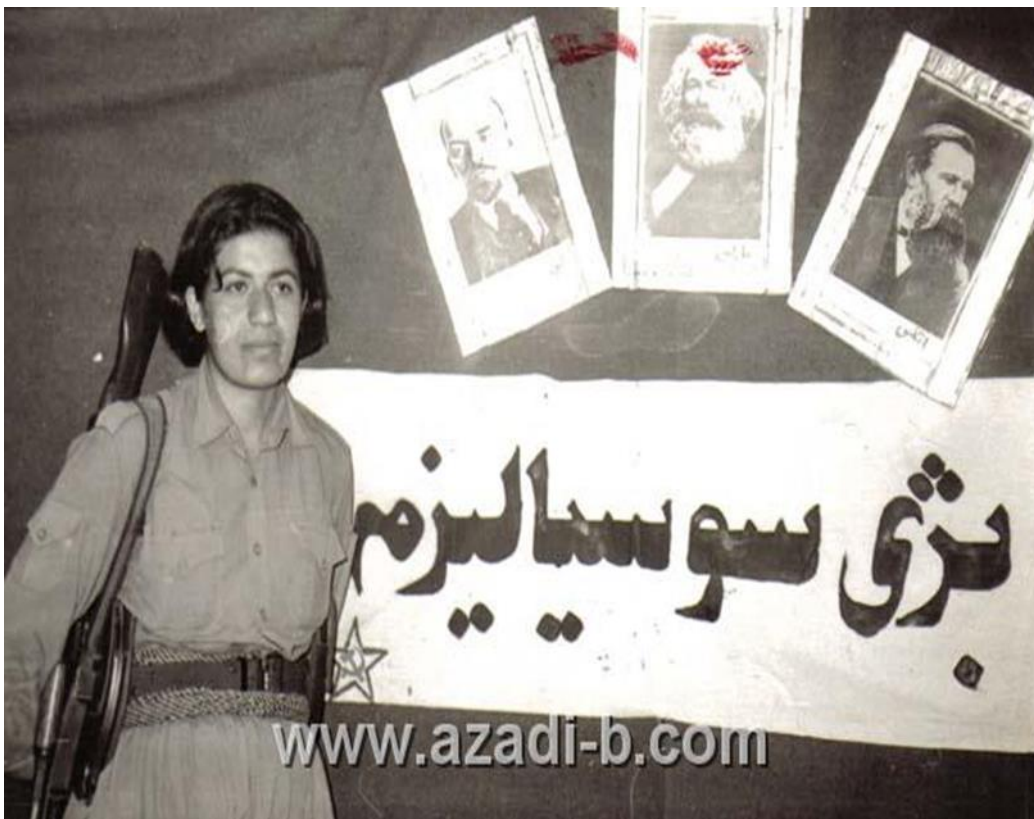
Bildet viser første kvinnelige Peshmarga gruppen fra Komala 425