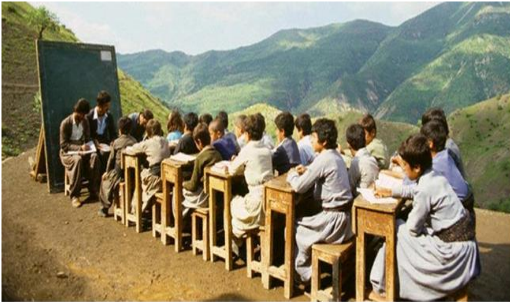
Bildet låt fra venner på facebook.