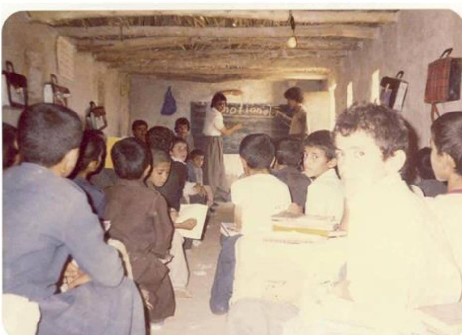
Nasjonalisme time i skolen.