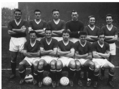
The Busby Babes

I mellomkrigsåra sleit Manchester United både på bana og utanfor bana. Mykje arbeid vart øydelagd under krigen, og leiinga i klubben kalla inn til eit møte då verdskrigen gjekk mot slutten. No ville sjefane prøve å starte på nytt med Matt Busby som manager. Busby hadde då vore fotballspelar for klubbivalen Manchester City og for Liverpool. Han signerte kontrakten med 10 000 kroner i årslønn. Oppgåva var å gjere verdas mest populære klubb til eit storlag igjen, men det skulle ikkje vere vanskeleg for Matt Busby å gjere. Medan Busby avslutta oppgåvene sine i Italia, møtte han på Jimmy Murphy i denne perioden. Murphy var fotballtrenar i sør-Italia, dei fann tonen veldig raskt. Murphy blei assistenten for Busby og sjefen for reservelaget til Manchester United. Dette var starten på noko heilt unikt! Laget blei kalla "The Busby Babes" på grunn av den unge alderen på spelarane og trua på unge og eigne talantar.