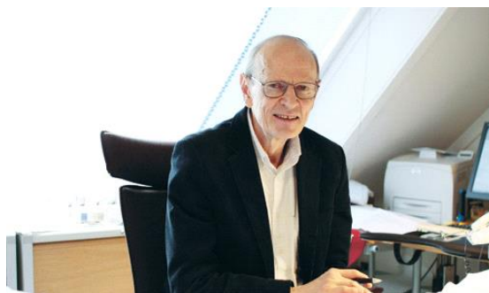
Dan Olweus.