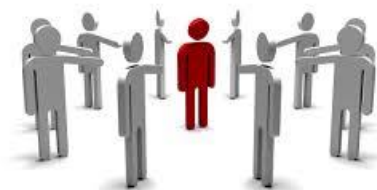
En person blir gjengmobbet

I skoletiden blir mange elever mobbet. Mange flere enn man skulle tro! Det er enkelte personer/elever som blir valgt ut som et offer for mobbingen. Både en gruppe på flere personer og en enkelt person kan være mobberne, det kommer an på hvor stor plassen er og om det er et samfunn der det er mye mobbing. Ofte er det populære elever blant elevene eller lærerne som er mobberne, og de utsatte ofrene lider gjennom hver dag. Det skal ikke være sånn! For lærerne sin skyld, er det ikke enkelt å oppdage mobbing mellom elevene. Mobberne er for flinke til å skjule det for andre. Digital mobbing og fysisk mobbing er to store typer for mobbing som er vanskelig å legge merke til og stoppe. Den digitale mobbingen er blitt vanskeligere å oppdage enn den fysiske mobbingen. Digitale verktøy har blitt et større og større problem for samfunnet når det gjelder sosiale medier og mobbing, i den nyere tiden. Mobbing er alvorlig og bør tas seriøst. Det er skolen sitt hovedansvar å stoppe mobbingen!