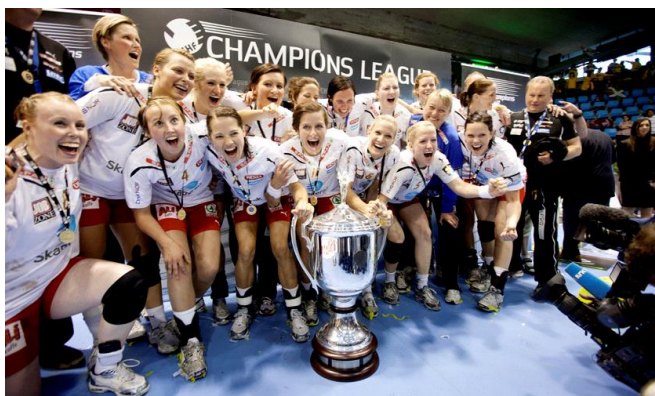
Larvik HK vinner Champions League i 2012.

Den norske topphandball serien i Noreg heiter Postenligaen, spelarane som spelar i denne divisjonen – lever av nettopp det, og spele handball. I Postenligaen i dag er det med tolv ulike klubbar, og mange på heilt forskjellige nivå. Det er tre lag som ligg i toppen – Tertnes på tredje plass, Storhamar på ein andreplass og Larvik HK som ein suveren leiar på toppen. Det skiljar heile åtte poeng ned til Storhamar frå Larvik, som har trumferte Postenligaen i heile ti år på rad!