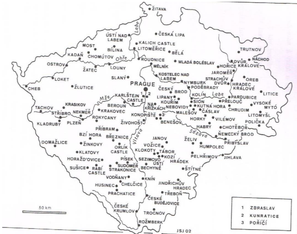
Bøhmen på 1400-talet. 1