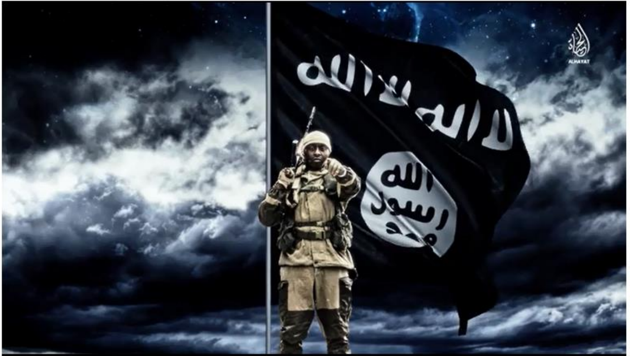
Bilde 1. Skjerm bilde fra omtalt IS-propagandavideo (LiveLeak 24.11.2015).

Den 4 minutter og 14 sekunder lange propagandavideoen åpner med en logo med skriften «Al-Hayat media Center», navnet på gruppens største medieavdeling, og man får med en gang et inntrykk av å se på en profesjonelt laget informasjonsvideo. Det er en blanding av stillbilder, avansert grafikk, tall og figurer og levende bilder. Fortellerstemmen i videoen snakker engelsk med klar amerikansk uttale, og starter filmen med å introdusere det selvproklamerte kalifatet: «This is our Khilafah in all its glory» (LiveLeak 24.11.2015).