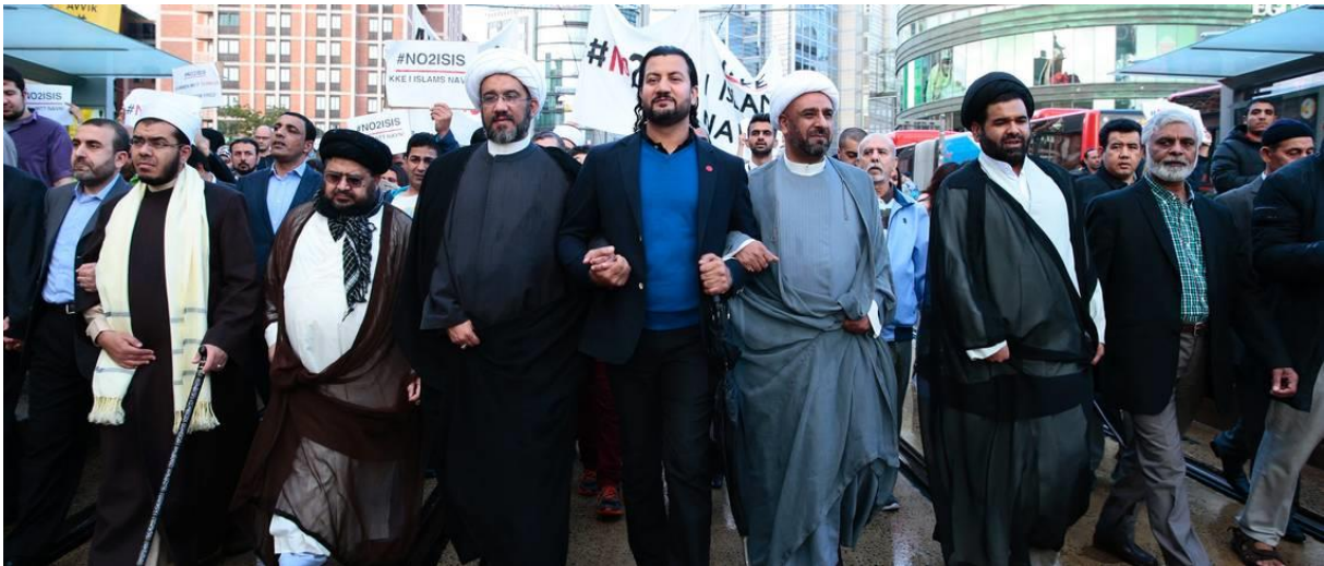
Bilde 4. Muslimske religiøse ledere i demonstrasjonstoget på vei mot stortinget