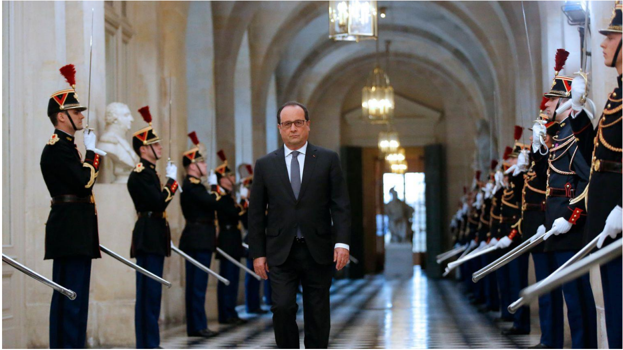
Bilde 2 François Hollande ankommer slottet i Versailles.